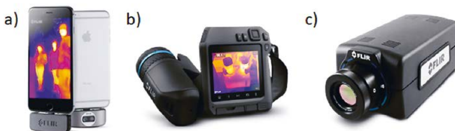
Figure 1. Exemples de caméras infrarouge commerciales : a) module pour smartphone ; b) caméra thermique compacte portable ; c) caméra thermique refroidie hautes performances.

l'objectif est réalisé avec des matériaux spécifiques à l'infrarouge, tels que le germanium (Ge) ou le sélénure de zinc (ZnSe). La matrice de détecteurs, quant à elle, doit utiliser un autre matériau absorbant que le silicium, qui n'est plus sensible au-delà de 1,1 \mu\text{m} . Les semiconducteurs candidats ne manquent pas, d'où l'existence d'un nombre important de filières technologiques, chacune ayant ses avantages et ses inconvénients.