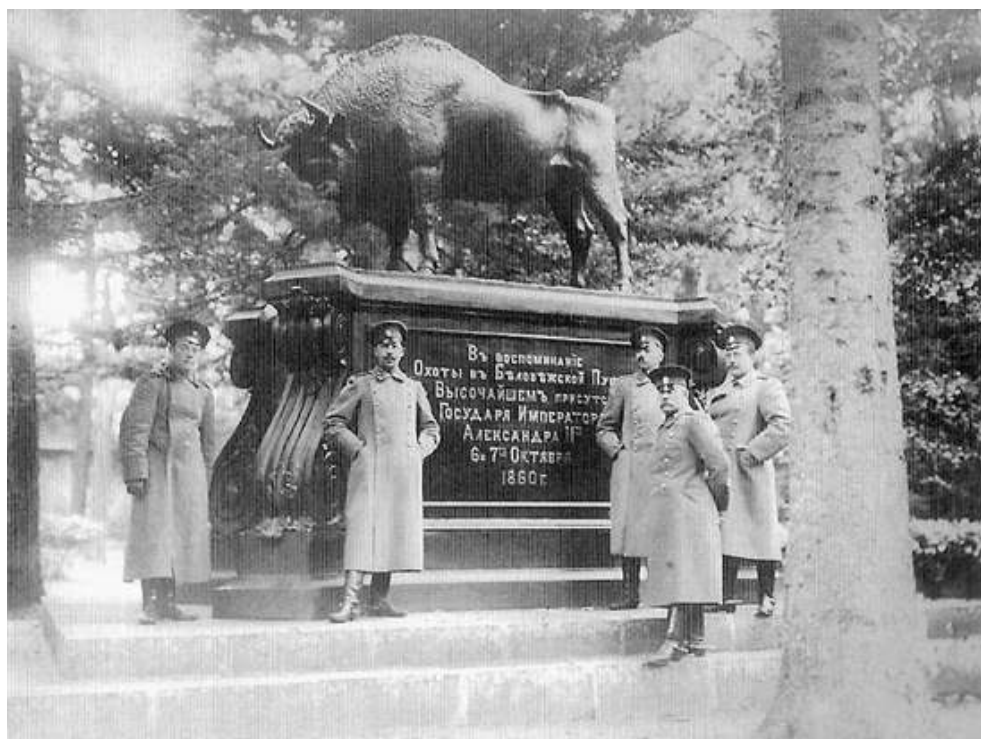
Figure : Officiers russes devant le bison de Zwierzyniec (1912)

Dédicace : « En souvenir de la chasse qui eut lieu dans la forêt de Białowieża en présence de l'Empereur Alexandre II – 6-7 octobre 1860 ». [Trad. : A. Derboule]