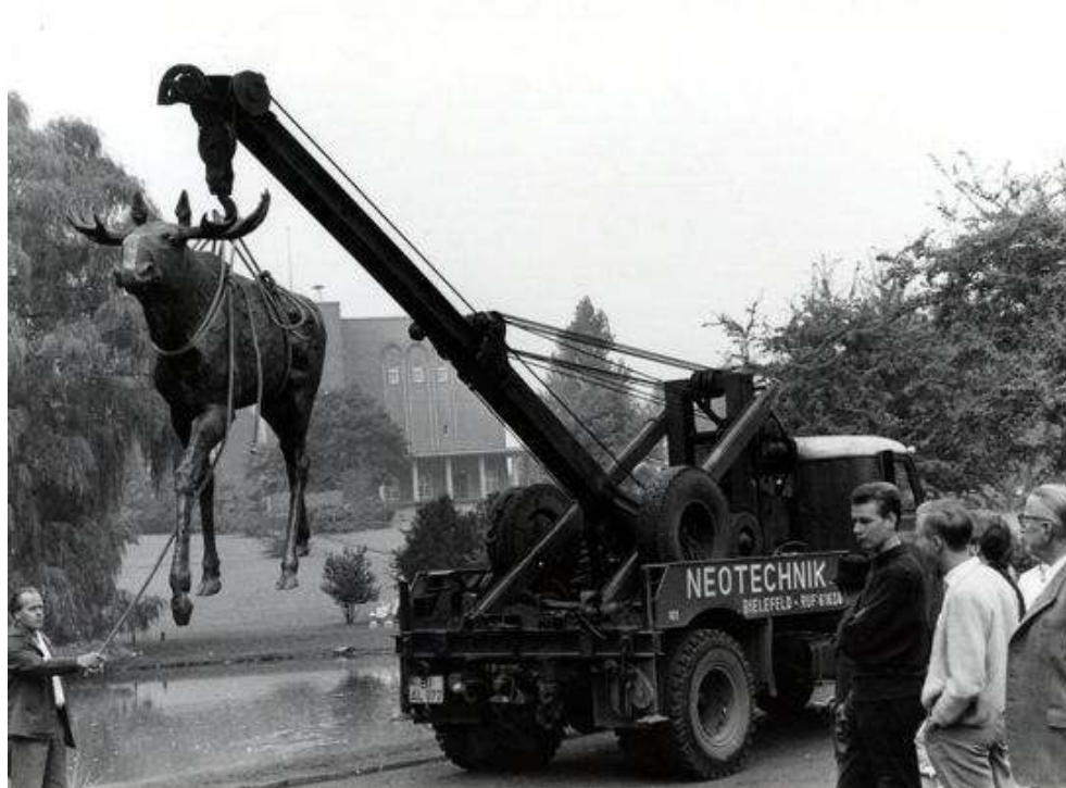
Figure : Transport de l'élan dans le Bürgerpark de Bielefeld (1961)