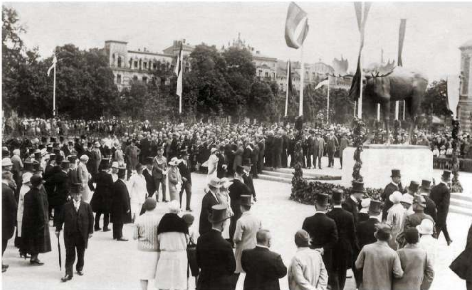
Figure : Inauguration de l'élan de Tilsit le 29 juin 1928

animale, élément essentiel de l'éthique nobiliaire prussienne marquée par l'imaginaire cynégétique (Theilemann, 2004 : 53-202) aux autres strates de la société. La bourgeoisie urbaine, fascinée par le style de vie aristocratique, a, depuis la révolution de 1848, investi le terrain de la chasse et considère cette conquête comme un signe de son ascension (Hiller, 2003 : 57-58). En commandant la statue, les haut-fonctionnaires de Prusse orientale, issus de la bourgeoisie, s'inscrivent donc dans une démarche de prestige. Après 1918, la province, séparée du reste du pays par le corridor de Danzig, est de plus en plus perçue comme un poste avancée de la germanité à l'Est et se forge une identité originale (Traba, 2010). Vordermayer réalise dans ce contexte une réplique de la première statue, avec quelques modifications sur le pelage et la tête. À l'origine, il s'agissait d'une commande du Ministre-Président Otto Braun (SPD), grand amoureux des paysages de la Prusse orientale – il fera classer la Rominter Heide réserve naturelle en 1930 – et lui-même chasseur passionné (Neumärker et Knopf, 2012 : 35). Braun désirait faire cadeau de la statue à sa ville natale, Königsberg, mais les autorités municipales l'ayant refusé pour des raisons inconnues, c'est finalement à Tilsit, ville située plus à l'Est, qu'il est installé (Dilba, 1995 : 32). Son inauguration a lieu en grande pompe en 1928 (cf. figure 2).