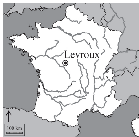
Fig. 1. Localisation du site de Levroux Les Arènes.

Le but de cette étude est de caractériser, par une analyse des compositions isotopiques en azote et en carbone du collagène de l'os, l'alimentation des porcs domestiques de Levroux, afin de déterminer dans quelle mesure celle-ci a pu peser dans la pratique d'un élevage en partie voué à la production de viande pour des échanges ou