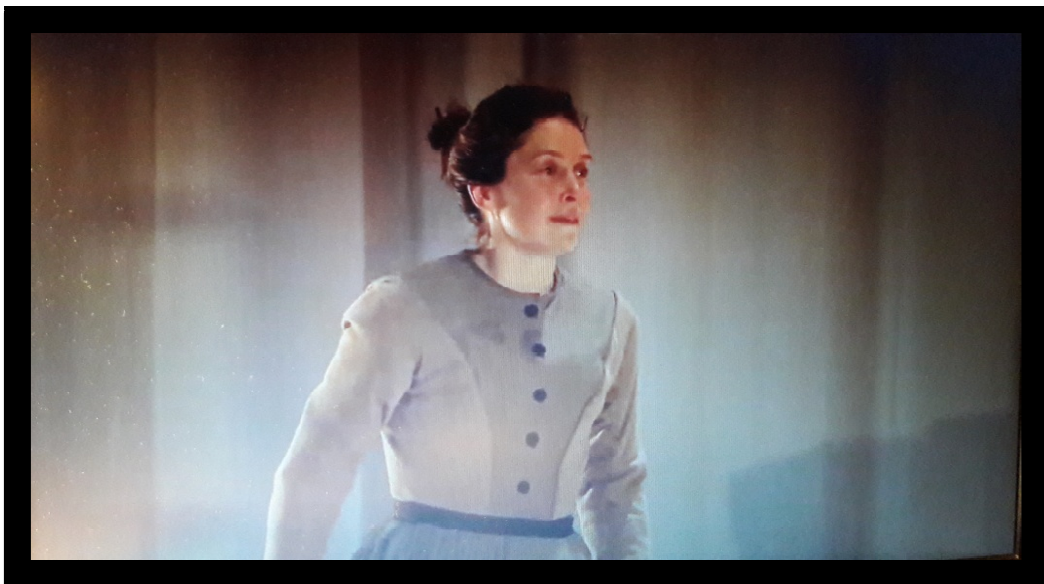
Fig. 2 : Madeleine Worrall dans le rôle de Jane Eyre. Jane Eyre , National Theatre Production 2015, diffusion National Theatre at Home, avril 2020.

L'actrice choisie est de relativement petite taille et correspond à la description du livre (« little friend » dit Rochester). Elle est simple, sans maquillage, sans apprêt, naturelle. La robe qu'elle porte, d'un gris uni, illustre cette nature. D'un style 19 ème siècle, les robes dessinées par Katie Sykes restent relativement courtes (au dessus de la cheville) et permettent ainsi suffisamment de liberté de mouvement pour grimper aux diverses échelles du décor. Ceci donne un air de modernité aux costumes et illustre la propre modernité de Jane Eyre dans sa volonté d'émancipation féminine. Entre liberté et contrainte, les costumes aussi illustrent le propos de la pièce et le paradoxe dans lequel se trouve Jane – exister telle qu'elle est ou bien mourir.