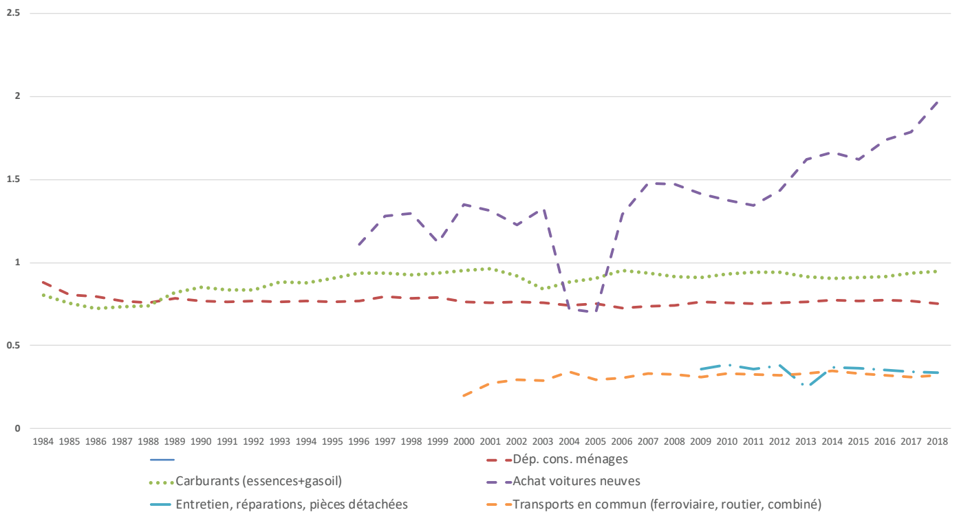
Figure 1: Rapport des dépenses estimées sur la base de ParcAuto aux Dépenses de Consommation Effective de la Comptabilité Nationale.

Par ailleurs, en divisant ce revenu par le nombre d'unités de consommation du ménage (1 pour la personne de référence, 0,5 pour les autres membres de 15 ans ou plus et 0,3 pour les enfants plus jeunes), on approxime un niveau de vie, dont la distribution permet de classer les ménages en 4 quarts d'effectifs pondérés comparables.