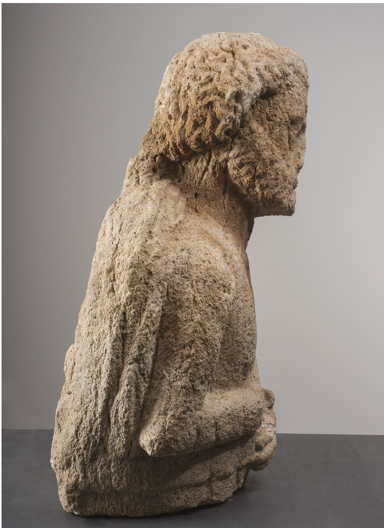
Fig. 5: Buste masculin, profil droit. Calcaire de La Couronne