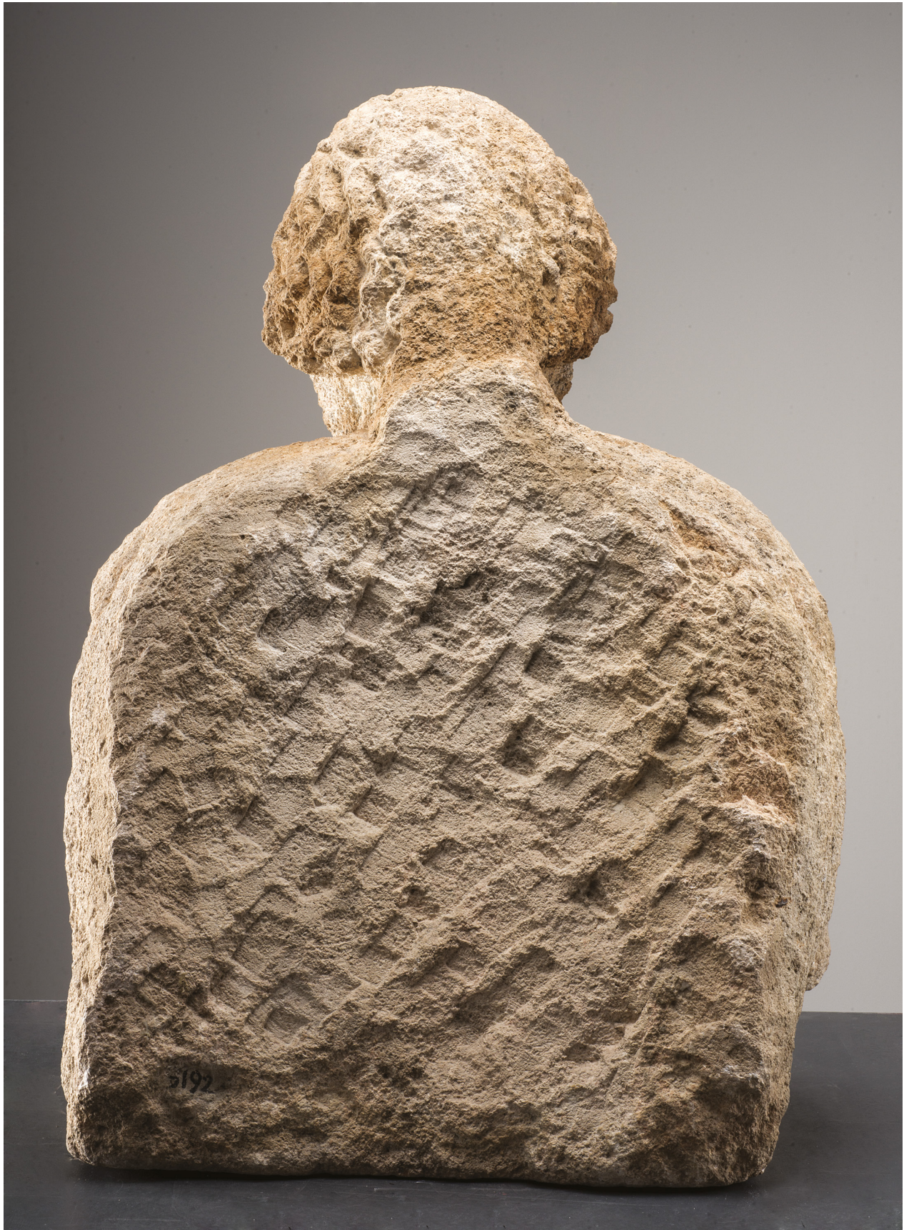
Fig. 4 : Buste masculin, vue de dos. Calcaire de La Couronne