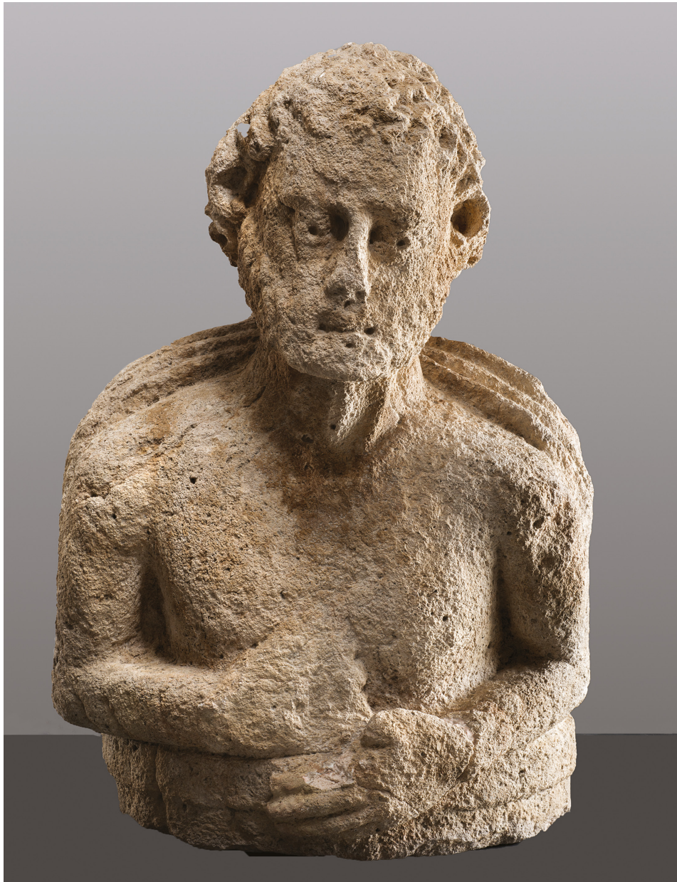
Fig. 2: Buste masculin, vue de face. Calcaire de La Couronne