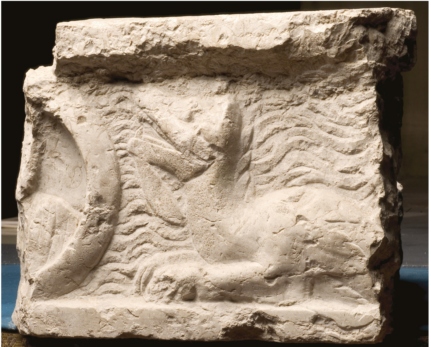
Fig. 20: Couvercle fragmentaire. Pierre de Cassis