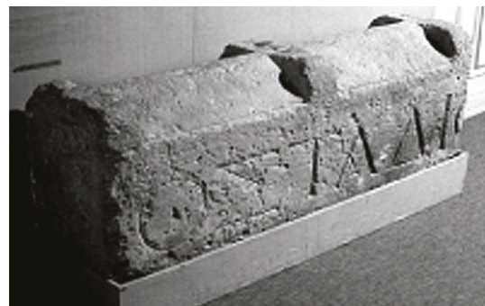
Fig. 6: Bloc fragmentaire. Calcaire de La Couronne (d'après Rothé, Tréziny 2005, fig. 497)