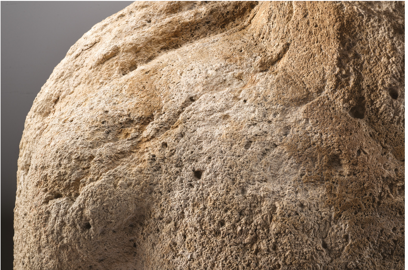
Fig. 3 : Buste masculin, détail de l'épiderme. Calcaire de La Couronne