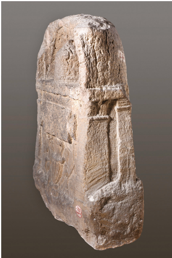
Fig. 14 : stèle de Primigéneia, petit côté gauche. Calcaire de couleur brunâtre