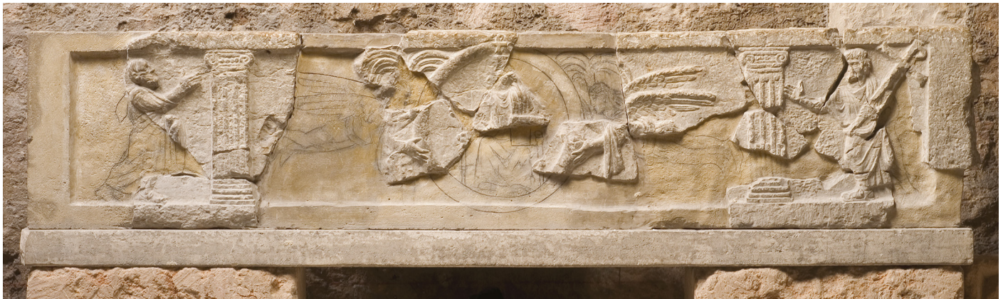
Fig. 16: Sarcophage à éléments architectoniques. Pierre de Cassis