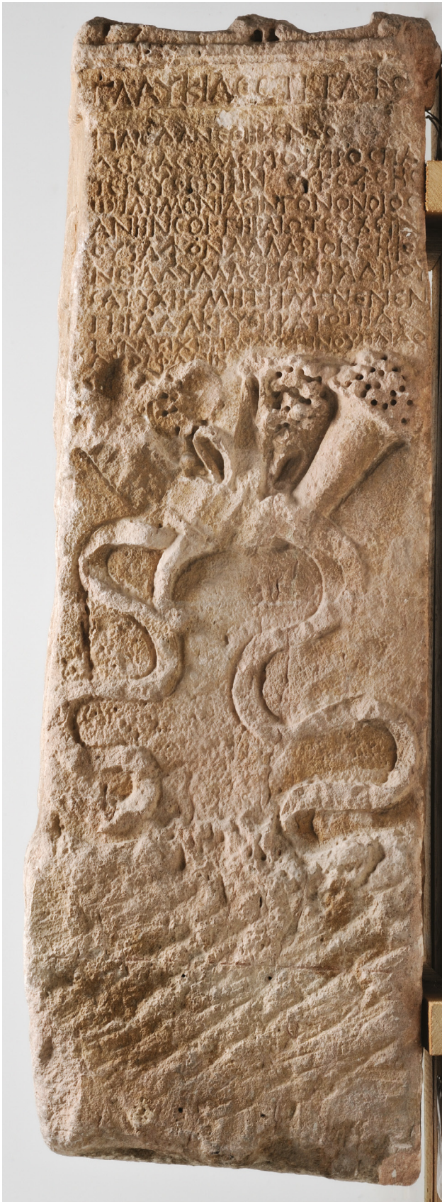
Fig. 7 : Autel de Glaukias, face avec l'épithaphe. Calcaire de La Couronne