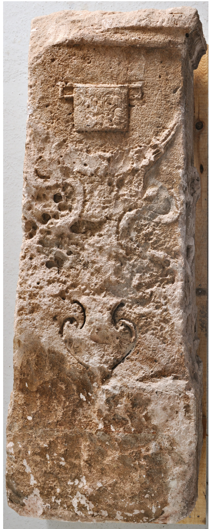
Fig. 9 : Autel de Glaukias, vue du côté latéral gauche. Calcaire de La Couronne