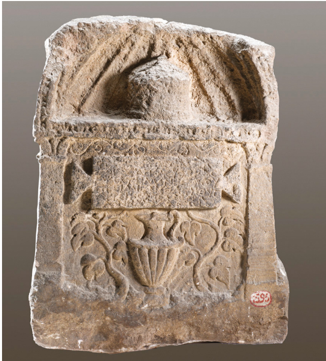
Fig. 13 : Stèle de Primigéneia, vue de face. Calcaire de couleur brunâtre