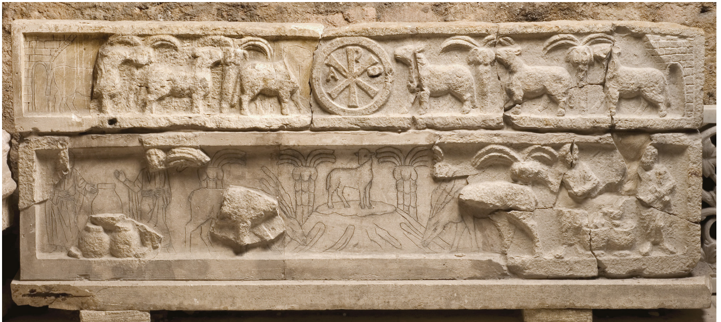
Fig. 19: Sarcophage à frise continue. Calcaire de Saint-Victor (cliché L. Damelet, CNRS, CCJ)