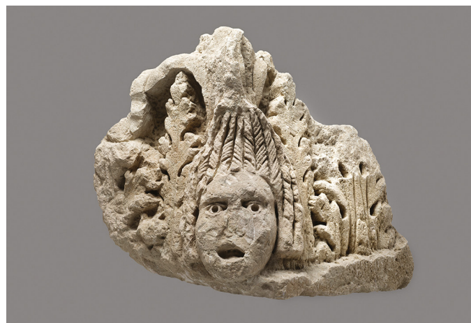
Fig. 1 : Acrotère cornier découvert lors des fouilles du secteur de l'Alcazar. Calcaire de La Couronne (cliché Ch. Durand, CNRS, CCJ)

2013.9.5.2. : Paillet, Tardy 2001, p. 253-256, fig. 727-732 ; Rothé, Tréziny 2005, p. 590, fig. 801 ; Pédini 2013, p. 178 ; Gaggadis-Robin 2018 p. 69-70 n° 087, pl. 74-75.