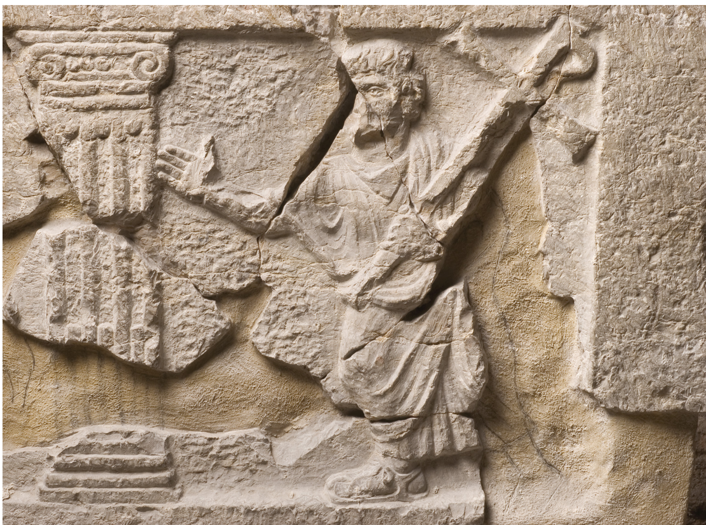
Fig. 17: Sarcophage à éléments architectoniques, détail du personnage de droite

probablement local 49 . Ses trois côtés sont décorés de scènes fortement symboliques 50 . Le relief plat et sommaire, entièrement effectué au ciseau ne dessert pas l'originalité du choix des thèmes, clairement figurés, pour mieux exprimer leur symbolisme, élément prédominant sur cette pièce.