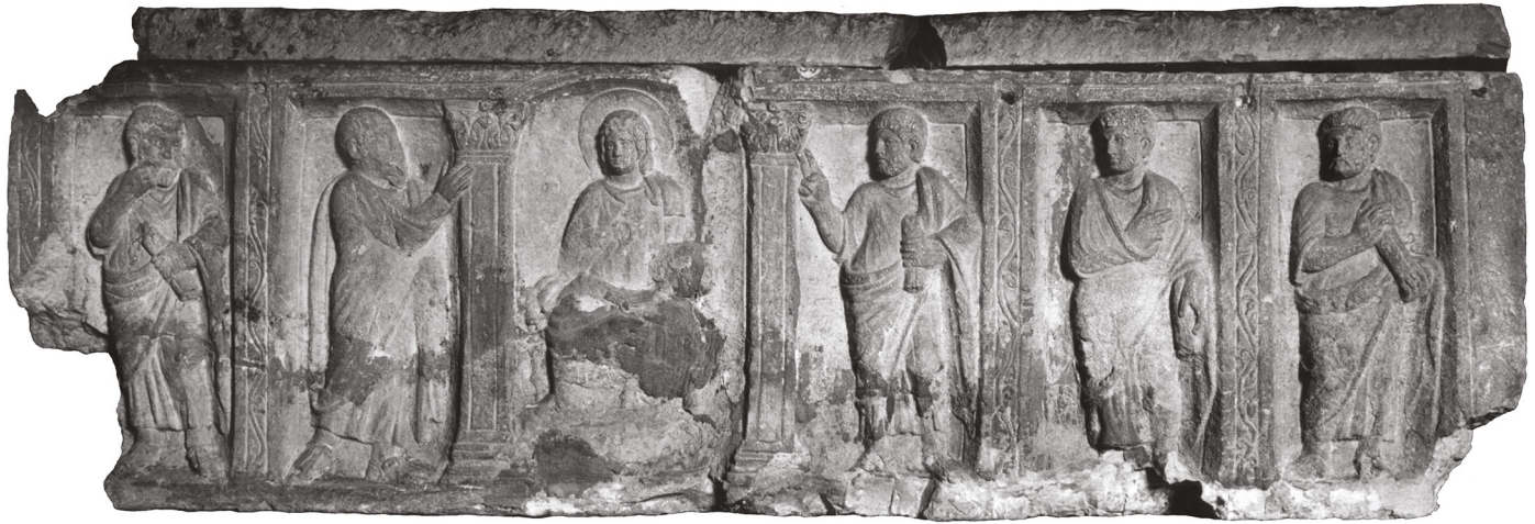
Fig. 15: Sarcophage paléochrétien à niches rectangulaires. Pierre de Cassis

modèles classiques. Le Christ trône dans la niche centrale, son visage se détachant sur l'auréole 46 . La composition est simple, voire rigide. Les personnages y figurent, dans une attitude presque identique, tournés vers le Christ. Le travail rapide laisse de côté volontairement l'exécution des détails.