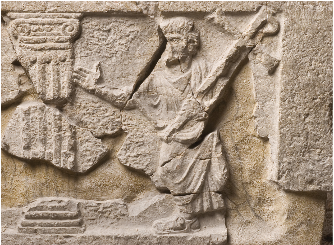
Fig. 17: Sarcophage à éléments architectoniques, détail du personnage de droite

probablement local 49 . Ses trois côtés sont décorés de scènes fortement symboliques 50 . Le relief plat et sommaire, entièrement effectué au ciseau ne dessert pas l'originalité du choix des thèmes, clairement figurés, pour mieux exprimer leur symbolisme, élément prédominant sur cette pièce.