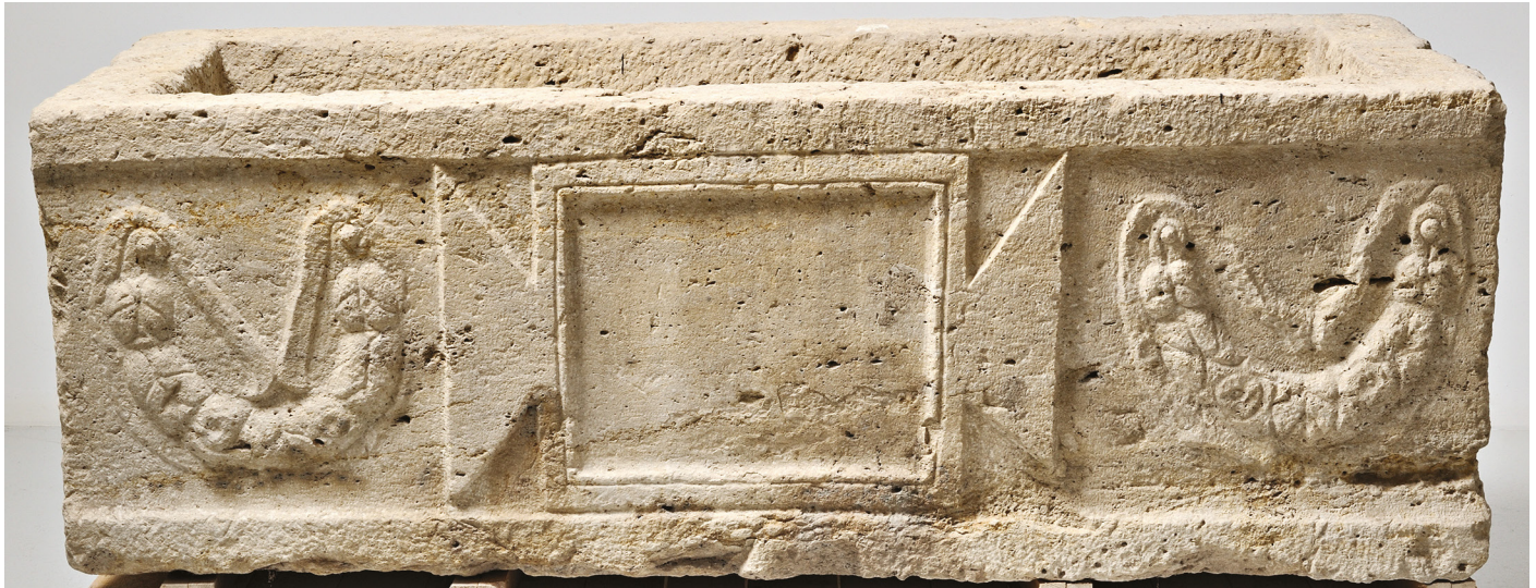
Fig. 11 : Sarcophage à guirlandes. Calcaire coquillier