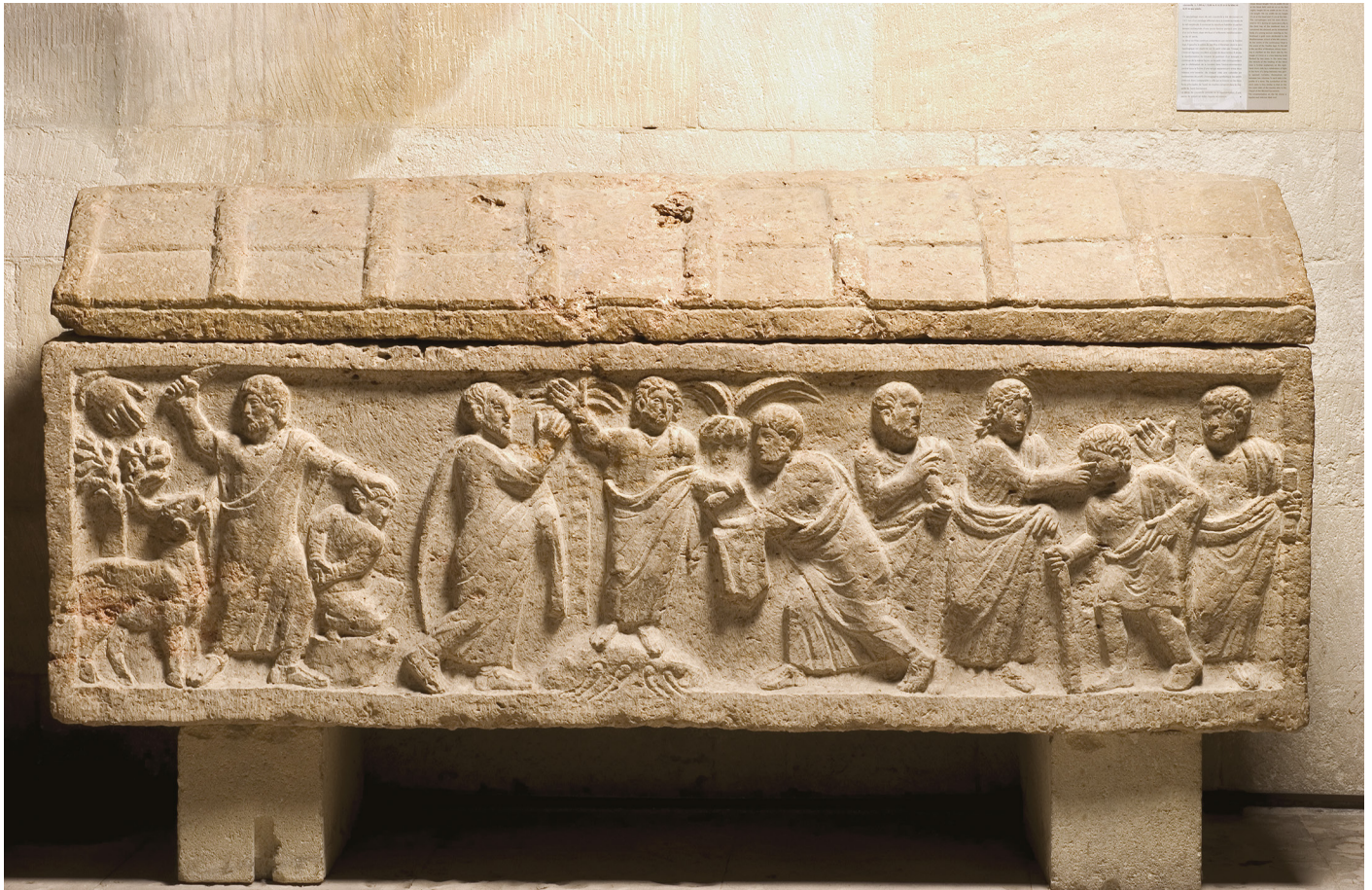
Fig. 18: Sarcophage à frise continue. Travertin