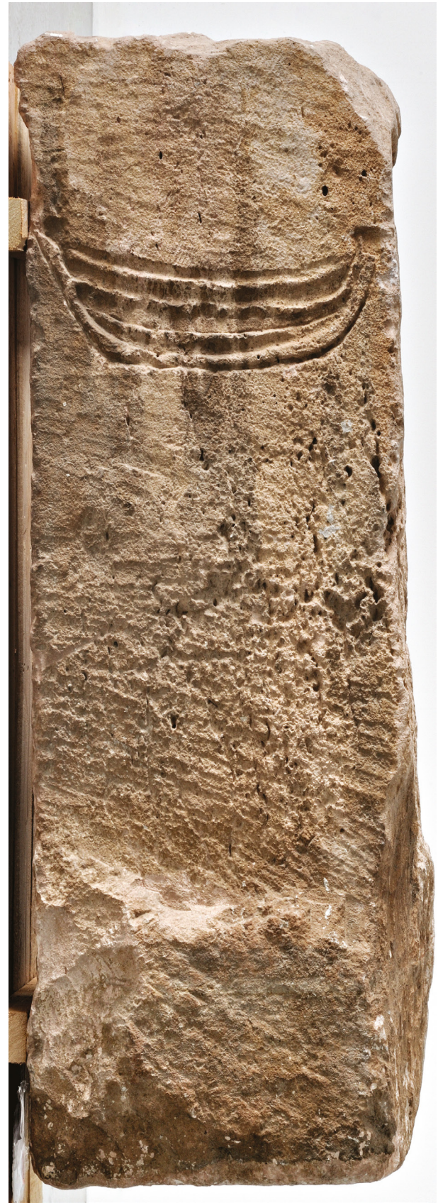
Fig. 8 : Autel de Glaukias, vue de l'arrière. Calcaire de La Couronne