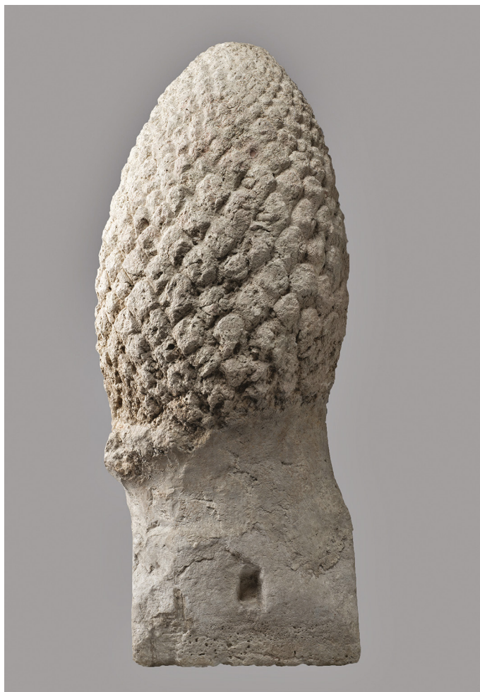
Fig. 10 : Pomme de pin monumentale

calcaire beige. Sa hauteur considérable 28 indique qu'elle couronnait probablement à l'origine un mausolée que l'on peut dater du I er siècle apr. J.-C. La pièce, cassée en deux fragments réunis par du plâtre, repose sur une base carrée. Sur deux des côtés subsiste une mortaise de forme carrée qui servait à la fixation de l'objet. Les écailles de la pigne, de taille variable, sont traitées avec naturalisme, assez profondément sculptées à la pointe. La pomme de pin, devenue un symbole funéraire et un symbole d'éternité, pouvait se dresser seule, pour signaler une tombe comme, par exemple, à Lyon 29 . Ailleurs, des pommes de pin stylisées et de plus petite taille couronnaient des cippes ou autels funéraires 30 , aussi bien que des monuments funéraires plus imposants. C'est le cas à Aquae Sextiae 31 , ou bien sur le mausolée sud d'Avenches-en-Chaplix (Canton de Vaud) 32 .