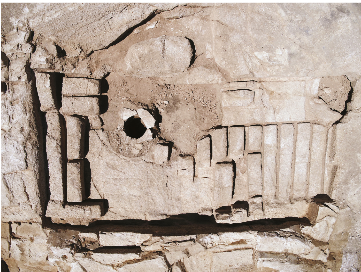
Fig. 7 : Vue zénithale de la partie centrale de la carrière hellénistique

L'organisation de la carrière des IV e -III e siècles avant notre ère et les dimensions normalisées des blocs incitent à considérer cette reprise d'exploitation comme une commande en vue de bâtir les fondations d'un monument vraisemblablement public. La chronologie de l'exploitation est compatible avec le remaniement de l'enceinte urbaine observé sur le site de la Bourse 15 et qui met en œuvre, en fondations, des blocs de calcaire de Saint-Victor. Nous ignorons si l'ensemble du tracé de la fortification a été l'objet de travaux, mais la carrière de la Corderie aurait pu à cette occasion, fournir les matériaux nécessaires à la construction d'une partie des nouvelles fondations.