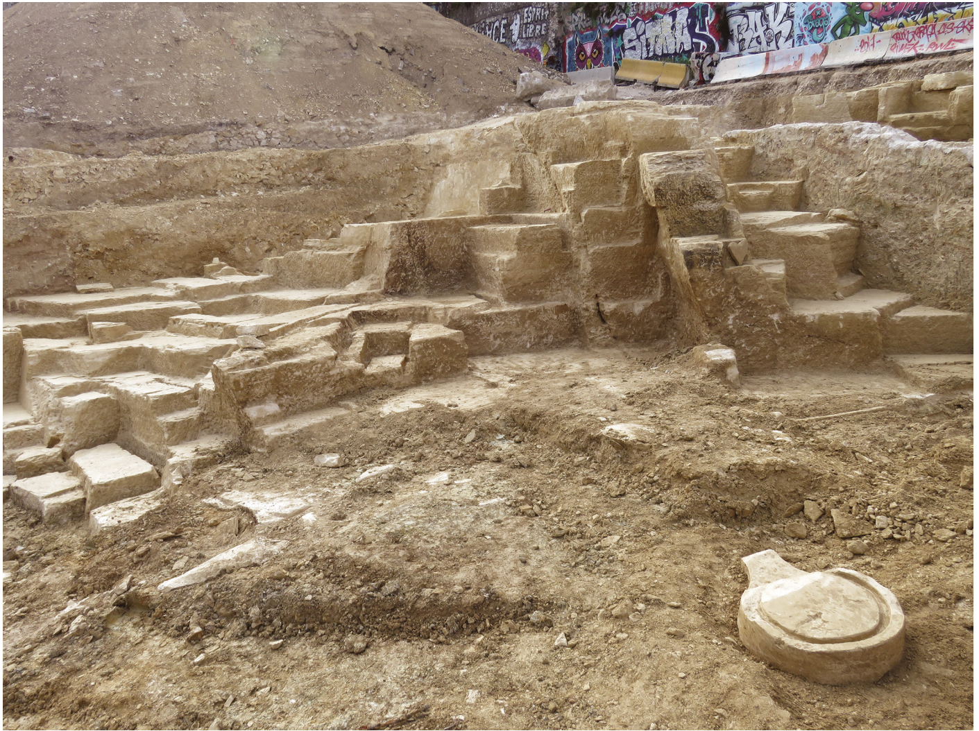
Fig. 5 : Une base de pressoir abandonnée dans les comblements de la carrière du V e siècle avant notre ère

L'utilisation du pic est plus anecdotique et il a été principalement observé pour la rectification des sols de carrière.