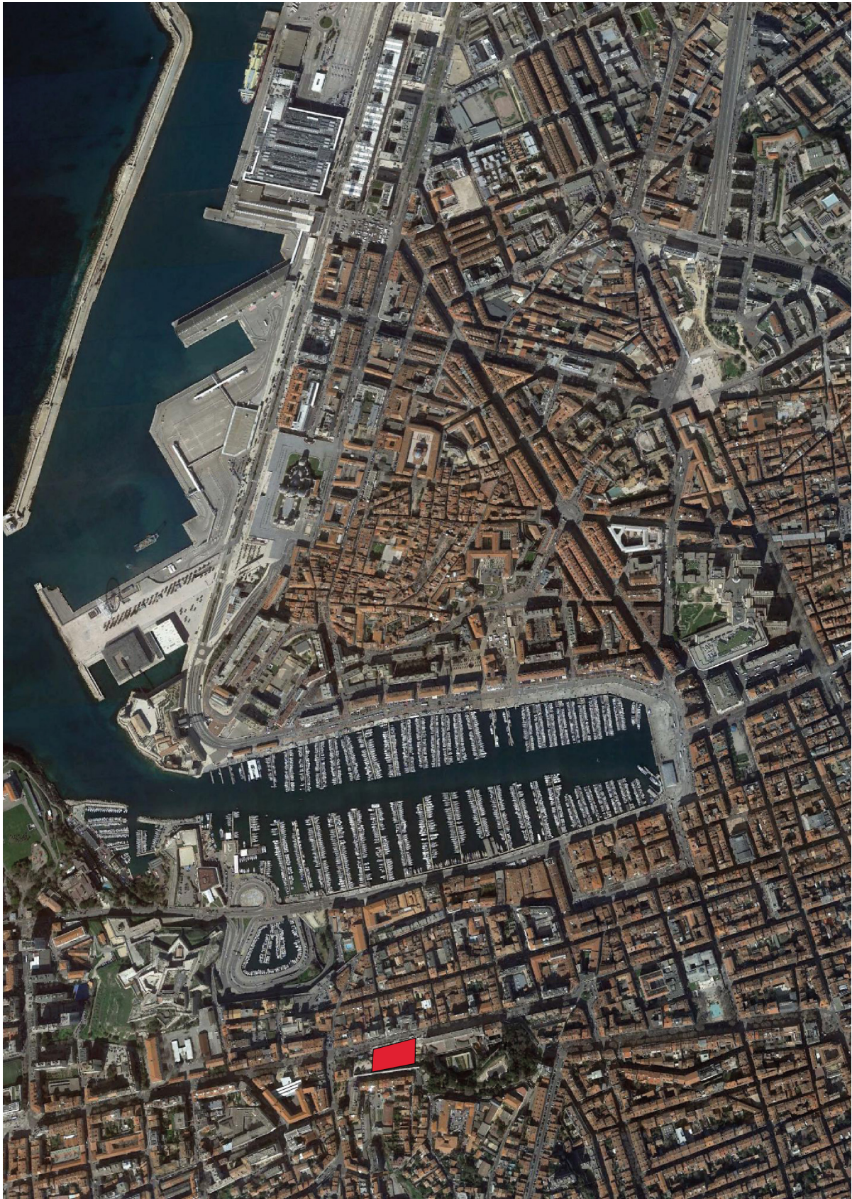
Fig. 1 : Localisation du site du boulevard de la Corderie en rouge (DAO Chr. Voyez, Inrap sur vue IGN)