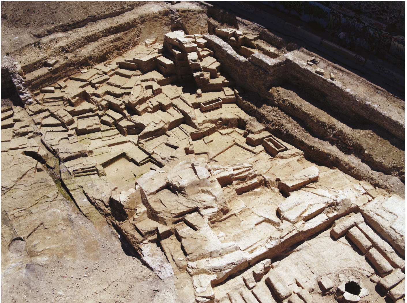
Fig. 3 : Vue générale de la carrière depuis le nord-ouest