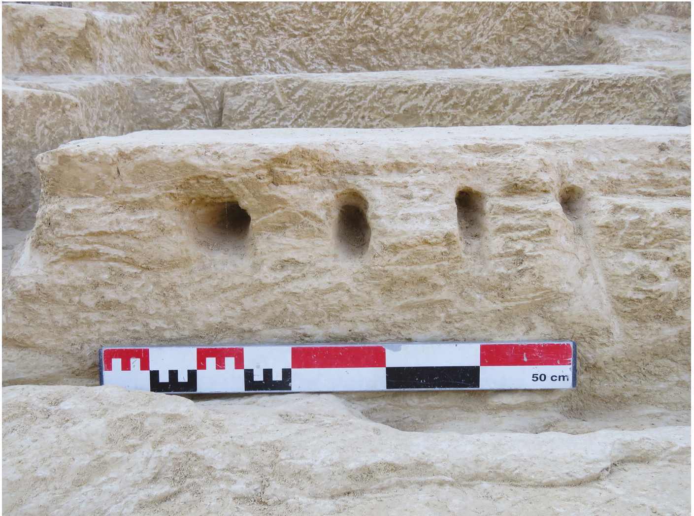
Fig. 6 : Détail d'emboîtures du V e siècle sur un bloc mal venu

leur longueur et leur largeur 14 , permettent de déterminer un module moyen de 161 x 60 x 61 cm.