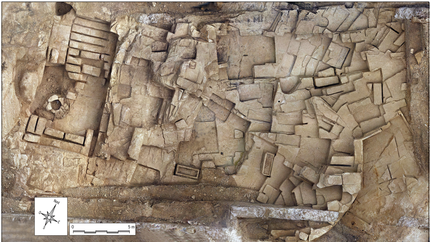
Fig. 8 : Ortho-photographie de la partie sud de la carrière de la Corderie (cliché B. Sillano, Inrap ; DAO Chr. Voyez, Inrap)