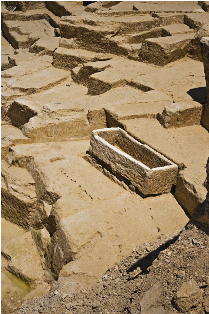
Fig. 4 : Une cuve de sarcophage encore en place dans la carrière grecque archaïque

des sites funéraires marseillais 12 et les analyses de matériaux en cours devraient permettre de confirmer leur provenance, vraisemblablement la carrière du boulevard de la Corderie.