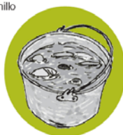
Doc.2 : traditional rama food, UNESCO 2012

Cada mujer tiene su propio lugar de ostiones