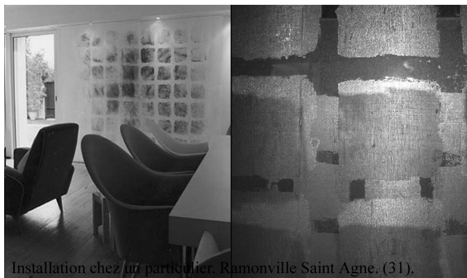
Installation chez un particulier. Ramonville Saint Agne. (31).