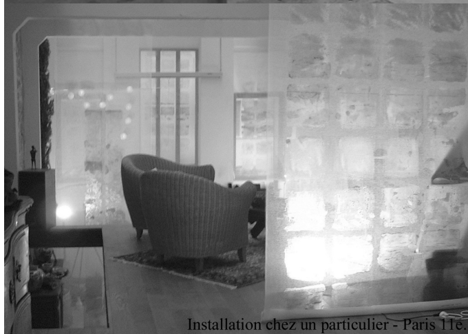
Installation chez un particulier - Paris 11e.