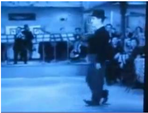
Figure 11 : Charlot semble danser le moonwalk de Jackson