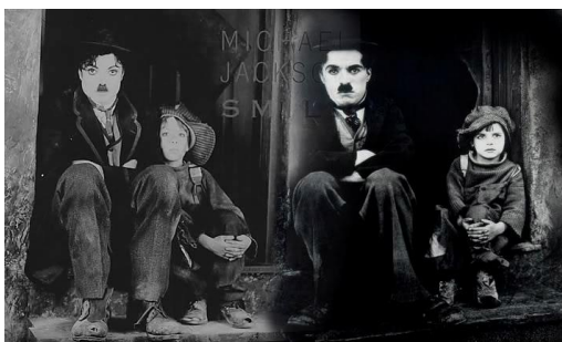
Figure 9 : la couverture du single « Smile » qui s'approprie l'image du Kid (1921)