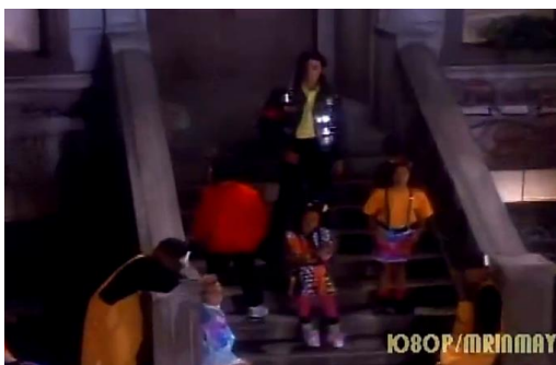
Figure 10 : Motif du Kid dans le clip de la chanson « Black or White » (1991)