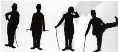
Figure 5 : silhouettes de Charlot

Selon Yves Gautier, Jackson et Chaplin « se définissent tout d'abord par leurs silhouettes (parfois en ombres chinoises) et par leurs démarches : en canard et ponctuée par sa canne pour Chaplin, sautillante et rythmée par la musique pour Michael 23 » (voir fig. 5 et 6). Les deux artistes peuvent aussi être évoqués de manière métonymique à travers leurs accessoires : chapeau melon, canne et pantalon trop grand pour Chaplin, chapeau fedora, pantalon trop petit, gant blanc et lunettes noires pour Jackson. La présence spectrale de Chaplin ou de Jackson peut ainsi prendre forme à la simple vision d'un chapeau ou d'un pas de danse (voir fig. 7).