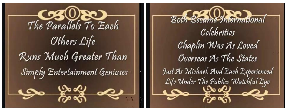
Figure 8 : les cartons créés par les fans de Jackson dans des vidéos sur YouTube

idealist, he believed in freedom, refusing any form of dictatorship, exploitation, abuse or oppression. He believed human beings had to be considered equally, no matter the race ». 26 On notera l'inversion chronologique où c'est à présent Chaplin qui a l'honneur d'être comparé à Jackson. Les fans de Jackson ont tenu des discours similaires dans des vidéos mises en ligne sur YouTube après la mort du chanteur 27 . Sur la musique de « Smile », des cartons imitent les films muets (voir fig. 8) pour créer des parallèles biographiques entre les deux hommes – une jeunesse qui se termine à sept ans, une vie passée sous les projecteurs, une attention maniaque donnée à chaque détail de leurs œuvres, une même quête de la perfection pour développer et promouvoir leur art, les épreuves face aux accusations judiciaires et médiatiques. Les vidéos soulignent aussi le message d'amour et d'humanité que les deux artistes véhiculaient : les fans rapprochent notamment le discours humaniste de Chaplin à la fin de The Great Dictator en 1940 et les moments où Jackson, en concert, exhortait ses spectateurs à aimer leur prochain, à vivre ensemble sans discrimination ou peur, avant de leur demander de prendre la main de leur voisin.