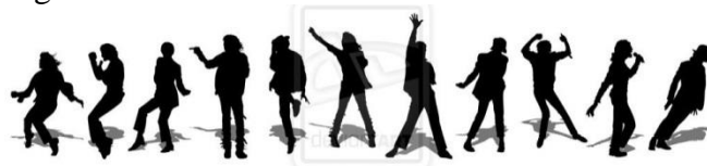
Figure 6 : silhouettes de Jackson