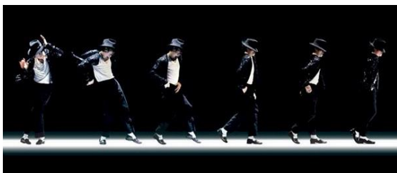
Fig. 4 : le mouvement du moonwalk décomposé image par image

La gestuelle de Charlot, à la fois gracieuse et maladroite, d'apparence si fluide et pourtant si difficile à reproduire, peut se retrouver dans les pas de danse de Jackson, 18 qui avait reconnu l'influence du mime dans ses chorégraphies. Il avait d'ailleurs rencontré le mime Marcel Marceau au Beacon Theater de New York en 1995 où ils avaient tous deux fait comme si leurs mains courraient à la surface d'une vitre ou comme s'ils marchaient contre le vent 19 . Le fameux pas popularisé par Jackson sous le terme « moonwalk 20 » donne cette même impression que le danseur avance alors qu'il recule, comme s'il s'opposait à une forte bourrasque. Cette séquence de danse, si souvent répétée dans les chorégraphies de « Billie Jean » ou « Stranger in Moscow », semble aller à l'encontre des lois de la physique mais surtout, à l'image de Chaplin, paraît défier toute forme de contrainte répressive. Sur internet, les pas de Jackson ont d'ailleurs fait l'objet d'une décomposition du mouvement pour en déceler les mystères, décomposition qui rappelle les premiers temps du cinématographe (voir fig. 4) 21 .