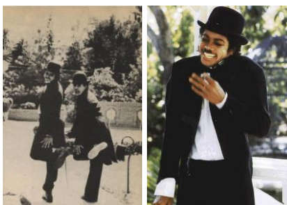
Figure 3 : Jackson et Kamoun déguisés en Charlot (1983)

En 1979 à Londres et en 1983 avec Kamoun, c'est au spectacle d'un Charlot noir que Jackson nous convie : son visage est tout juste marqué de quelques taches blanches dues au vitiligo qui affecte la peau et la décolore, une maladie dont il a avoué souffrir et qu'il a longtemps cachée en utilisant du maquillage noir, puis blanc, pour harmoniser la couleur de sa peau 17 .