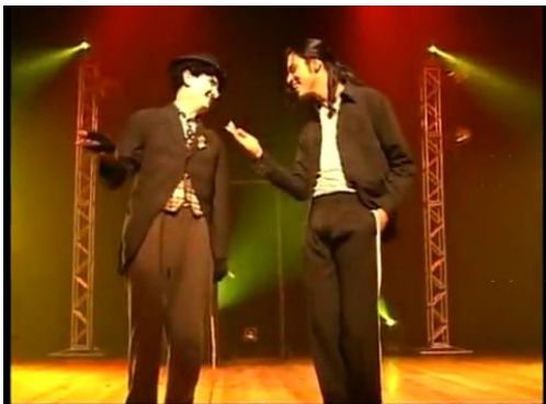
Figure 12 : les sosies de Charlot et de Jackson se rencontrent à São Paulo (2008)