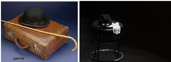
Figure 7 : présence spectrale à travers l'accessoire