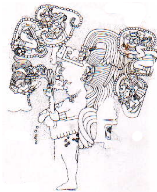
Figure 3 : Stèle 2, Ixlu (Guatemala 850 a JC) : apparition de deux “vencêtres” à l’intérieur de gouttes de sang

Figure 4 : Linteau 15, Yaxchilan (Chiapas, Mexico, 770 A J.C) Apparition d’un vencêtre dans la gueule d’un serpent