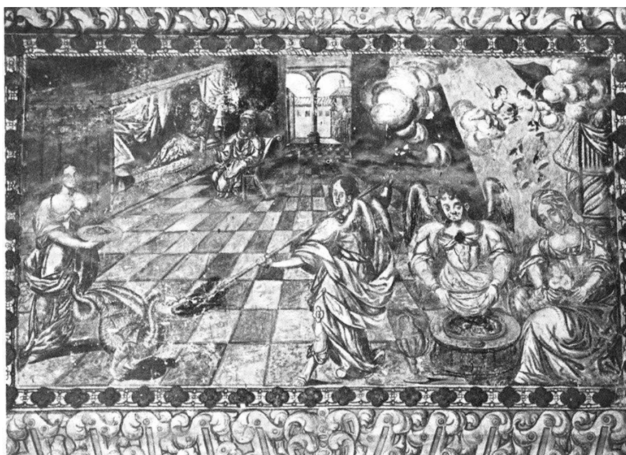
Figure 2 : Naissance de la Vierge, petite chapelle derrière l'autel de l'église de Tabi

Au Yucatan, elle est un lien social avec les vencêtres, qu'ils soient catholiques ou appartenant à l'ensemble plus vaste des pères et mères mythiques, yuntsilob et kolebilob . Les apparitions se conjuguent avec des rituels ou pratiques mythiques qui les mettent en scène et une riche iconographie que l'on retrouve dans les églises.