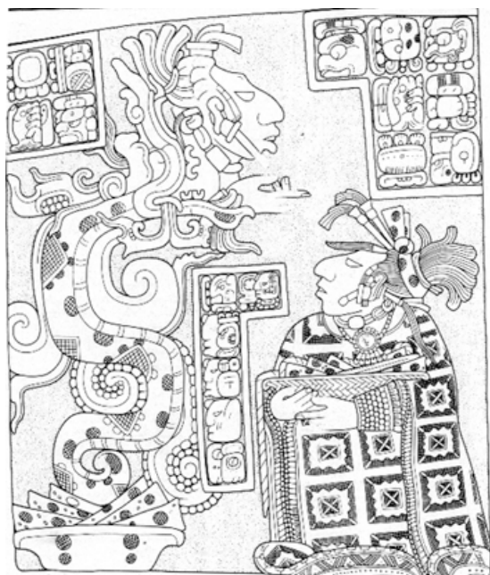
Figure 5 : Linteau 25, Yaxchilan (Chiapas, Mexico, 725 A J.C) Apparition d’un vencêtre, que certains identifient à Vénus, dans la gueule d’un serpent. Texte écrit en “miroir” (vision inversée)

Figure 4 : Linteau 15, Yaxchilan (Chiapas, Mexico, 770 A J.C) Apparition d’un vencêtre dans la gueule d’un serpent