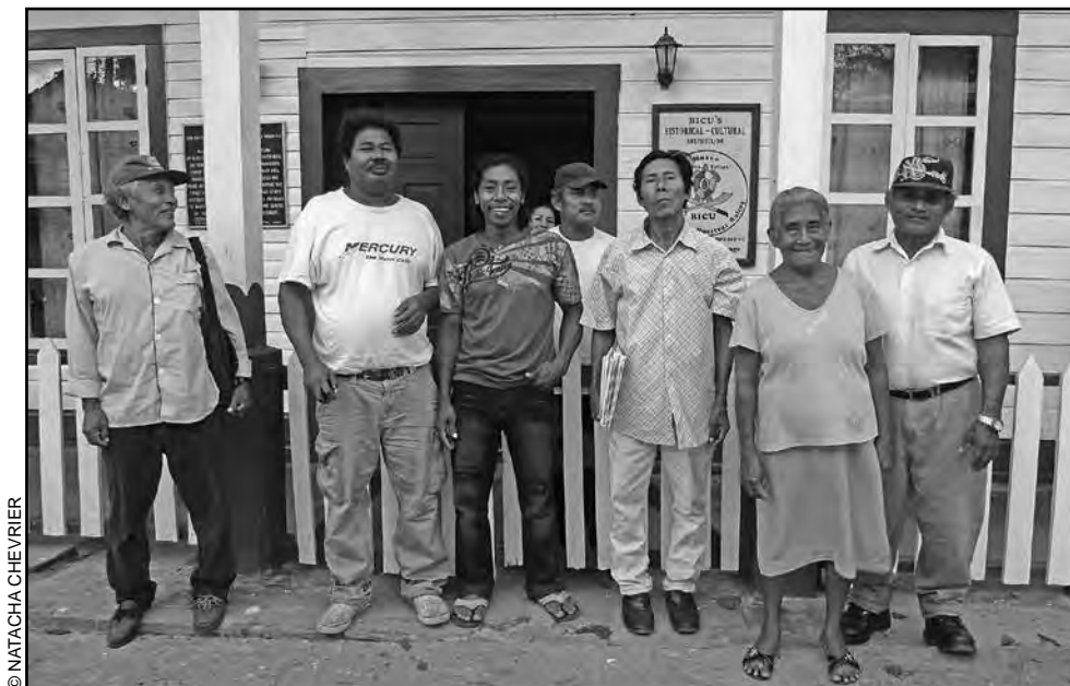
Consejo de Hablantes del Rama delante de las oficinas del BICU-CIDCA, Bluefields, Marzo 2011.

transmisores del rama en las diferentes escuelas de las comunidades (Apr.J. y Apr.S, al igual que dos o tres colegas más).