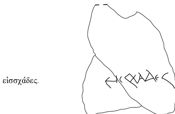
Fig. 2. Fac-similé du graffiti sur amphore du sanctuaire de Tatul.

La paléographie confirme la datation à l'époque hellénistique : alpha et delta sont tracés de manière élégante ; epsilon et sigma sont lunaires ; le deuxième et le troisième sigma sont tracés en deux temps, de manière rapide, comme sur un papyrus ; la barre médiane de l' epsilon touche l' iota . En réalité, les deux photos publiées (cf. le fac-similé, fig. 2 ) permettent de lire sans aucune hésitation possible ΕΙCΧΑΔΕC, donc :