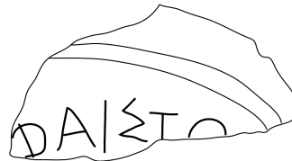
Fig. 5. Fac-similé du troisième graffiti de Tyras.