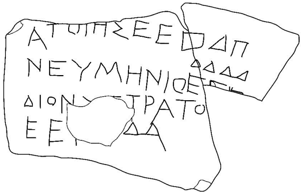
Fig. 7. Fac-similé du graffiti de Phanagoria.

« (D')Atotès 265, de Neumènios 290, de Dionystratos 280 (?) ».