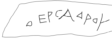
Fig. 4. Fac-similé du deuxième graffiti de Tyras.

On constate l'oubli banal du ny avant deux consonnes 22 , raison pour laquelle il convient de ne pas écrire Θερσά<ν>δρου, car il s'agit d'un phénomène phonétique. Ce nom composé Θέρσανδρος est assez fréquent dans le monde grec, même s'il n'était pas encore attesté dans le Pont Nord 23 .