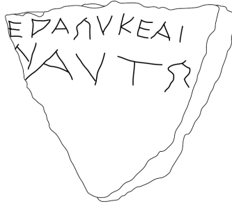
Fig. 1. Fac-similé du graffite sur tuile de Thasos.

À la lumière de parallèles littéraires (Euripide, Ménandre, etc.), le premier mot, fragmentaire, est un nom (ou un nom propre) féminin, suivi de la négation οὐκ ἐάι, avant un autre verbe à l'infinitif, à la l. 2, [---]ν ; à la même ligne, on trouve le génitif d'un pronom personnel, sans pourtant exclure le génitif d'un anthroponyme comme Ναύτης. Qu'il s'agisse d'un exercice d'écriture ou d'un texte à valeur plus forte, on peut établir un parallèle avec une réponse oraculaire sur un disque de bronze de Cumès, vers le milieu du VII e s. 4 : Ἡῆρῃ οὐκ ἐάι ἐπιμαντεύεσθαι , « Héra ne permet pas que l'on consulte l'oracle ».