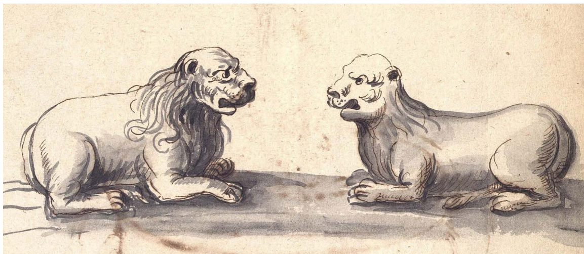
Figure 1. Les lions du portail de l'église Saint-Michel, Limoges

Bibliothèque francophone multimédia de Limoges, Ms 21, 1638