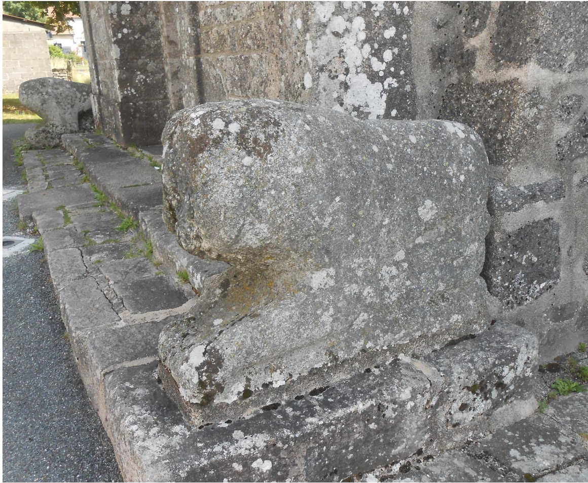
Figure 5. Lion du portail occidental de l'église Saint-Martial de Toulx-Sainte-Croix (Creuse)