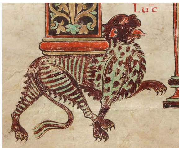
Figure 2. Représentation d'un lion stylophore dans la première Bible de Saint-Martial de Limoges, X e siècle

Des travaux récents d'historiens d'art comme Marcello Angeben 18 , Caroline Roux 19 ou Alessia Trivellone 20 ont permis de prouver cet usage de lions protecteurs au seuil de l' ecclesia . Ces mêmes interprétations se vérifient également dans le comté de la Marche. La caractéristique principale de cette iconographie du gardien est liée à leur position même. Tous ces lions font face à l'extérieur de l'église et ils apparaissent donc comme défendant son portail. À Saint-Georges-la-Pouge (Creuse) et à La Chapelle-Saint-Martial (Creuse), ce sont ainsi d'imposants félins qui sont situés le long des églises, et ils sont tous deux enregistrés comme médiévaux par les Monuments historiques . Pourtant la formule est analogue à celle utilisée dans l'Antiquité et bien des lions d'églises sont des récupérations d'éléments romains par les sanctuaires romains 21 . Il semble que cela soit également le cas à Magnat-l'Étrange (Creuse) où le lion flanque encore une fois le portail principal de l'église Saint-Pardoux. Si le flou persiste pour les deux premiers exemples, d'autres plaident néanmoins pour une réalisation strictement médiévale.