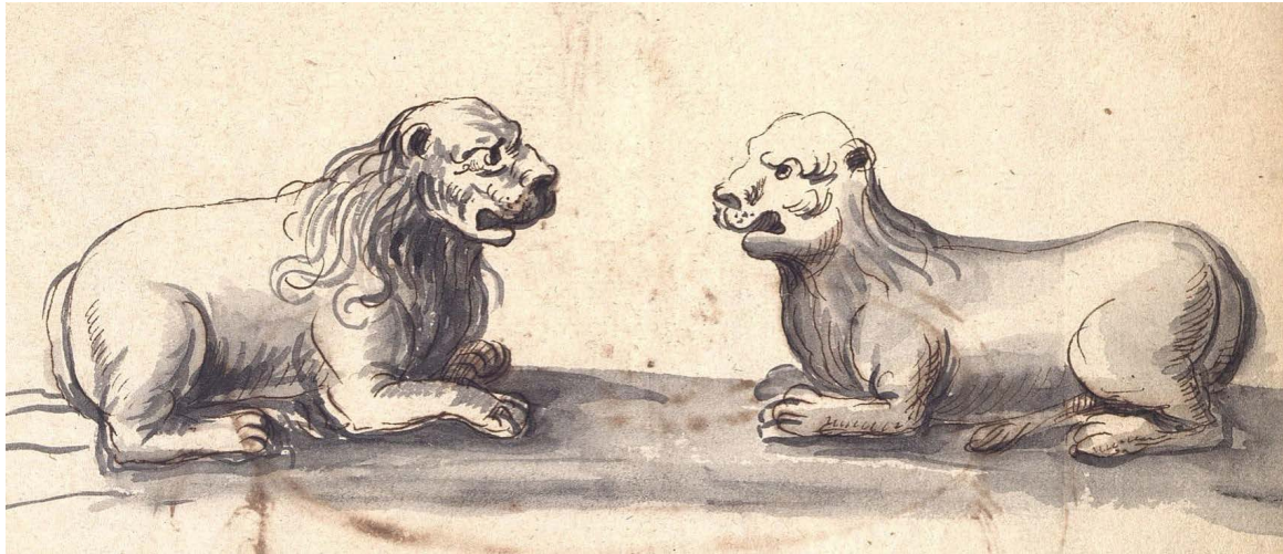
Figure 1. Les lions du portail de l'église Saint-Michel, Limoges

Bibliothèque francophone multimédia de Limoges, Ms 21, 1638