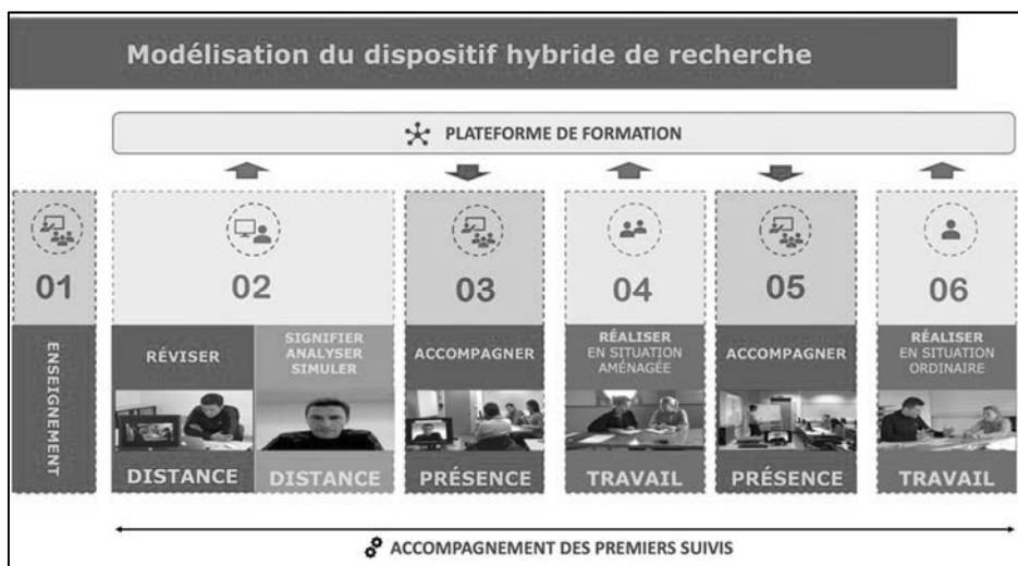
FIG 2 : Présentation des étapes de formation du dispositif hybride

Le dispositif a été pensé de manière à alterner six étapes successives de formation menées en alternance à distance sur une plateforme, en présentiel avec un EEC, où en contexte aménagé en situation de stage (Figure 2). Ces étapes de formation ont contribué à accompagner la construction de compétences nécessaires au conseil pédagogique d'enseignants tuteurs de stage (considérés comme les étudiants dans le dispositif) auprès d'enseignants novices. Au-delà des circonstances singulières de l'étude, le dispositif présenté montre qu'il est possible d'envisager de nouvelles modalités de formation pensées comme hybride dans le supérieur visant à accompagner le développement de compétences des étudiants.