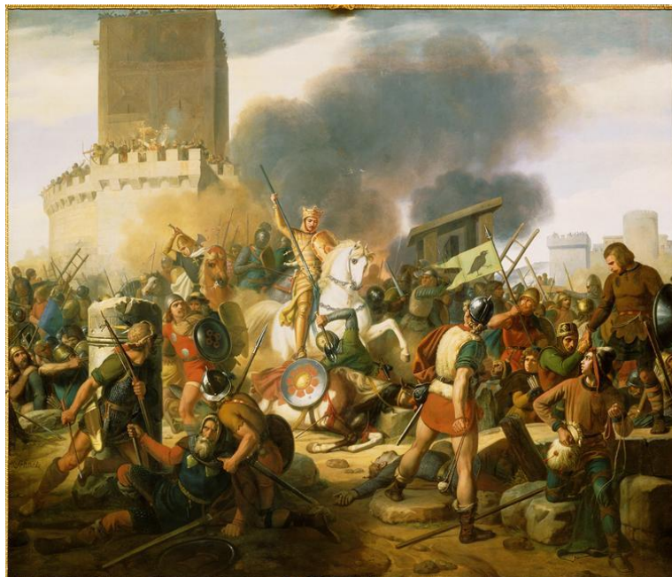
Le comte Eudes défend Paris contre les Normands en 886