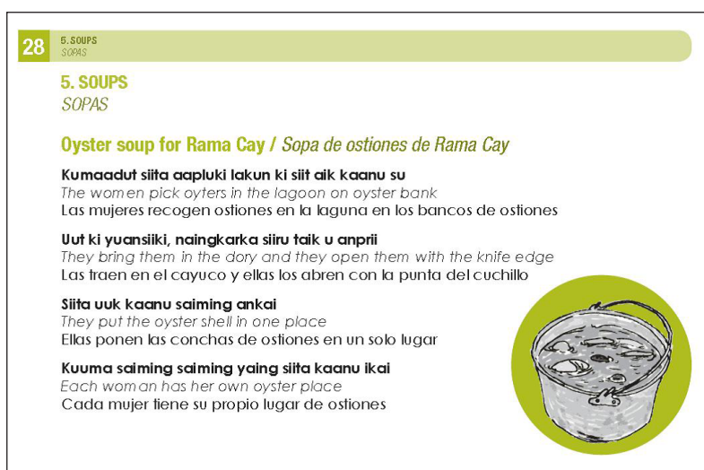
Figure 1 : Exemple d'une page du livre Traditional Rama Food , UNESCO/Fondo OMD, 2012

C'est au sein de ces programmes que la langue rama trouve une place dans des livres et autres brochures édités grâce aux fonds de l'OMD. Ces documents sont conçus par des Créoles de la Côte (pour la collecte d'informations), par des Nicas du Pacifique (pour le respect de la ligne éditoriale) et validés par la chargée du projet de l'UNESCO, par exemple dans cette production sur la gastronomie traditionnelle :