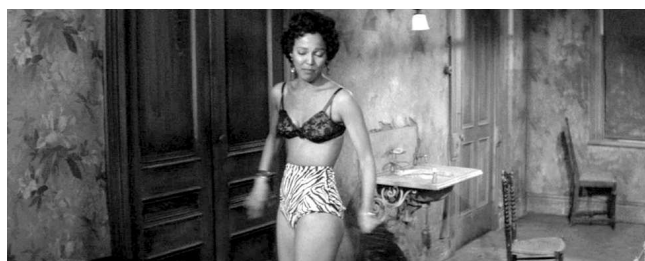
Carmen Jones (O. Preminger, 1954)

mito. Analizando el ritual de la actualización, ciertos detalles son cruciales: por ejemplo, en muchas adaptaciones hay aspectos de la cultura gitana como la lectura de las cartas o el flamenco (que se representa bailando dos pasos y diciendo un “olé” con cara severa). Son signos reductores que traducen de una manera simplificada aspectos de este pueblo.