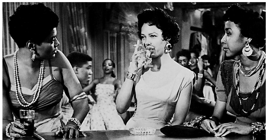
Carmen Jones (O. Preminger, 1954)

La estructura narrativa de Carmen Jones es retomada en Carmen: a Hip Hopera , pero la manera de filmar es totalmente opuesta, pues esta tiene un ritmo tenso, con muchos planos cercanos de la cara o del cuerpo, que contrasta con el estilo de aque-