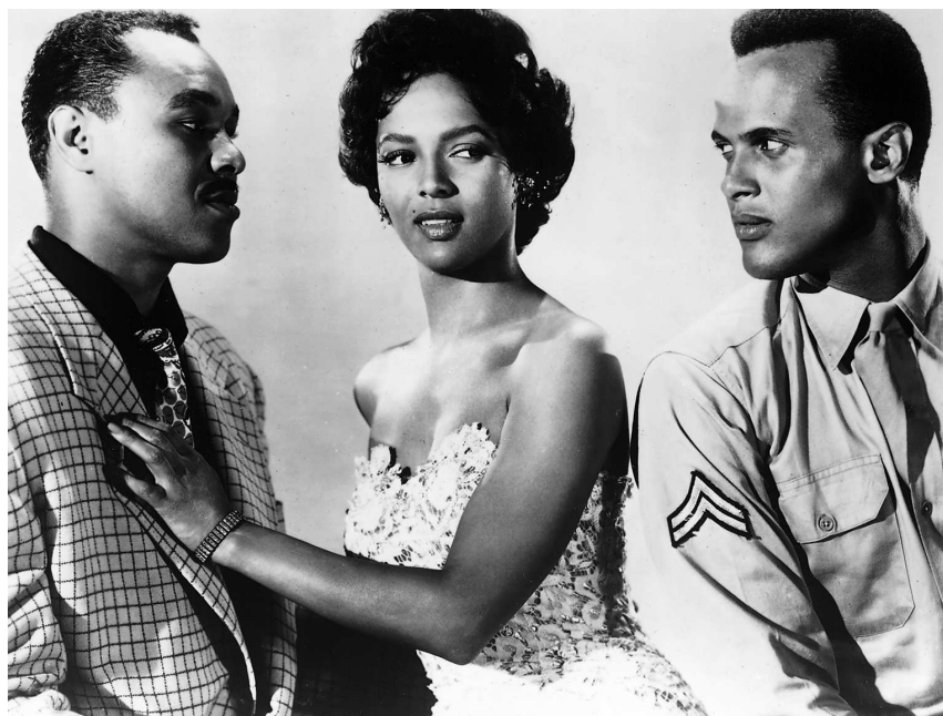
Carmen Jones (O. Preminger, 1954)

Originalmente, Carmen nació de la mirada de un extranjero sobre la mujer española: Prosper Mérimée en la novela homónima de 1845 y Georges Bizet en su ópera de 1875. Estas obras introdujeron una imagen estereotipada de la mujer española por su aspecto exótico y erótico, lo que explica que muchas adaptaciones posteriores desborden de estereotipos. Esta imagen proporciona el punto de partida para luego poder desplazar el mito: el cuerpo estereotipado trae una primera categorización que permite reconocer a esta mujer "española". La repetición de una idea preconcebida y ciertos elementos constantes (la presencia de la eterna rosa, la falda roja y los labios carnosos) termina por fijar el famoso cliché, y, como la imagen del toreo-