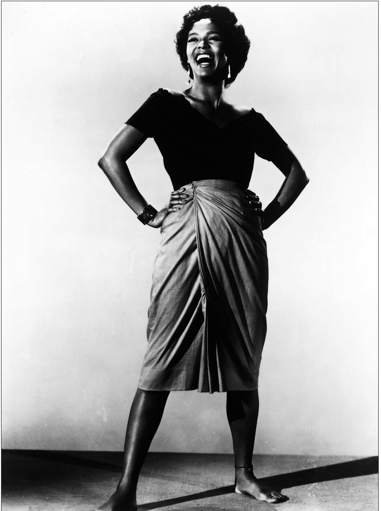
Carmen Jones (O. Preminger, 1954)