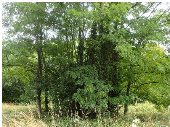
Figure 3. Îlot de Robinier faux-acacia ( Robinia pseudoacacia ) dans la partie prairiale du parc de la Fosse-Maussoin.

Les trois espèces avérées implantées que compte le parc ( Parthenocissus inserta , Reynoutria japonica et Robinia pseudoacacia ) ne sont que peu présentes (Figure 2), et ne sont donc actuellement pas préoccupantes. En revanche, les travaux de réaménagement occasionnent des perturbations qui pourraient se révéler favorables à leur développement dans un futur proche. La mise en place d'une vigilance à l'issue des travaux, accompagnée de mesures ciblées sur les nouveaux foyers, en particulier pour la Renouée du Japon qui pourrait profiter de déplacements de substrat, serait pertinente.