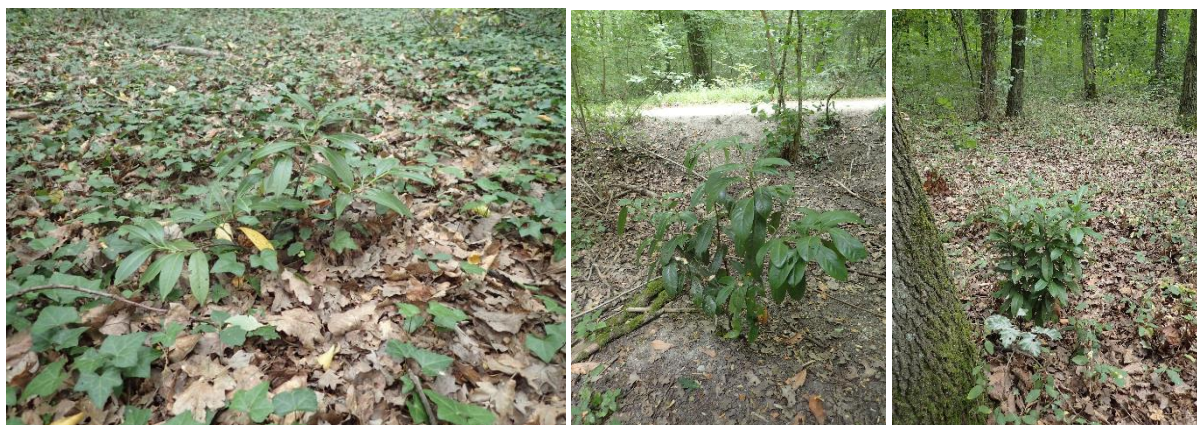
Figure 4. Jeunes individus de Laurier palme ( Prunus laurocerasus ) sur trois stations au parc de la Fosse-Maussoin.

Une veille afin de permettre la détection d'un changement de comportement doit être effectuée pour les espèces potentielles implantées. En raison de son caractère boisé, le parc est peu propice à une invasion par l'Arbre aux papillons ( Buddleja davidii ), ainsi que les conyzes ( Erigeron spp) et le Sénéçon du Cap ( Senecio inaequidens ) qui restent cantonnés en périphérie des boisements (Figure 1). Ces espèces ne sont donc pas problématiques. Par contre, le Laurier palme ( Prunus laurocerasus ) est beaucoup plus présent et se trouve en début de phase de colonisation. Cette espèce, largement plantée dans les haies pour ses capacités occultantes, montre un caractère envahissant en milieu forestier, dans lequel elle peut réduire la richesse spécifique végétale et modifier les caractéristiques du sol (Rusterholz et al, 2018). Une veille accrue et la mise en place d'interventions sont préconisées pour cette espèce, représentée essentiellement par des jeunes individus dans le parc (Figure 4), et qui rend donc encore possible sa maîtrise.