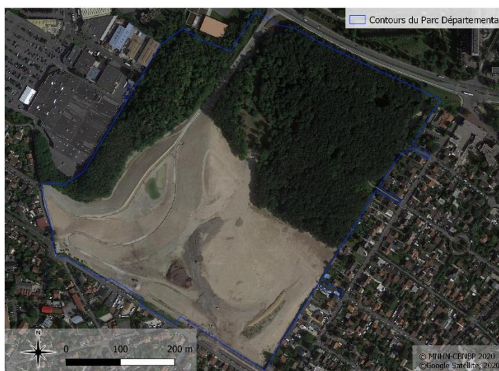
Figure 1. Vue satellite du parc départemental de la Fosse-Maussoin : une partie du parc est actuellement en travaux (© O. Le Rallic-Maho / CBNBP-MNHN, 2020).

Une cartographie de la répartition dans le parc départemental a été réalisée pour chacune des espèces présentes, et met en avant les stations observées en 2020, ainsi que les stations historiques d'espèces n'ayant pas été réactualisées en 2020. Une partie du parc est en cours de réaménagement et n'a pas été prospectée en 2020, cet espace étant peu ou pas végétalisé (Figure 1).