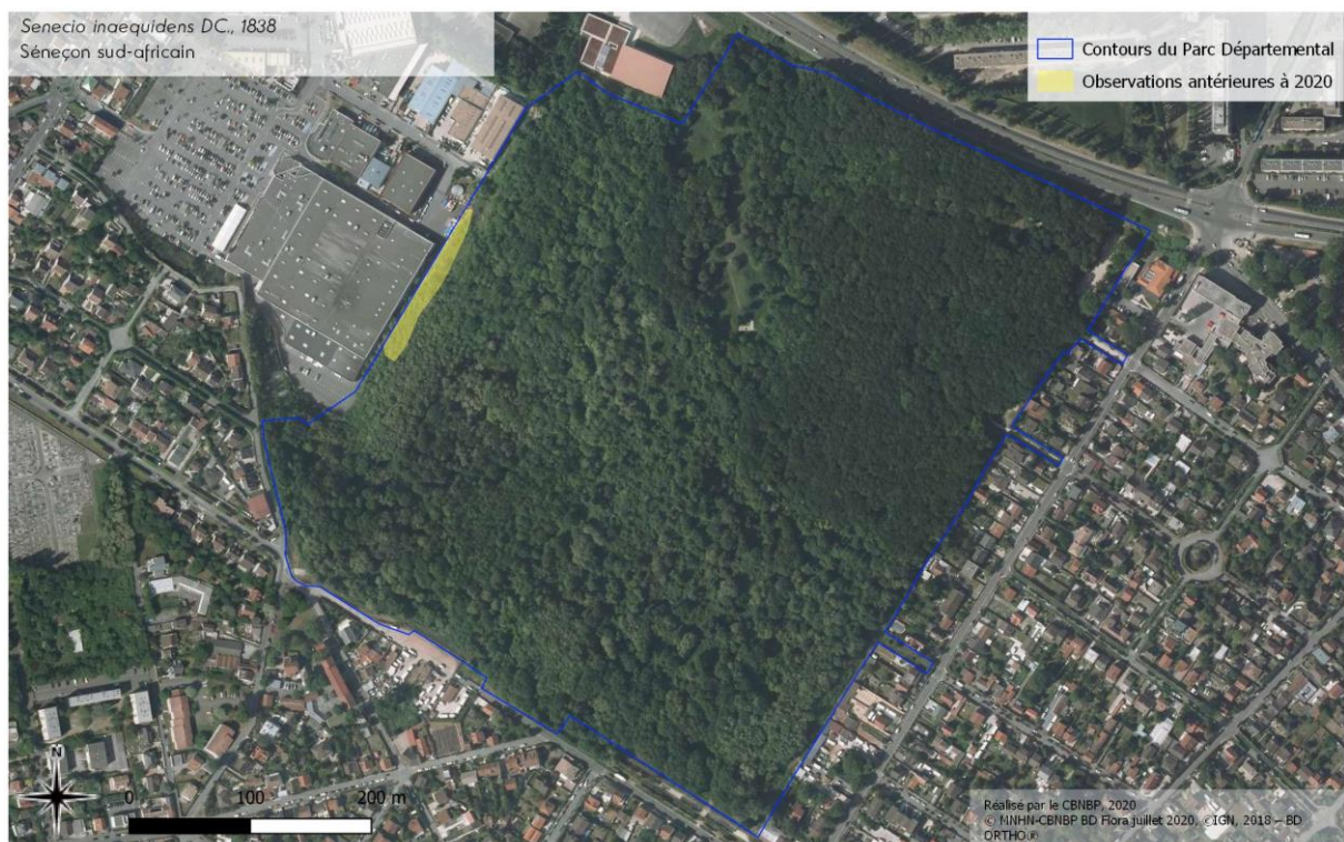
Figure 2. Cartographies des espèces exotiques envahissantes selon leur densité dans le parc départemental de la Fosse-Maussoin. Le nom scientifique de l'espèce concernée est précisé en haut à gauche. Les observations antérieures correspondent aux stations ayant été historiquement localisées mais qui n'ont pas été réactualisées en 2020.

L'Arbre aux papillons ( Buddleja davidii ), La Vigne vierge ( Parthenocissus inserta ), le Conyze du Canada ( Erigeron canadensis ), la Renouée du Japon ( Reynoutria japonica ) et le Sénéçon du Cap ( Senecio inaequidens ) n'ont pas été observées en 2020.