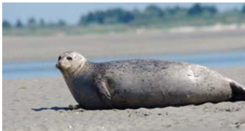
FIGURE 1. Les phoques communs mâles de l'estuaire de la Seine défendent leur territoire contre les autres mâles et attirent les femelles en utilisant des vocalises sous-marines ( écouter les sons des phoques communs )

L'impact du bruit sous-marin sur la vie marine suscite de plus en plus d'inquiétudes, en raison de l'augmentation constante du nombre et de la diversité des activités humaines en mer. En particulier, les niveaux de bruit chroniques provenant de la navigation commerciale ont augmenté de manière significative au cours des 60 dernières années et ils devraient continuer à augmenter dans les années à venir. En réponse à cette préoccupation, les Nations Unies ont signé un engagement volontaire pour réduire le bruit sous-marin (#OceanAction18553), qui reconnaît l'impact négatif que le bruit de la navigation peut avoir sur la vie marine. Dans ce policy brief, nous examinons le rôle des ports dans la réduction de ce type de bruit et illustrons nos résultats à l'aide du cas d'étude du port du Havre.