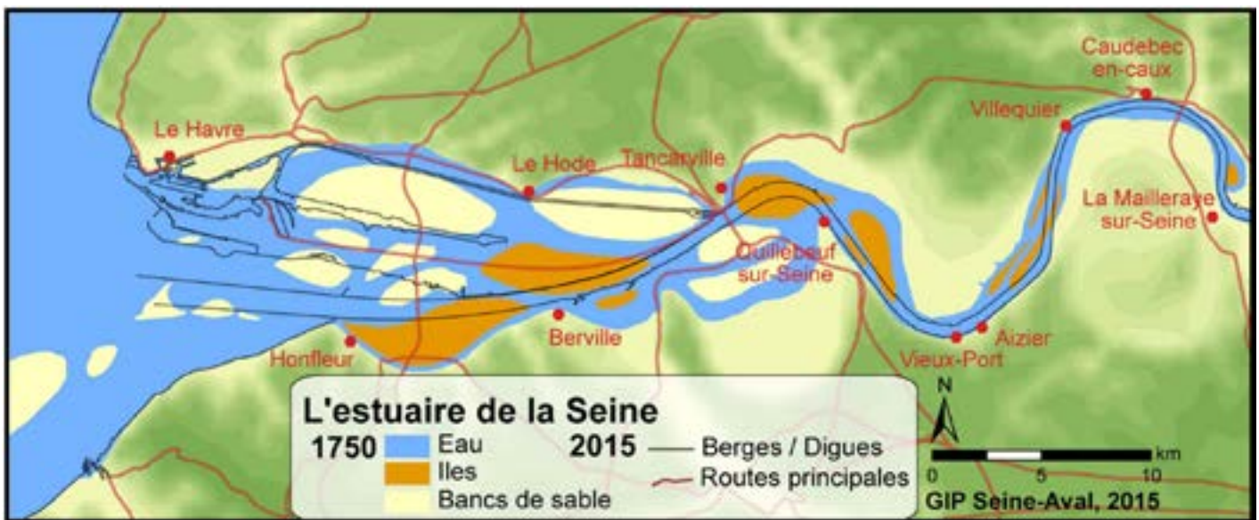
FIGURE 5. Évolution de l'estuaire de la Seine entre 1750 et 2015. Depuis le début du XIX ème siècle, un développement industriel et urbain intense a entraîné un degré élevé d'intervention humaine sur l'estuaire. La construction d'infrastructures telles que des ports, des digues ou des berges a entraîné une modification hydro-morphologique profonde du profil du fleuve

Ces changements ont eu des conséquences importantes sur la structure morphologique de l'estuaire et la qualité de ses habitats. Par exemple, depuis 1875, la superficie des vasières intertidales situées à l'embouchure de l'estuaire, près du Havre, a été divisée par cinq (Delsinne, 2005), ce qui a eu des conséquences importantes sur la fonction de nurserie de ce secteur pour les populations marines de la Manche (Rochette et al., 2010).