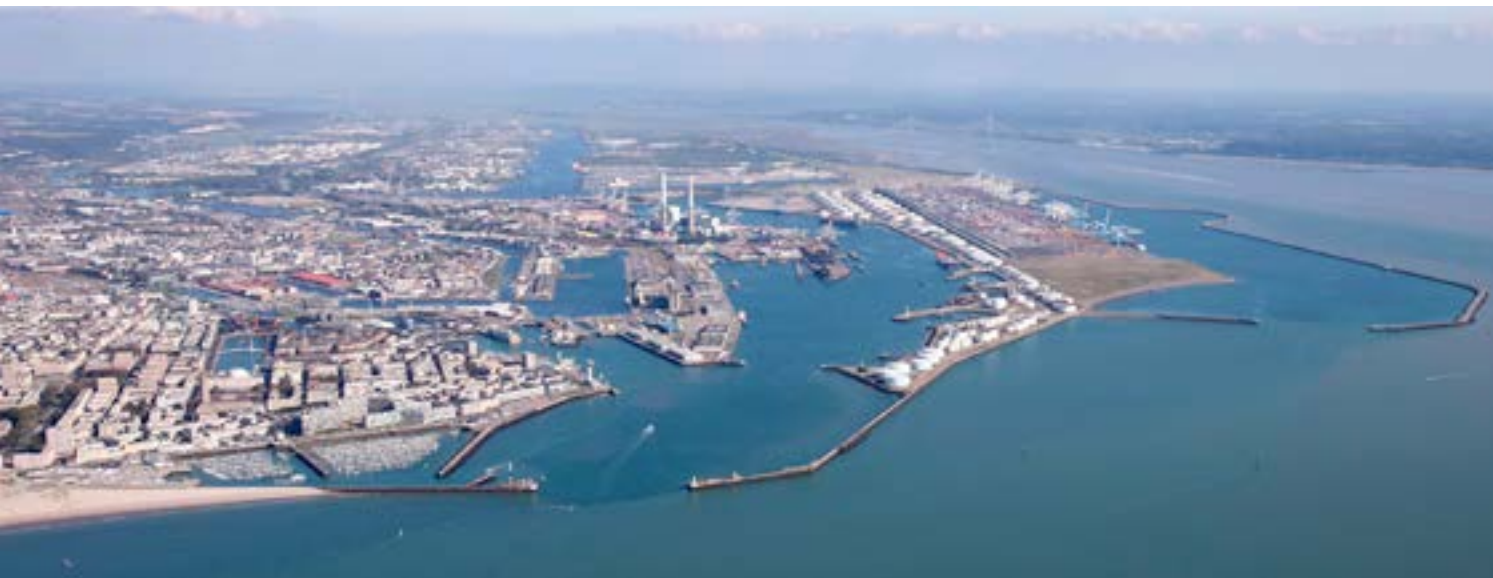
FIGURE 6. L'estuaire de la Seine et ses activités industrielles, portuaires et urbaines (rive droite de l'embouchure de l'estuaire, vue sur Port 2000 et la ville du Havre derrière)

comme l'un des fleuves les plus pollués au monde. En particulier, les digues artificielles construites en bordure du chenal du fleuve ont considérablement réduit la connectivité latérale entre le chenal principal et le lit de crue, dont dépendent plusieurs espèces pour les différentes phases de leur cycle de vie (reproduction, nurserie, abri). De plus, la réduction de la capacité dépurative de l'estuaire est supposée être le résultat de l'endiguement du fleuve, responsable de la diminution du temps de résidence des eaux dans l'estuaire.