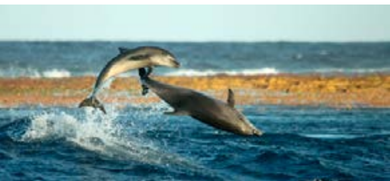
FIGURE 2. Le grand dauphin, que l'on trouve en Manche, voit son sifflement modifié lorsque les navires sont audibles et la cohésion des groupes avec les baleineaux est réduite ( écoutez les sons du grand dauphin )

Le son est appelé "bruit" lorsqu'il peut avoir des effets négatifs sur la vie marine. Le son dans l'océan joue un rôle clé pour la vie marine. Les organismes marins dépendent des sons pour naviguer, trouver de la nourriture, éviter les prédateurs, se reproduire, trouver des partenaires, communiquer et créer une cohésion de groupe (Buscaino et al., 2016 ; Figure 1). De nombreuses espèces marines produisent des sons et perçoivent ceux qui les entourent. En particulier, les animaux marins utilisent le son pour recueillir des informations sur leur environnement. Les sons couvrent de vastes distances dans l'océan, car les pertes de transmission sont faibles par rapport à celles de l'air. Par exemple, les sons de basse fréquence (15-30 Hz) des baleines bleues et des rorquals communs ont été enregistrés sur des distances de 400 à 1600 kilomètres, ce qui montre leur capacité à communiquer à travers la mer (Sirovic et al., 2007) ( écouter les sons des baleines bleues ).