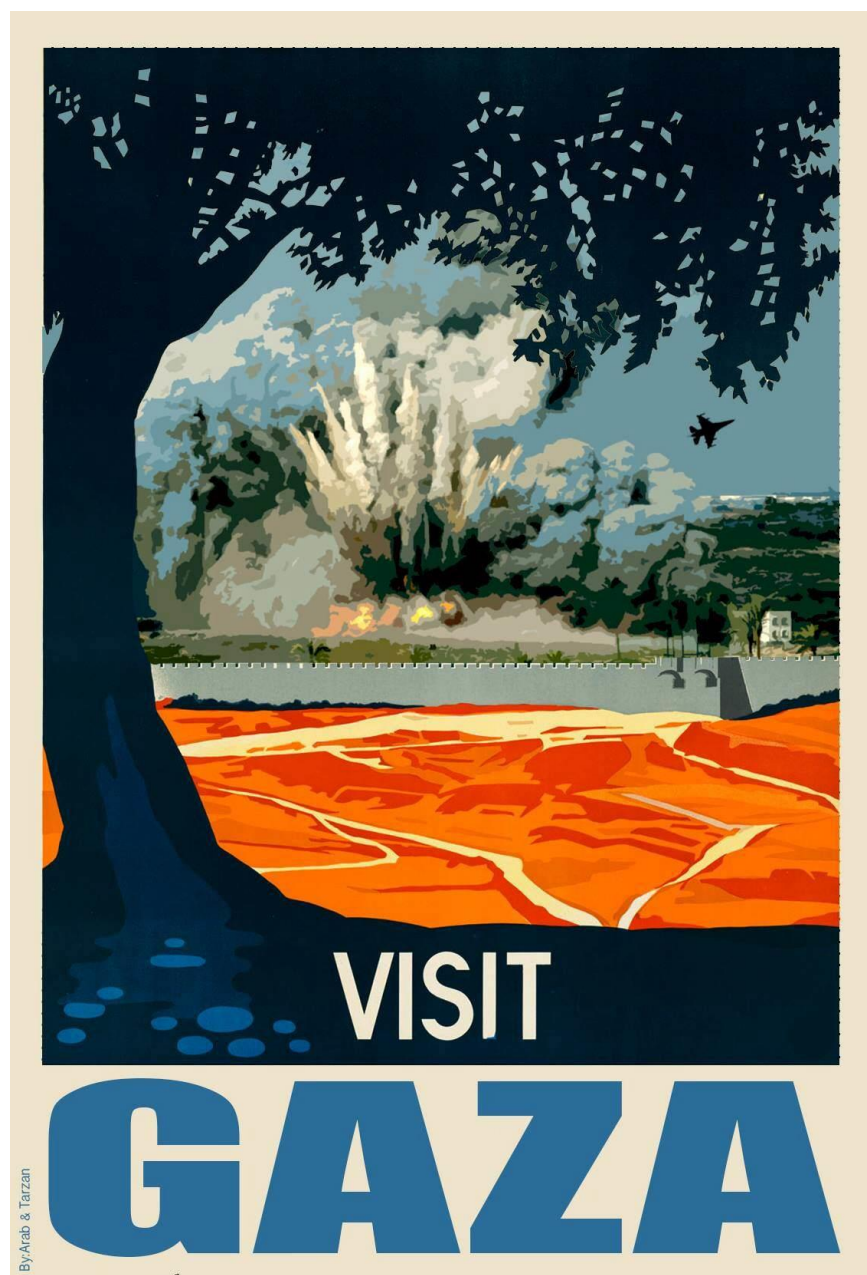
Fig. 1 Arab et Tarzan Nasser, Visit Gaza , Affiche digitale, 2014

12 juillet 2014. Alors que l'offensive israélienne sur Gaza vient d'être déclenchée, une image, Visit Gaza (fig.1) circule sur les réseaux sociaux et devient bientôt virale 1 .