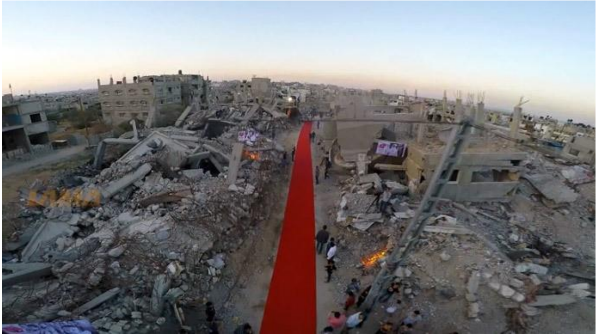
Fig. 5 Khalil Mozaïen (Lama Studios), Gaza Red Carpet Film Festival , 2015