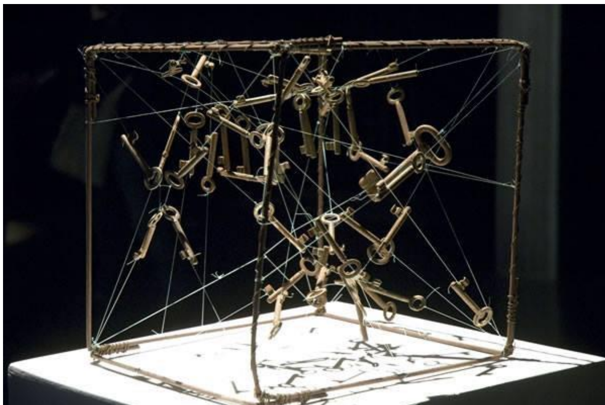
Fig. 4 Mohamed Abusal, The Magic Box , installation, 2004.

© Avec l'aimable autorisation de l'artiste