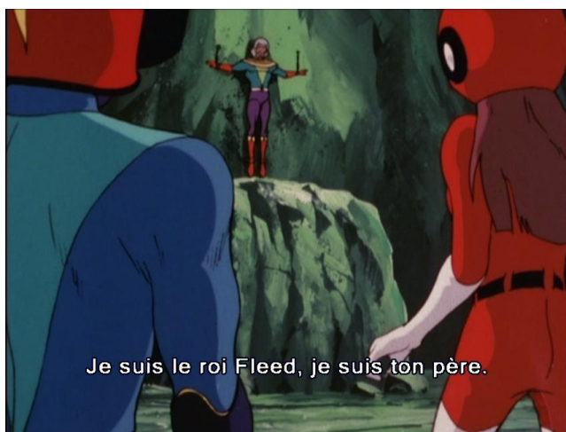
Figure 10 : Phénicia croit retrouver son père.