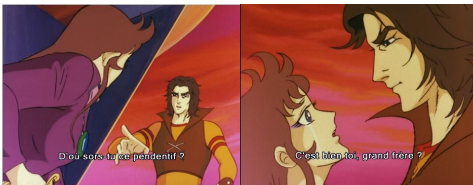
Figure 9 : les retrouvailles entre Actarus et sa sœur Phénicia.

Même les retrouvailles entre Actarus et sa vraie sœur Phénicia sont loin d'être sereines. Phénicia tente d'abord de tuer son frère parce qu'elle croit qu'Actarus est un soldat de Véga qui a pris possession de Goldorak. Dans la scène où ils sont confrontés l'un à l'autre, le mur du Centre agit esthétiquement comme le signe d'une opposition qui pourrait virer au drame (figure 9). Phénicia sort son épée mais l'erreur tragique est évitée de justesse grâce aux médaillons royaux qu'ils portent autour du cou : en les voyant, Actarus et Phénicia se souviennent, à travers des images en flashback , de la chute d'Euphor face aux forces de Véga, lorsqu'Actarus avait dû laisser sa petite sœur derrière lui pour essayer de sauver le palais. Les médaillons suscitent la reconnaissance mutuelle, et le frère et la sœur se tombent dans les bras devant Vénusia et Alcor, qui tiennent le rôle des spectateurs émus. L' anagnorisis crée un moment où les souvenirs et l'émotion sont transformés en spectacle.