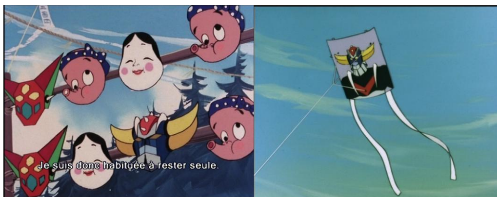
Figure 13 : les produits dérivés intégrés à l'histoire

Goldorak semble nous dire que le passé n'est jamais retrouvable en l'état mais qu'il faut entretenir sa mémoire. C'est, en effet, en retrouvant le souvenir de l'amitié que Syrus épargne Phénicia. C'est en retrouvant le souvenir de l'amitié que Pollux non seulement épargne Actarus mais le guérit de sa blessure au bras. La thématique du lavage de cerveau, si présente dans l' anime , travaille la question de la mémoire manipulée ou manquante et renvoie aussi à notre propre expérience de spectateur.rice : de quel Goldorak nous souvenons-nous ? Cette question s'est posée avec d'autant plus d'acuité que les enfants qui ont vu l' anime lors de sa diffusion originale à la fin des années 1970 ont dû attendre patiemment les rediffusions télévisées, puis la sortie des coffrets DVD, ce qui a pris de nombreuses années suite aux problèmes de copyright . J'ai moi-même tellement joué et rejoué, avec mon frère quand nous étions petits, la scène de retrouvailles entre Actarus et Phénicia que j'ai été très surprise par la