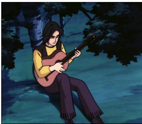
Figure 1 : la nostalgie d'Actarus pour Euphor.

Goldorak s'ouvre sur le refus de la répétition du passé. Actarus, réfugié sur Terre après l'attaque de sa planète Euphor et l'assassinat de ses parents par les forces de Véga, ne veut pas que l'horreur se reproduise sur la « planète bleue » et défend les humains au péril de sa vie, à bord du robot-soucoupe Goldorak qu'il a dérobé à Véga. Dans le même temps, le passé est l'objet récurrent des pensées d'Actarus, qui s'isole régulièrement pour jouer à la guitare sa « complainte d'un lointain pays » et pour se remémorer la vie sur Euphor (figure 1). Entre nostalgie des moments euphoriques et édéniques avant l'attaque et rappel traumatique du moment où tout a basculé, les rêves et les flashbacks usent de l'image fixe, souvent crayonnée et stylisée, pour refléter la prégnance d'un passé à la fois ineffaçable et indicible (figure 2).