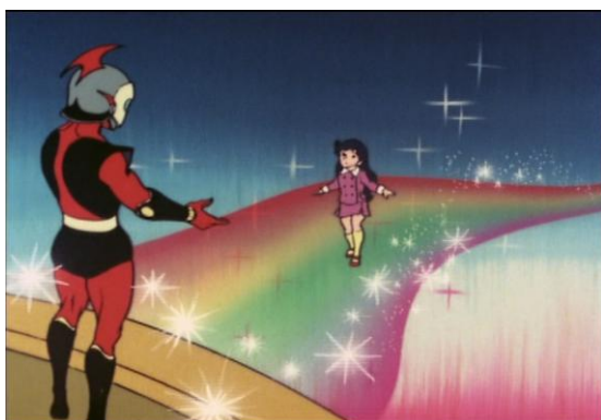
Figure 12 : Cassiopée rencontre Actarus.

comment la jeune orpheline Cassiopée tente, en vain, de retrouver ses parents dans ses visions. Dans l'épisode 19, Actarus s'occupe d'un orphelin déraciné qui a dû laisser derrière lui son joli village natal, dévasté par des météorites. À chaque fois, Goldorak, ou Actarus, apparaît comme le Graal qui permet à l'enfant d'atteindre son but ou de surmonter sa déception. Le jeune espion de l'épisode 10, pour gagner son ticket vers les étoiles, doit d'abord trouver la cachette de Goldorak : de manière réflexive, il incarne le rêve des jeunes spectateurs qui auraient tant voulu voir et toucher Goldorak « en vrai ». De son côté, Cassiopée reflète le rêve de rencontrer le prince d'Euphor (figure 12). L' anime va jusqu'à diégétiser son merchandising , le désir qu'ont eu les enfants de s'approprier le robot. Ce dernier apparaît sous la forme d'un déguisement (dans l'épisode 44) à côté des masques japonais traditionnels ou sous la forme d'un cerf-volant que fait voler le jeune Mizar (épisode 66).