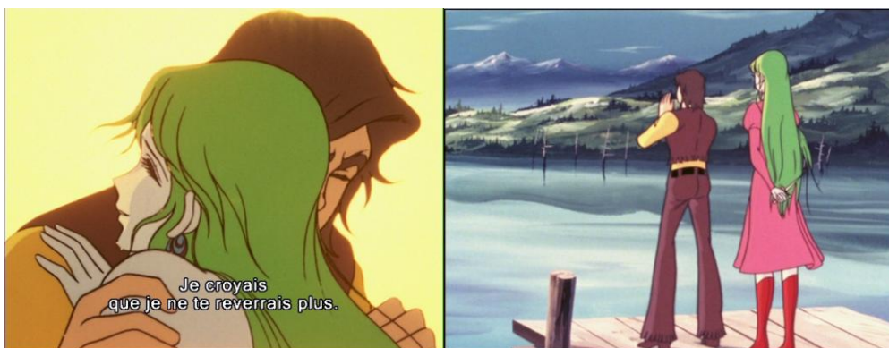
Figure 7 : les retrouvailles entre Actarus et Aphélie.