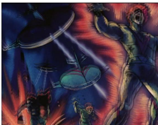
Figure 2 : le trauma de la chute d'Euphor.

Ce passé prend littéralement corps dans la vieille blessure radioactive au bras d'Actarus, qui se réveille dans l'épisode 30 et commence à s'étendre tel un compte à rebours morbide, dans des scènes qui érotisent, voire féminisent, le corps masculin souffrant et vulnérable (figure 3). La lésion au bras donne l'occasion à l' anime non seulement d'intégrer des flashbacks sur la manière dont Actarus a été blessé mais d'offrir des versions divergentes de