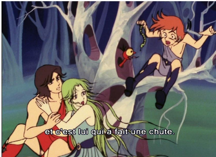
Figure 6 : Euphor en jardin d'Éden.