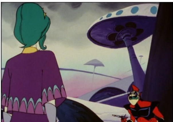
Figure 8 : Actarus croit retrouver sa mère dans un décor créé par Véga.

Aphélie et Pollux ont été les prisonniers de Véga, ont subi un lavage de cerveau et ont été manipulés pour tuer Actarus ; ils échouent à l'assassiner, implorant son pardon, puis se suicident. Sa mère Astrida n'est qu'un sosie envoyé pour désintégrer le prince grâce à la bague au lasernium qu'elle porte : l'armée de Véga met en place une véritable mise en scène cinématographique où elle contrôle acteurs, dialogues et décors afin de leurrer les sens d'Actarus. Une ville d'Euphor est créée sur Terre grâce à un générateur de mirages. Les retrouvailles ne sont ainsi qu'un piège (figure 8). La fausse mère fait croire à Actarus qu'elle a pu être ressuscitée grâce au savoir scientifique de Véga. Actarus refuse d'y croire mais elle lui demande de s'approcher pour lui prouver qu'elle est bien réelle. C'est la blessure au bras, le signe corporel et véritable du passé, qui se réveille et finit par donner l'alerte : la femme émet des radiations et est révélée comme une imposture. La disparition de l'illusion, lorsque la ville d'Euphor cède la place à de simples rochers, reflète l'évanescence et la spectralité d'un passé qui s'échappe toujours un peu plus à chaque fois que l'on souhaite le rattraper.