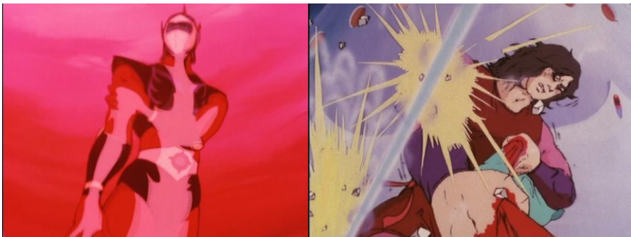
Figure 4 : les flashbacks divergents (épisodes 30 et 71) pour expliquer la blessure.

Le traumatisme nucléaire va jusqu'à influencer la manière dont les personnages imaginent l'avenir, dans des flashes toujours plus apocalyptiques où la destruction de Goldorak et la mort d'Actarus sont envisagées, mais aussi la fin de la planète Terre, ce qui révèle les préoccupations écologiques de l' anime . Le passé est peut-être omniprésent mais il est pourtant distillé par petites bribes aux spectateurs : ce n'est qu'au fil de la saga que nous découvrons l'histoire d'Actarus, ses attaches familiales, amicales et amoureuses. Ce dévoilement s'opère, non sans incohérences et invraisemblances 1 , comme dans les contes de fées, les épopées chevaleresques ou les romances shakespeariennes, par le biais d'un procédé dramatique classique, mais exacerbé et répété à de très nombreuses reprises dans l' anime : l' anagnorisis – en narratologie post-aristotélicienne, le moment où un personnage est enfin identifié et reconnu par un parent, un conjoint ou un proche 2 . Dans Goldorak , l'identité est souvent