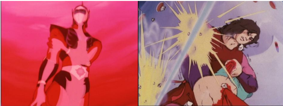
Figure 4 : les flashbacks divergents (épisodes 30 et 71) pour expliquer la blessure.

Le traumatisme nucléaire va jusqu'à influencer la manière dont les personnages imaginent l'avenir, dans des flashes toujours plus apocalyptiques où la destruction de Goldorak et la mort d'Actarus sont envisagées, mais aussi la fin de la planète Terre, ce qui révèle les préoccupations écologiques de l' anime . Le passé est peut-être omniprésent mais il est pourtant distillé par petites bribes aux spectateurs : ce n'est qu'au fil de la saga que nous découvrons l'histoire d'Actarus, ses attaches familiales, amicales et amoureuses. Ce dévoilement s'opère, non sans incohérences et invraisemblances 1 , comme dans les contes de fées, les épopées chevaleresques ou les romances shakespeariennes, par le biais d'un procédé dramatique classique, mais exacerbé et répété à de très nombreuses reprises dans l' anime : l' anagnorisis – en narratologie post-aristotélicienne, le moment où un personnage est enfin identifié et reconnu par un parent, un conjoint ou un proche 2 . Dans Goldorak , l'identité est souvent