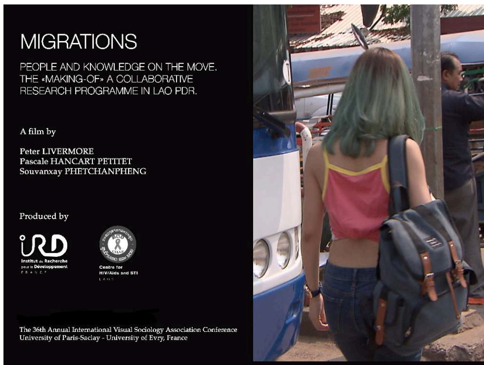
Affiche du film pour la 36 e conférence IVSA, 2018.