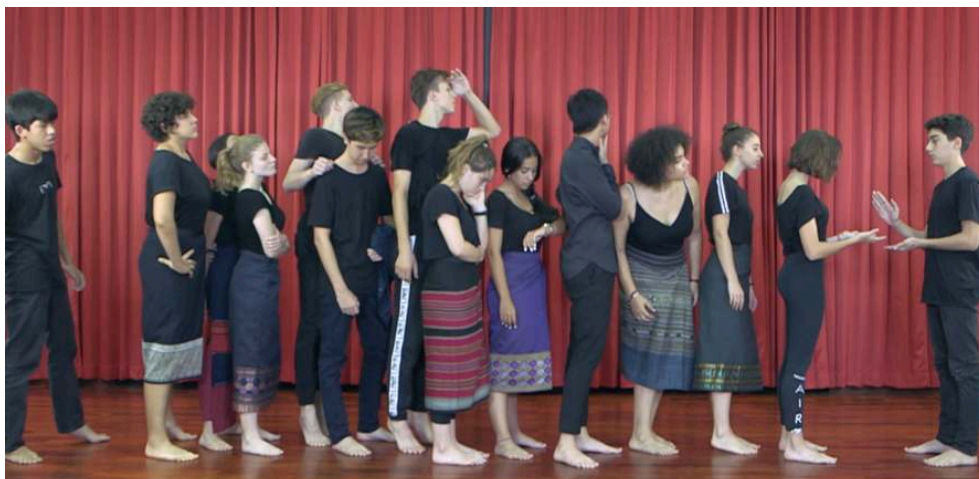
Une scène de la pièce Migrations. La science en scène avec l'ensemble des élèves de l'atelier théâtre du lycée français international de Vientiane

des restaurants. Les parcours biographiques de ces jeunes femmes et leurs expériences de la vie en ville réinterprétées par la troupe donnent une illustration mise en corps et en voix de ce qui se joue dans la construction de l'émancipation et de l'autonomie familiale, sociale, financière et sexuelle.