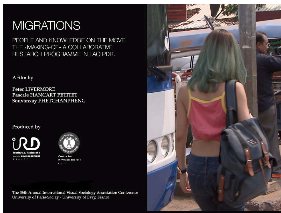
Affiche du film pour la 36 e conférence IVSA, 2018.