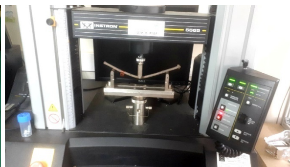
Fig. 2 : Branche d'érable après rupture lors d'un essai de flexion 3 points