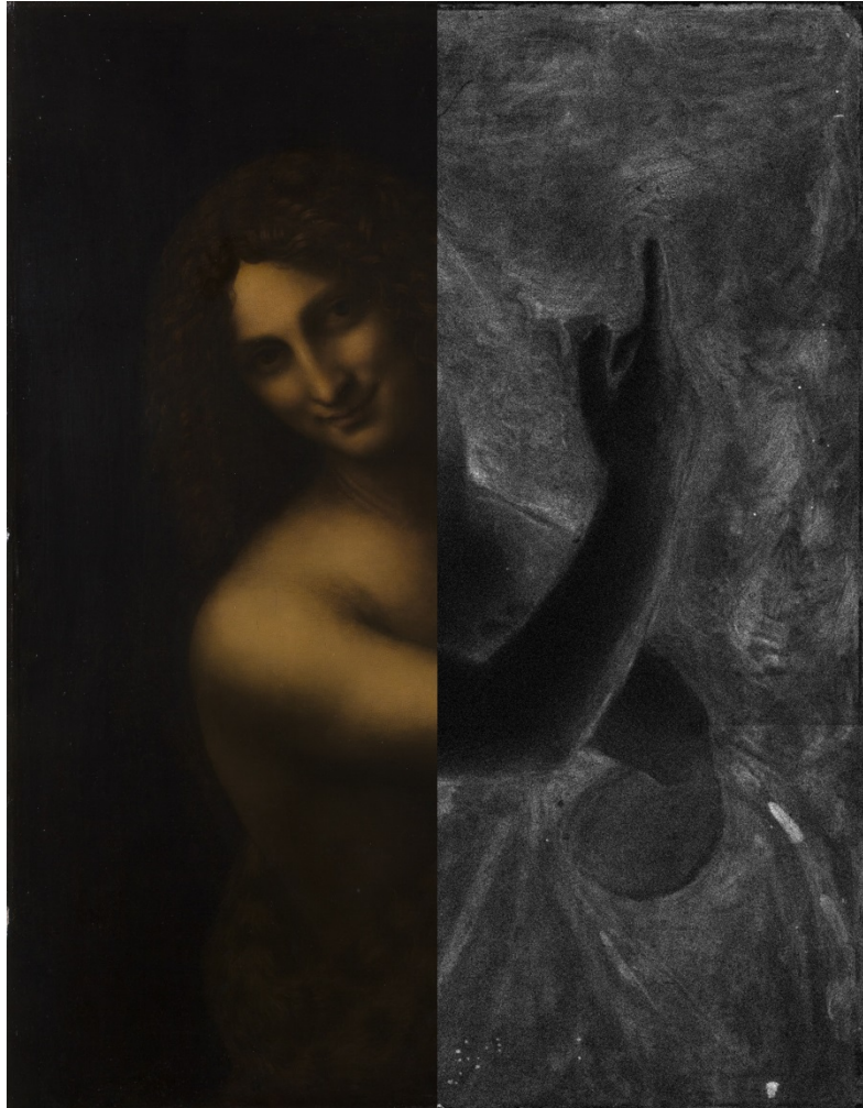
Léonard de Vinci, Saint Jean Baptiste , INV 775, musée du Louvre. Photographie en lumière directe et cartographie de la répartition du manganèse obtenue par fluorescence X 2D

Auditorium du musée du Louvre 25 octobre 2019