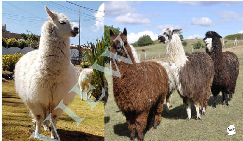
Figure 1 : Les lamas possèdent des anticorps très particuliers. Les populations de lamas et d'alpagas sont estimées à plus de sept millions en Amérique du Sud. L'Institut Pasteur élève un groupe de lamas (photo de droite) pour étudier ces anticorps particuliers (collection Jean Dupouy-Camet et Marc Dhenain).

Les nanocorps ont été découverts par hasard lorsque, dans le cadre de travaux pratiques d'un cours sur les anticorps, donné par un Professeur d'une Université belge, des étudiants auxquels avaient été confiés des échantillons de sang de dromadaire ont révélé un groupe d'anticorps qui ne correspondait à rien de connu (SANOFI, 2020). Ces anticorps particuliers sont une sous-classe d'IgG spécifiques des camélidés qui ne possèdent qu'une chaîne lourde alors que les IgG conventionnelles possèdent une chaîne légère et une chaîne lourde ( figure 2 ). Mis à part les camélidés, ce type d'anticorps n'existe pas chez d'autres espèces, à l'exception curieuse des requins et autres poissons cartilagineux (Harmsen & De Haard, 2007 ; Maass et al. 2007 ; Chames & Baty, 2009). C'est à partir de ces anticorps qu'on a pu concevoir des anticorps à domaine unique appelés fragments VHH ou nanocorps ou nanobodies. Les VHH ont un poids moléculaire de 12-15 kDa contre environ 150 kDa pour les anticorps conventionnels. Ces VHH sont facilement synthétisables et exprimés dans des systèmes eucaryote et procaryote. Ils ont une pénétrabilité exceptionnelle, sont capables de traverser la barrière hémato-encéphalique (Li et al. 2016), et peuvent améliorer la biodisponibilité pour des applications thérapeutiques ou diagnostiques (Lafaye & Li, 2018 ; SANOFI, 2020). Les VHH sont stables et pourraient être administrés par inhalation, notamment pour soigner les infections respiratoires.