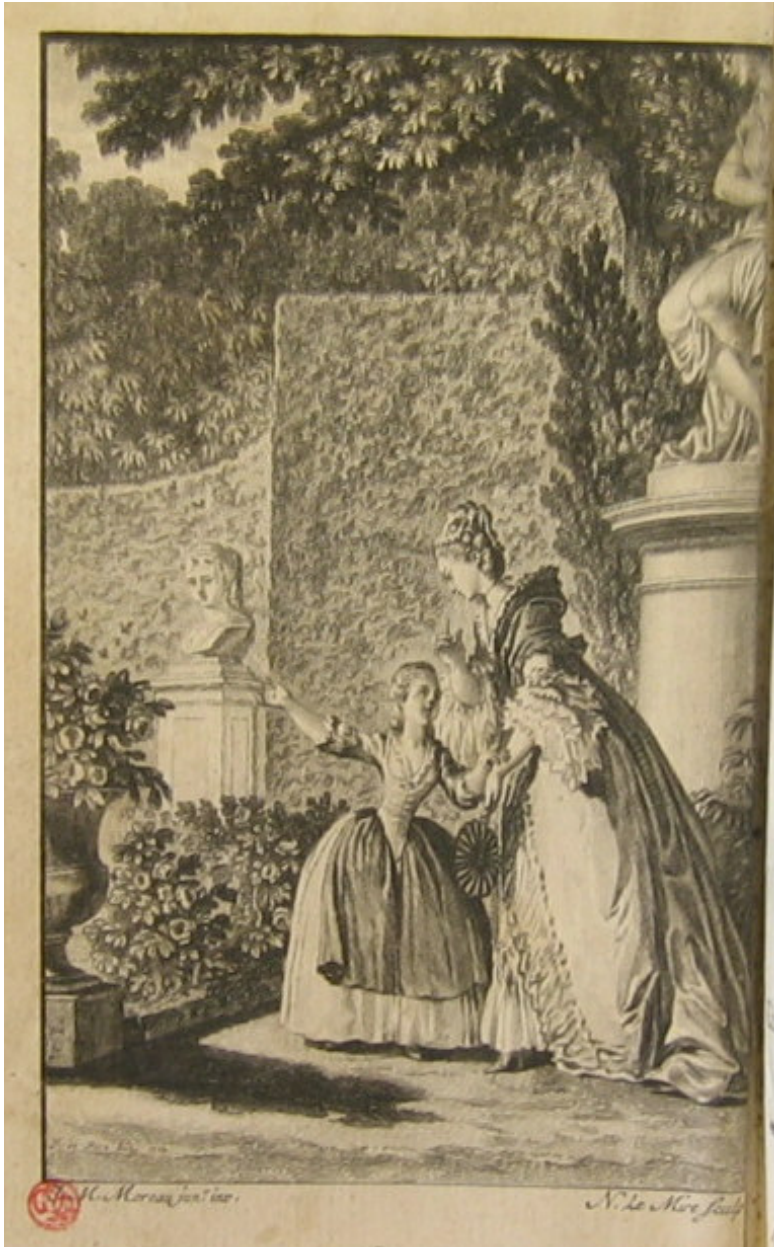
Figure 3. — Jean-Michel Moreau le Jeune, frontispice du tome I, Madame d'Épinay, Conversations d'Émilie , Paris, Humblot, 1781, in-12°. ouvrage conservé à la Bibliothèque Municipale de Versailles