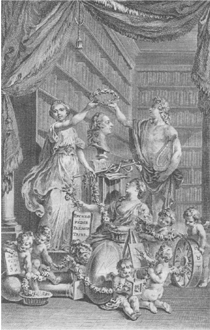
Figure 4. — Hubert-François Gravelot, frontispice du tome I, Petite Encyclopédie élémentaire ou introduction à l'étude des lettres, des sciences et des arts. Ouvrage utile à la jeunesse et aux personnes de tout âge, enrichi d'amples notices des meilleurs auteurs dans chaque faculté, et orné d'estampes en taille-douce , Paris, Hérisson fils, 1767, in-4°, Source bibliothèque de l'INRP (Institut National de Recherche Pédagogique), Lyon ( www.inrp.fr/she )