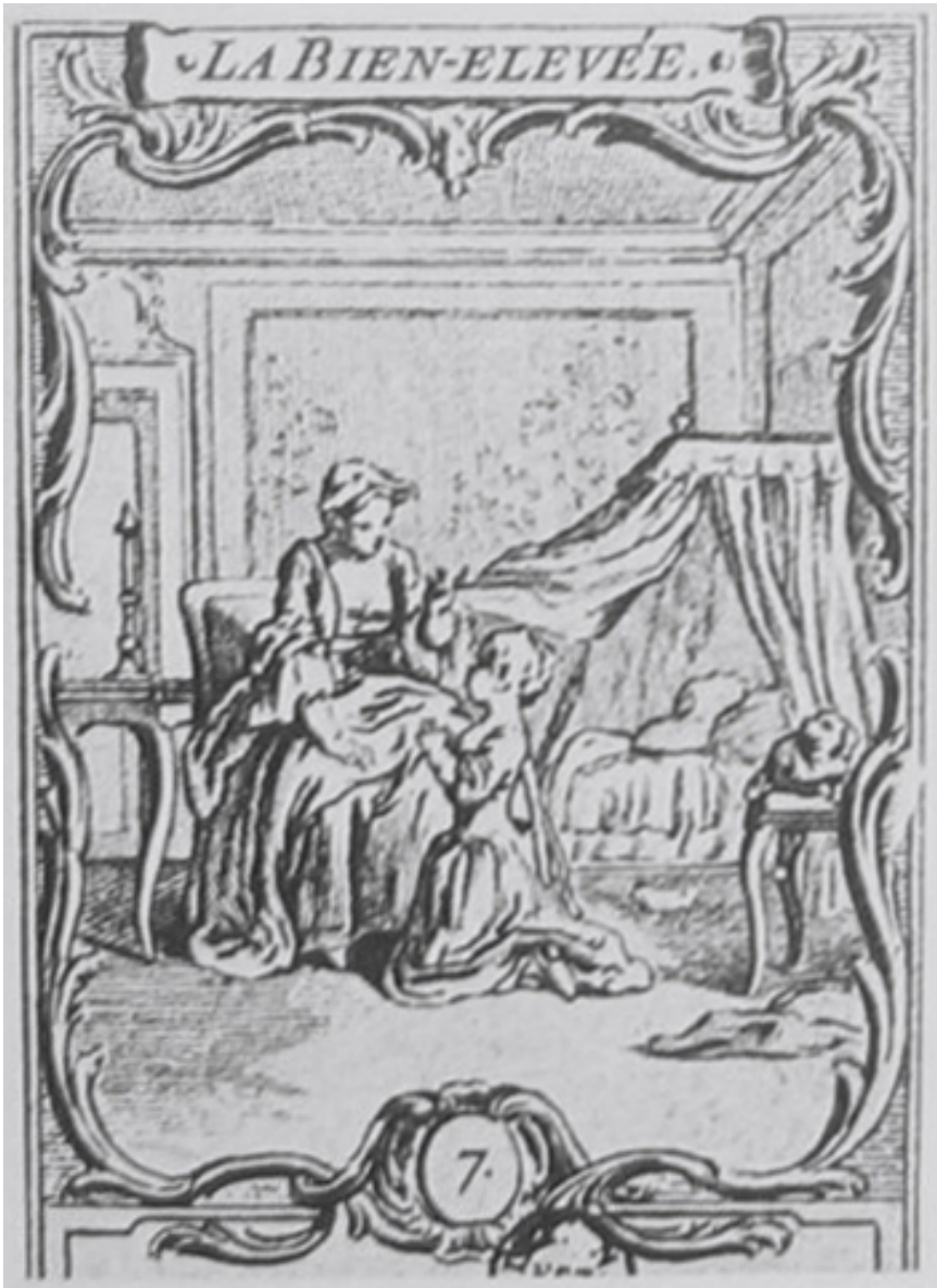
Figure 2. — Hubert-François Gravelot, « La bien-élevée », n° 7, Almanach utile et agréable de la loterie de l'École Royale Militaire, pour l'année 1760 , Paris, Pault et Le Clerc. 1760, in-32°