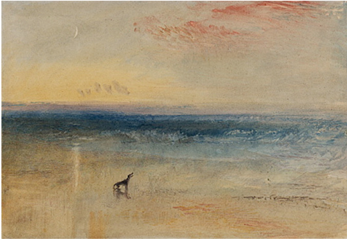
Fig. 2. – L'aube après le naufrage , J. M. W. Turner (1841). Le drapé rouge des nuages et l'ondoiement des vagues bleues séparés par le jaune du soleil naissant. Un naufrage ? Il semble que la tempête soit passée, le chien serait le seul témoin du drame qui s'est noué durant la nuit. Il regarde vers le hors-champ, là où pourrait se situer le bateau naufragé.