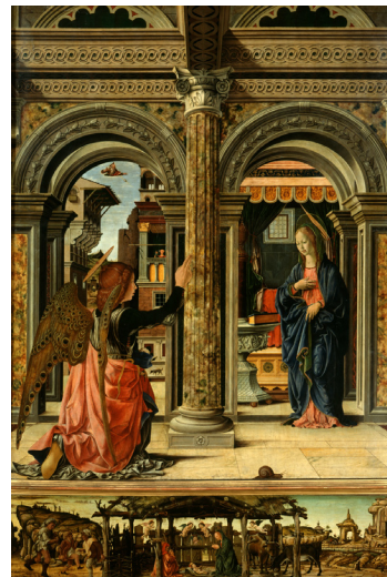
Fig. 3. – L'Annonciation de Franco del Cossa (1470), exposée à la Gemäldegalerie Alte Meister à Dresde. Outre les éléments iconographiques classiques pour un tel sujet, il y a des aspects innovants comme la disposition des deux personnages, la représentation divine de petite taille qui contraste avec la présence surprenante d'un bel escargot de Bourgogne au premier plan. Une fois remarqué, ce dernier focalise le regard et nous interroge sur le message de l'artiste.