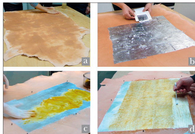
Fig. 3. Étapes successives de la préparation des cuirs dorés modèles, d'après la recette de Fougeroux de Bondaroy (1762).

Dans un premier temps, des échantillons modèles ont été préparés selon la technique décrite au XVIII e siècle par Fougeroux de Bondaroy 5 en utilisant des feuilles d'argent modernes provenant de trois fournisseurs différents. Comme au XVIII e siècle, les cuirs dorés modèles ont été réalisés sur des peaux de mouton entières de tannage végétal. Après application de colle de peau sur le cuir humidifié (fig. 3a), des feuilles d'argent ont été déposées les unes à côté des autres (fig. 3b), puis la surface argentée a été brunie. Le vernis jaune, préparé en amont, a été appliqué en deux couches successives (fig. 3c). Afin de conserver une zone « argentée », le vernis, encore liquide, a été retiré sur la moitié de chacune des peaux (fig. 3d). Ces échantillons ont permis l'optimisation de la méthode d'analyse sur AGLAE et la compréhension de l'influence des caractéristiques de la feuille d'argent sur son comportement et sa dégradation.