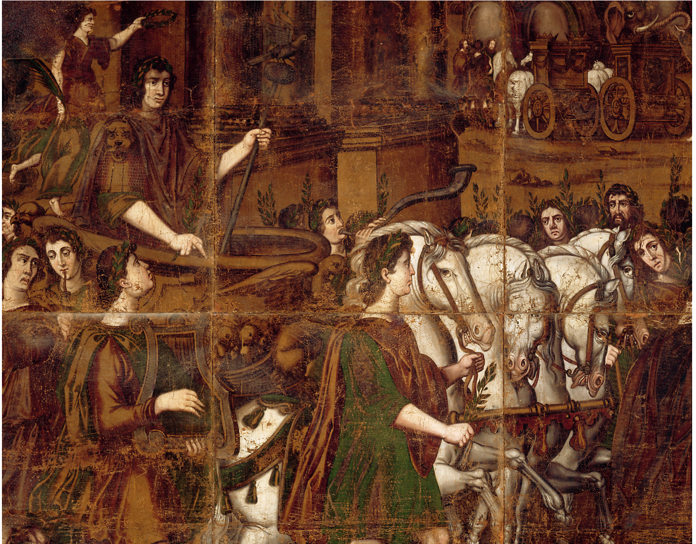
Fig. 1. Le Triomphe de Scipion , d'après Antonio Tempesta, tenture de cuir peint, XVII e siècle, musée national de la Renaissance, Écouen.