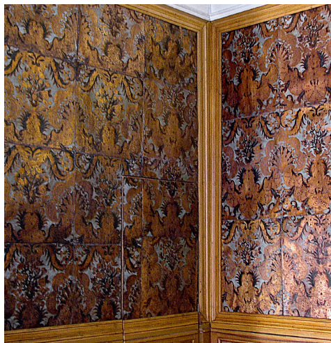
Fig. 4. Tenture murale de l'antichambre, château de Maintenon, Pays-Bas, vers 1740.