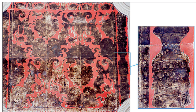
Fig. 6. Décor en cuir argenté polychrome dont les zones « argentées » sont entièrement ternies (collection particulière).

Sur la base de ces observations, un projet –CORD'ARGENT – centré sur l'étude de la corrosion de la feuille d'argent des cuirs dorés a débuté dans la continuité du projet CORDOBA en collaboration avec l'Institut Lavoisier de Versailles. L'étude devra tenter de déterminer les éléments susceptibles d'être impliqués dans le processus de dégradation et de préciser les mécanismes et la vitesse des réactions mises en jeu ; mais il conviendra au préalable de s'intéresser à deux étapes essentielles de la vie de l'œuvre : sa fabrication et sa restauration. Le projet s'articulera autour de trois axes : l'influence des caractéristiques physico-chimiques propres à la feuille d'argent sur sa réactivité, les interactions entre l'argent et les matériaux organiques constitutifs des cuirs dorés, et l'impact des traitements de restauration. Dans cette étude seront utilisés des échantillons d'argent et de cuir argenté vieilliss artificiellement sur lesquels la vitesse d'oxydation du métal sera évaluée ; seront également utilisés des cuirs dorés anciens en cours de restauration sur lesquels l'effet des traitements habituels sera évalué.