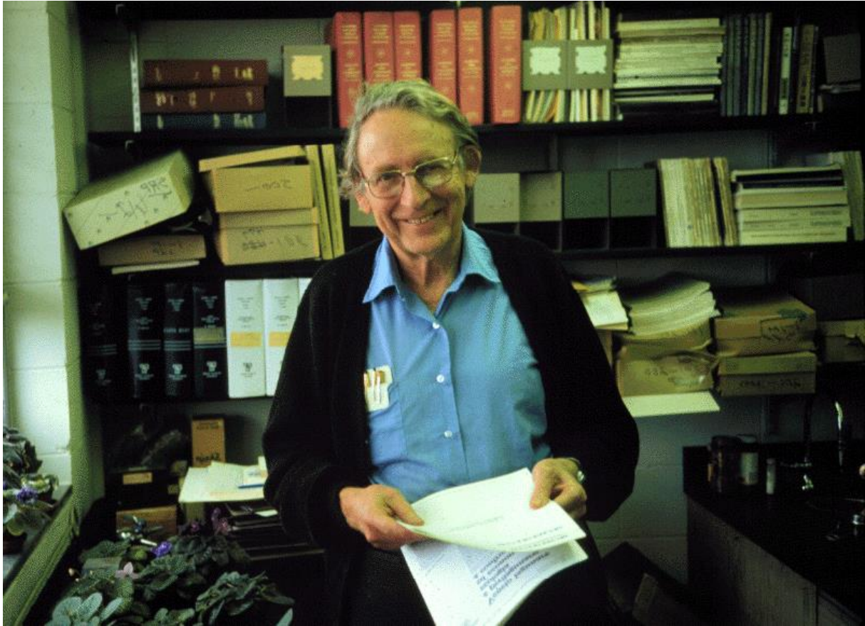
Figura 5. Prof. Eugene P. Odum dell'Università della Georgia, Atene, Institute of Ecology. Con il fratello Howard T. Odum, pubblicarono "Fundamentals of Ecology, diventando famosi nel mondo intero per i loro lavori pionieristici sulla dinamica degli ecosistemi naturali e degli agrosistemi industriali (Coleman et al., 1992; Odum e Barrett, 2004).

Non importa come si chiamino, agricoltura biodinamica o biologica o sostenibile, i campi devono assomigliare il più possibile a foreste o praterie (Fig. 6). A Padova ho organizzato tre conferenze internazionali, ho portato i nostri colleghi tecnici a visitare il modello di sostenibilità delle quattro aziende agricole in Ohaio. Sfortunatamente, poco è cambiato nei nostri campi coltivati, niente o quasi nulla è accaduto nell'Università veneta e nei mondi agricoli.