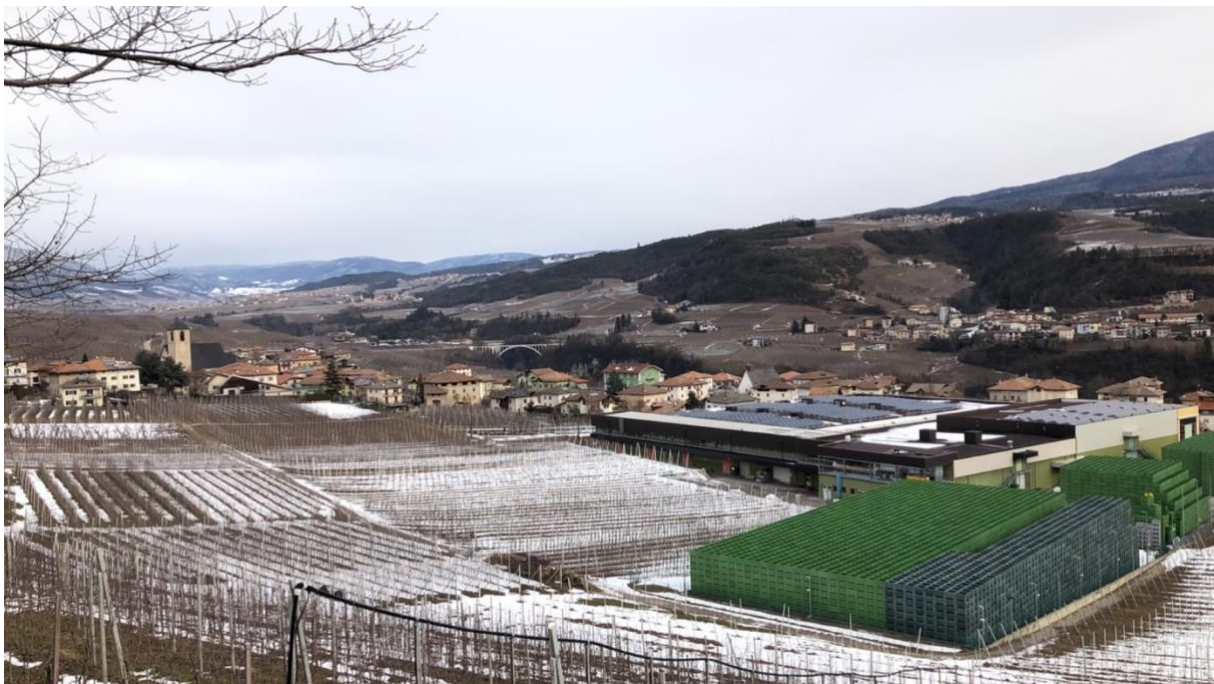
Fig. 1. Tassullo, un villaggio di 800 abitanti in Val di Non. Le laboriose popolazioni della valle hanno trasformato l'ambiente in cui vivono mantenendo il passo con la scienza. Le parti beige sono frutteti nella stagione invernale, piantati sempre più in alto al posto della foresta. In primo piano a destra c'è un deposito cooperativo di mele. Nel villaggio, il ritmo del lavoro segue quello delle fasi della produzione delle mele.

Alcuni giorni fa, su Sciences ( https://www.sciencemag.org/news/2019/11/new-genetically-modified-corn-produces-10-more-similar-types ), i ricercatori hanno presentato del mais transgenico che produce 10 % in più rispetto ad altri mais. Come dire: in 4,5 miliardi di anni, la natura è passata da poche cellule a milioni di esseri viventi complessi e tanto numerosi che non siamo ancora riusciti a contarli tutti. Oggi, grazie alla scienza, noi umani riusciamo a fabbricare nuovi organismi che sanno recuperare per la loro crescita più risorse che nel passato. Sanno come evitare altri organismi e crescere più velocemente. Artificialmente mettiamo in loro il potenziale di due o tre organismi. Ciò ridurrà la biodiversità e darà più risorse all'uomo, che poi si nutrirà di questi organismi modificati. È questo processo sostenibile? È veramente questo che vogliamo?