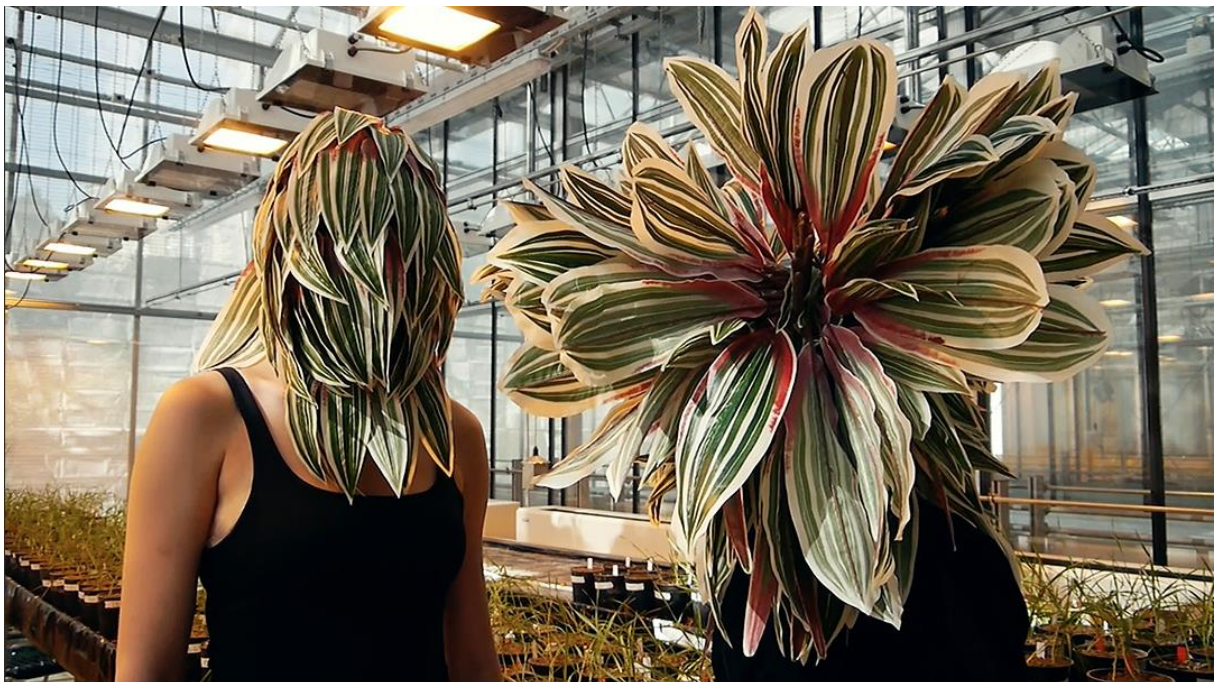
Figure 8. Comunicazione. Titolo originale: Extrait du film Devenir-plante (manger la terre) , 2017.

Il secondo illustra un tentativo umano di diventare "vegetale", almeno in parte. In un simile atteggiamento, gli umani credono di perdere la faccia. La nuova postura farmer-punk, è proprio così brutta?