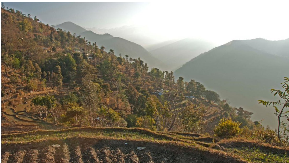
Figura 4. Un sistema agrosilvipastorale nell'area di conservazione di Gaurishankar, Nepal. L'arboricoltura fornisce la legna da ardere e il foraggio per il bestiame, e riesce così a mitigare la pressione sulle risorse forestali naturali.

I "nostri" villaggi sono piccoli laboratori viventi. Lavorando lì, vedo anche la capacità di trasformazione. E vedo come l'azione congiunta può garantire la sopravvivenza. Dopo il terremoto del 2015, quasi ogni singola casa è stata completamente distrutta. Un intero insediamento è stato minacciato da frane e ha dovuto essere abbandonato. Quando ero lì qualche mese fa, la maggior parte delle case era stata ricostruita (un insediamento completamente nuovo in un luogo sicuro), il vivaio che abbiamo creato