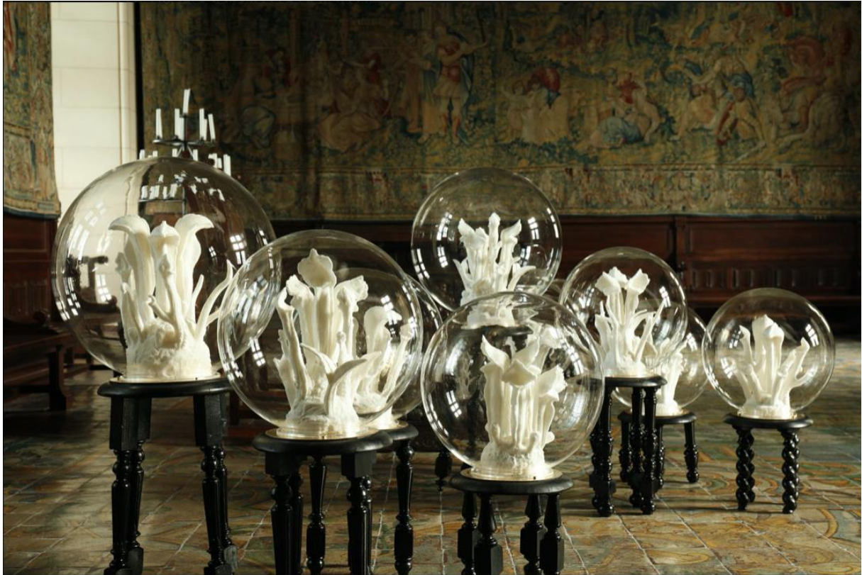
Figure 7. Confined ecosystems.

Il secondo illustra un tentativo umano di diventare "vegetale", almeno in parte. In un simile atteggiamento, gli umani credono di perdere la faccia. La nuova postura farmer-punk, è proprio così brutta?