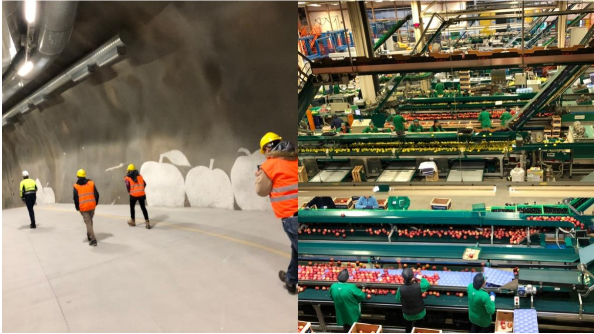
Figura 2. Val di Non. A sinistra: dopo la raccolta, le mele vengono conservate nel cuore della montagna, in celle fredde con atmosfera controllata per conservarle a lungo e venderle al momento giusto. La roccia isola le camere ad atmosfera controllata ed è stato calcolato che l'investimento verrà pagato con i risparmi energetici raggiunti. Le cooperative forniscono lavoro alla popolazione locale anche su base continua. Il personale stagionale arriva invece da molte parti del mondo nel momento della raccolta delle mele, organizzato in turni di lavoro coordinati per prendere la frutta nel posto prestabilito al momento giusto. La risposta climatica della valle è stata modellizzata e la raccolta segue la maturazione delle mele con cicli di alcuni giorni per fascia, predefiniti in ogni area da personale specializzato. A destra: preparazione automatizzata dei carichi di mele da esportare in tutto il mondo.