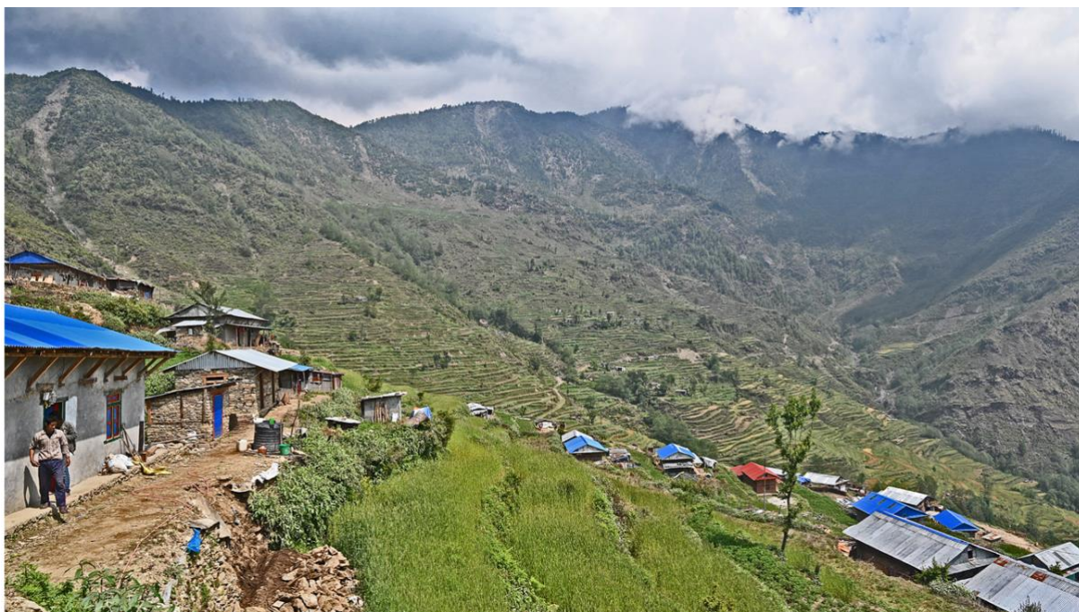
Figura 3. Una comunità di allevatori di colline nel Nepal. Le foreste sono degradate a causa della sovrautilizzazione a fini agricoli (pascolo del bestiame, abbattimento di alberi per foraggi e legna da ardere, rastrellamento della lettiera (la lettiera viene utilizzata come lettiera per animali e il compost, mescolato con urina e feci viene applicato come fertilizzante nei seminativi)).