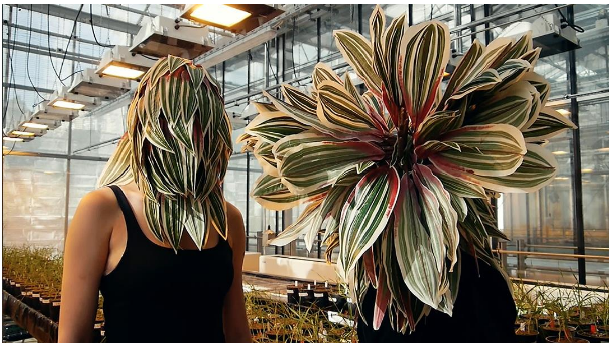
Figure 8. Comunicazione. Titolo originale: Extrait du film Devenir-plante (manger la terre) , 2017.

Il secondo illustra un tentativo umano di diventare "vegetale", almeno in parte. In un simile atteggiamento, gli umani credono di perdere la faccia. La nuova postura farmer-punk, è proprio così brutta?