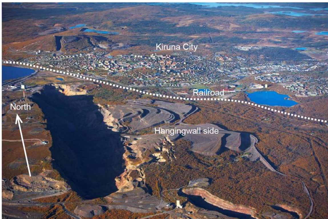
Figure 1. Vue aérienne de Kiruna, en 2010. La voie ferrée sépare la mine du centre-ville © Stöckel et al. (2012).

Kiruna : c'est l'une de ces villes placées aux confins du cercle polaire arctique. A cent quarante-cinq kilomètres Nord précisément. Plongée dans l'obscurité la moitié de l'année, Kiruna est coincée entre deux montagnes : au Nord, Luossavaara, une ancienne mine à ciel ouvert, aujourd'hui vidée de « ses ressources » ; au Sud-Ouest, Kiirunavaara, l'une des plus grandes mines sous-terraines du monde, surplombe un territoire de 19 447 km 2 , habité par 23 000 âmes humaines . Les voyageurs les moins frileux, tout comme les minerais de fer encore chauds, y empruntent l'Arctic Circle Train, que les locaux et les locales se plaisent à décrire comme « le train le plus long d'Europe », et dont les voies ferrées jouent à nouveau un rôle central dans l'histoire du territoire (Figure 1).