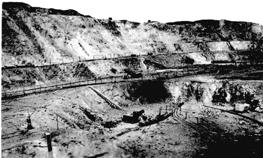
Figure 3. Cliché de la mine de Kiirunavaara, non daté © Chabot (op. cit.).

Le « sens de l'histoire » pointe désormais les entrailles de la montagne Kiirunavaara qui se trouvent bien démunie, malgré ses 773 mètres d'altitudes. L'expansion de la mine pose des fondations bien fragiles d'un développement (incontrôlé), guidé par des espérances de profits toujours plus élevées. Ces profits ne profitent que peu aux employés. Le 9 décembre 1969, les