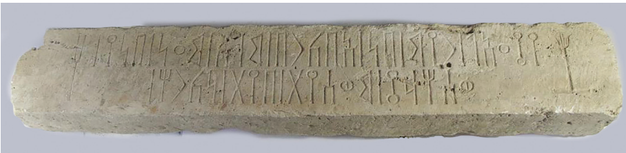
Fig. 5: Inscription minéenne YM 16724