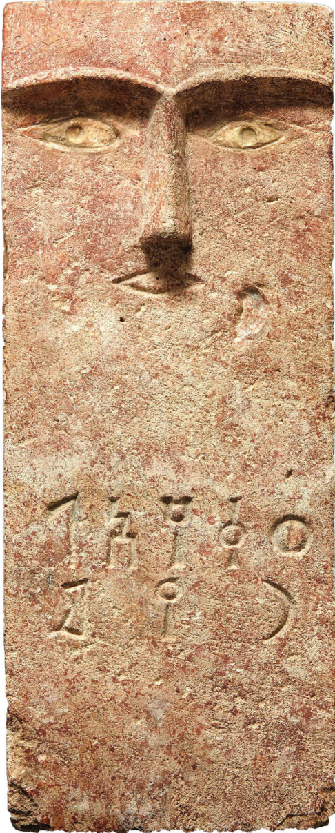
Fig. 1: Stèle funéraire royale (?) au nom de Waqah'il Riyām ("Bron Semitica 55.1", in: Bron 2013)