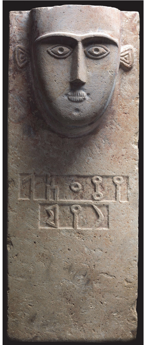
Fig. 2: Stèle funéraire royale (?) au nom de Yatha'il Riyām ("Bron Semitica 56", in: Bron 2014)