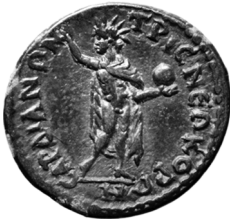
Figure 11 - SNG von Aulock 8259.