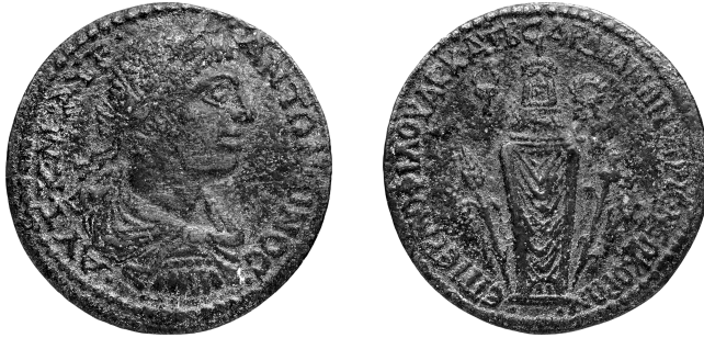
Figure 16 - Bronze de Sardes ; Koré.

Nous approuvons donc l'hypothèse de M. Icks, qui a vu que c'était le symbole du « mariage » d'Hélios et de la Koré de Sardes 140 . Le revers aux quatre temples et la monnaie au quadriga se répondent : la Koré, à qui l'on prêtait une dimension lunaire, s'alliait avec le Soleil. Nous nous demandons d'ailleurs si sur la tête de la Koré il n'y a pas les symboles astraux correspondant à cette union ; certes on a affaire à des éléments minuscules, mais le graveur a clairement séparé la Koré elle-même, faite en quelque sorte d'un bloc, et ce qui est au-dessus de sa tête. Or à la place du calathos ou polos maintes fois reproduit, on a peut-être bien un croissant lunaire surmonté d'un disque qui pourrait