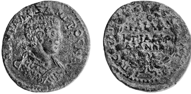
Figure 2 - Bronze de Sardes (© RPC VI online 4487, Collection Kagan).