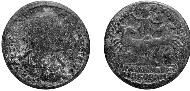
Figure 15 - Bronze de Sardes ; quadriga d'Hélios (© BnF, MMA, Fonds général 1282, Paris).