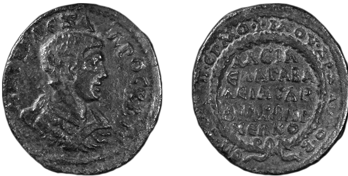
Figure 6 - Bronze de Sardes.

L'un des enseignements majeurs de ces types d'Hermophilos est le nom plus complet du concours créé sous Élagabal 73 . Sur la monnaie publiée autrefois par L. Robert, le nom sous la couronne monumentale, dérivé du théonyme émésien, semblait indiquer que le dieu était honoré sous son aspect originel. Cela pouvait légitimement paraître remarquable et l'auteur ne manquait pas de souligner le contraste avec l'appellation d'« apparence hellénisée » à Émèse même du concours pour la divinité principale de la cité, les Ἥλια Πύθια 74 . Grâce à la monnaie conservée à Harvard (figure 6) et légendée Ἀλεῖα Ἐλαγαβάλεια, on sait désormais que Sardes n'avait point été aussi audacieuse et novatrice que ne le laissait entendre le bronze du Cabinet des Médailles. Le premier nom du concours était banalement celui des fêtes du Soleil dans bien des cités, à commencer par les grands concours isélastiques de Rhodes (Halieia / Haleia) ou Philadelphie (Deia Haleia), ou donc ceux de la patrie même du dieu et de l'empereur. Haleia Elagabalia correspond aussi à l'appellation du dieu à Rome, Sol invictus Elagabal .