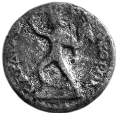
Figure 13 - Vienne GR.30156.