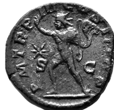
Figure 14 - RIC 300.

Les graveurs de Sardes se sont visiblement directement inspirés des types romains ou les ont même copiés. Les similitudes nous paraissent trop frappantes pour qu'on puisse les expliquer par les stéréotypes iconographiques ou une éventuelle inspiration commune, qui dans le troisième cas nous paraît presque impossible. Or ce dernier type est tardif à Rome : Élagabal est toujours trois fois consul. Nous ne doutons guère que ce sont les ambassadeurs sardiens à Rome qui ont vu et sans doute rapporté ces monnaies. L. Bricault a fait une