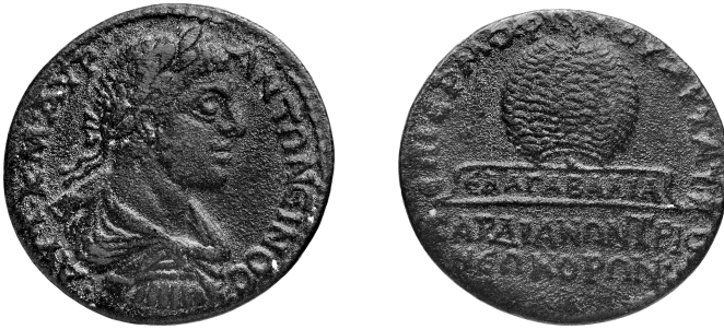
Figure 1 - Bronze de Sardes mentionnant les Elagabalia.