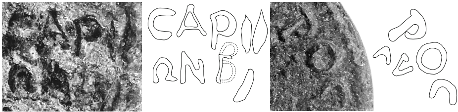
Figures 3-4 - Bronze de Sardes, détails (droit et revers) et dessins.

gamma originel, qui a d'ailleurs fait écrire dans le RPC online : [Γ?]. Le graveur s'est servi du gamma pour former le bêta (figure 3) : pour la partie inférieure, il a dessiné la boucle en partant un peu en dessous de la barre supérieure du gamma et a rejoint le bas de la haste de cette lettre, puis il a ajouté la partie supérieure du bêta en partant de la barre horizontale du gamma, ce qui fait que la lettre ainsi créée est bien plus grande que les autres ; la correction a été discrète et la lettre est peu visible, au point que le gamma originel, qui a la même hauteur que le reste, ressort toujours davantage.