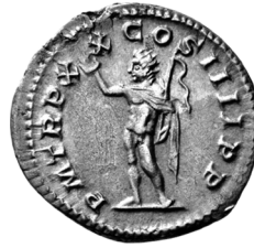
Figure 10 - RIC 293e.