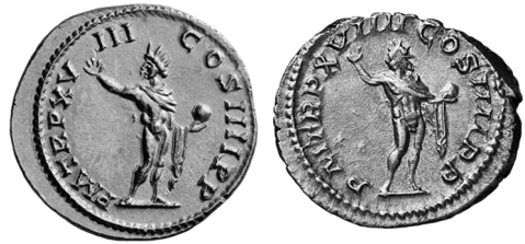
Figure 12ab - RIC 264d et RIC 281a.