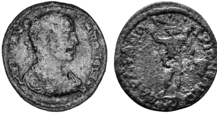
Figure 9 - RPC VI 4491.