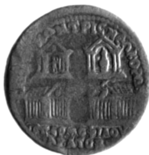
Figure 7 - Bronze de Sardes RPC online VI 4501 (d'après TRELL 1945).