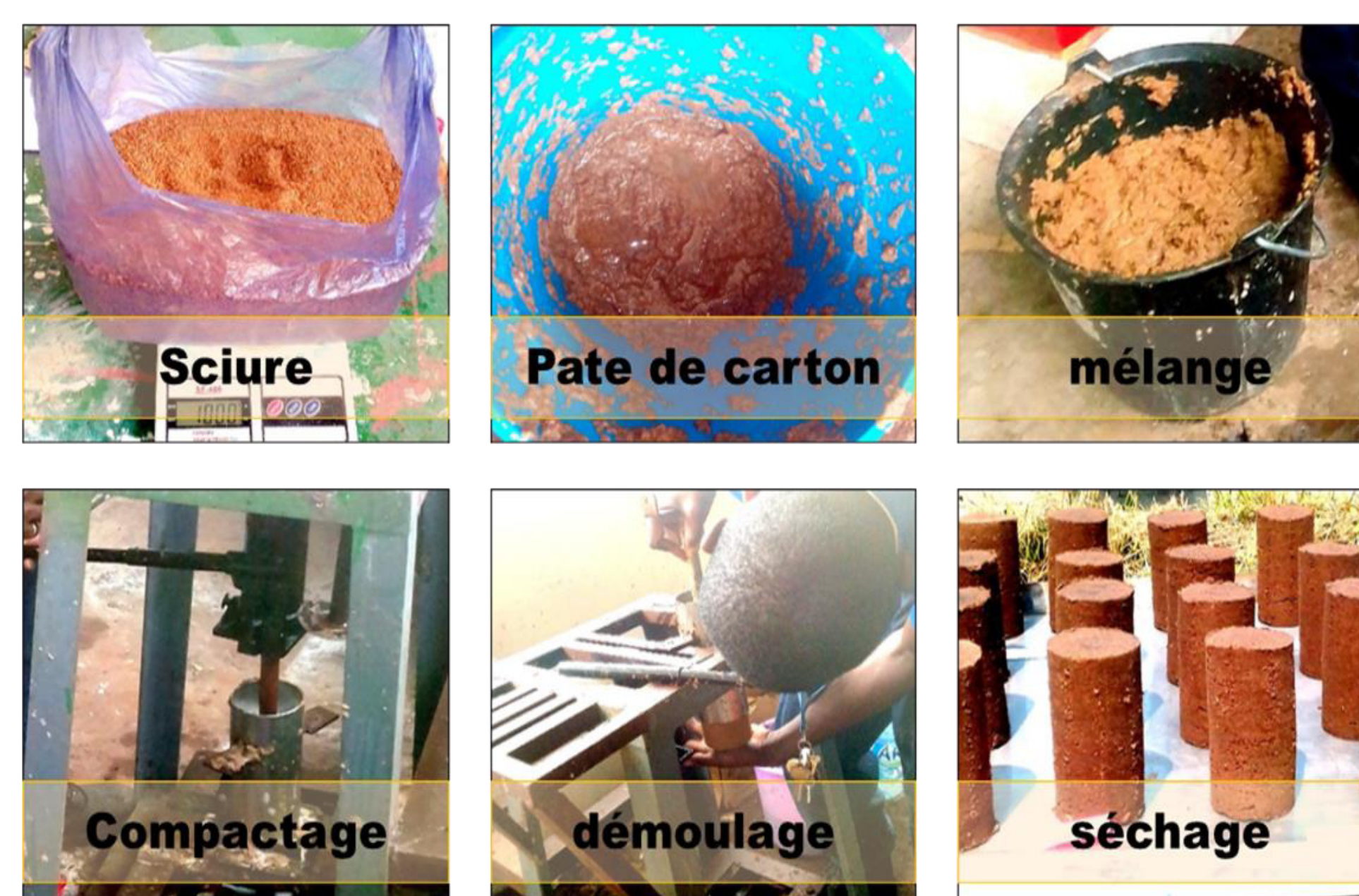
Figure 5 : les différents étapes de production des échantillons