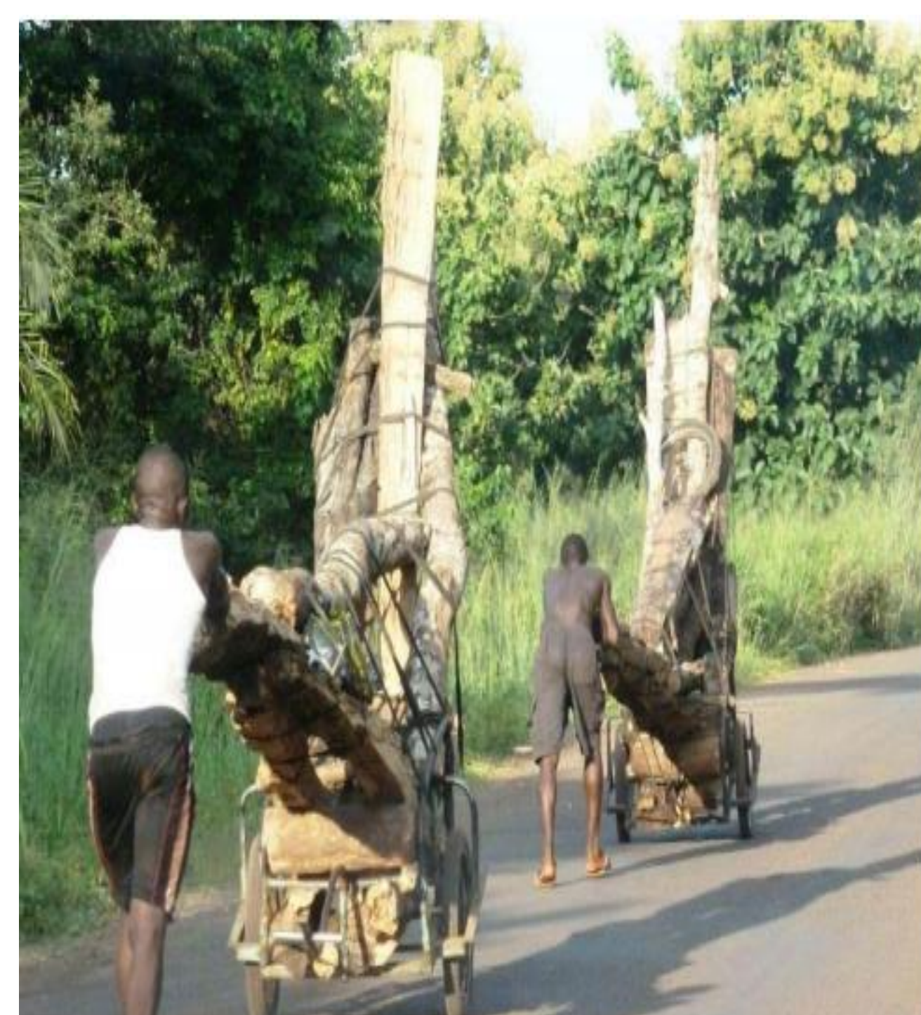
Figure 3 : bois coupés

* Plus de 20 à 30% de ces déchets de bois non utilisés surtout la sciure de bois, sont brûlés à ciel ouvert 24/24