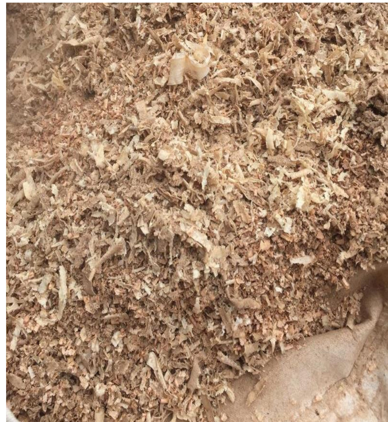
Figure 1 : sciure de bois