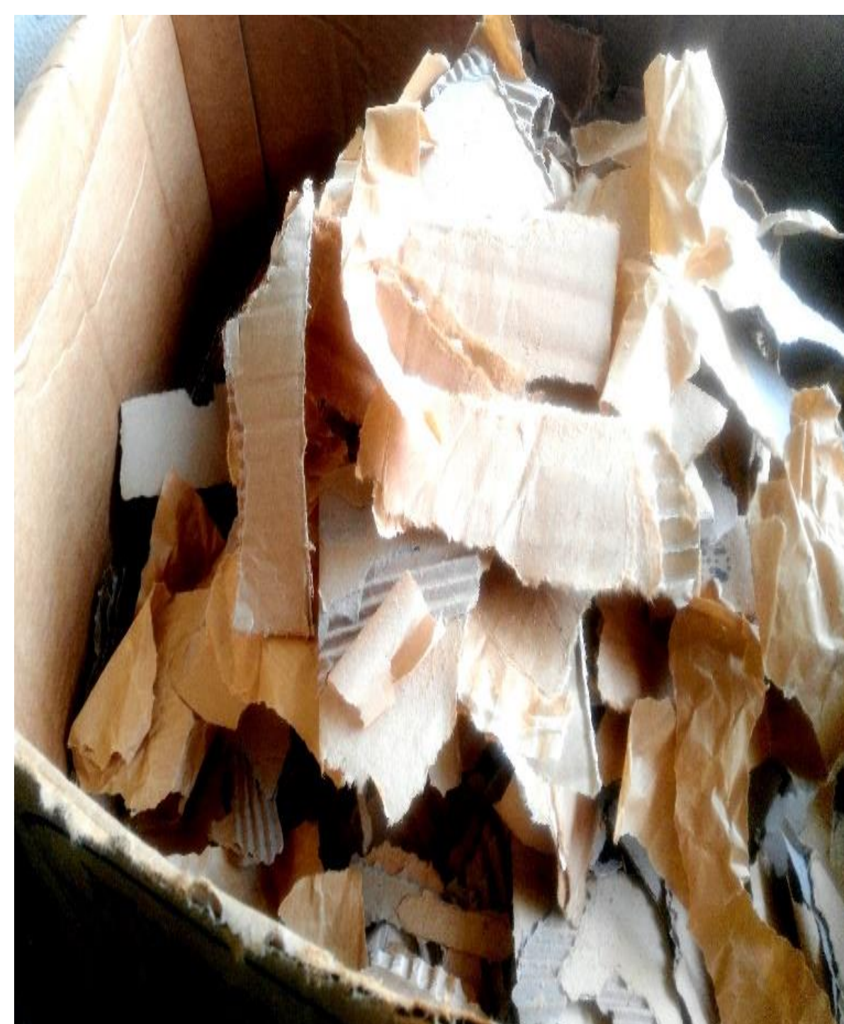
Figure 2 : papier en carton