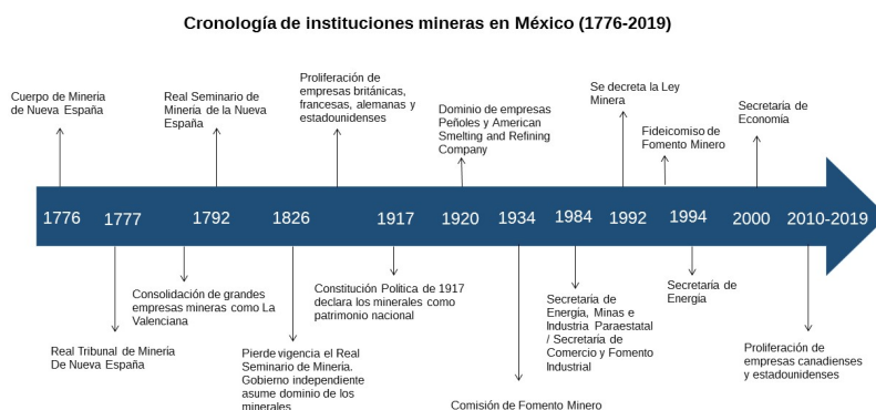
Figura 1. Cronología de las instituciones mineras en México (1776-2019). Elaboración propia.