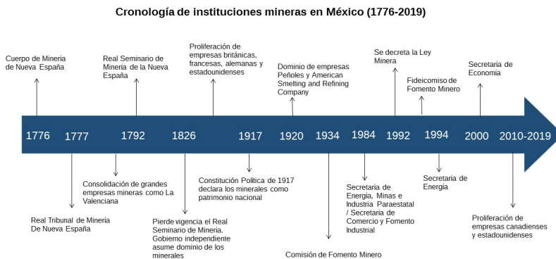
Figura 1. Cronología de las instituciones mineras en México (1776-2019). Elaboración propia.