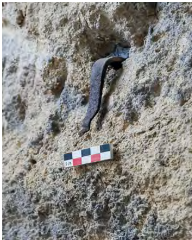
Fig. 170 – ORANGE, PCR « Architecture, technique et décor du théâtre antique ». Une patte à marbre et sa cale en plomb dans une cavité du front de scène.

Alain Badie, Sandrine Dubourg, Jean-Charles Moretti et Anna Papadopoulou