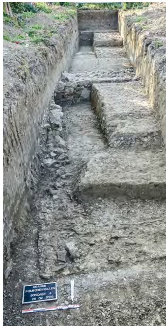
Fig. 168 – ORANGE, Fourches-Vieilles. Vue générale du sondage 4 avec, au premier plan, le bâtiment funéraire.

Ce bâtiment funéraire était placé au centre d'un enclos. De cet enclos, il a été possible d'observer le mur sud situé à environ 4,25 m du mur sud du bâtiment funéraire ainsi qu'un niveau de sol dans les sondages 1 et 4. Il est alors possible de restituer un enclos carré d'environ 16,50 m de côté (soit environ 55 pieds romains).