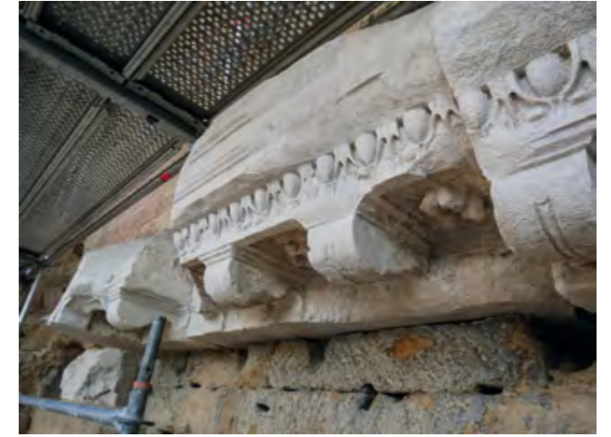
Fig. 171 – ORANGE, PCR « Architecture, technique et décor du théâtre antique ». La corniche en marbre et ses fleurons restaurés au deuxième ordre latéral.

Le théâtre d'Orange est un bâtiment très fréquenté et en perpétuelle évolution : les restaurations (jusqu'en 2023), le suivi archéologique, les visites et les chorégies se poursuivent. C'est pourquoi nous préparons, avec l'ensemble des acteurs et des utilisateurs du monument, un projet de maquette Bim dans le cadre de la fondation A*Midex. Il s'agira d'une base de données liée à une maquette numérique 3D. Cet outil, qui devra être cumula-