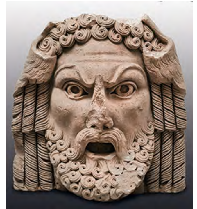
Fig. 169 – ORANGE, Fourches-Vieilles. Masque acrotère représentant Hercule découvert dans le sondage 2

Entre la zone sud (sondages 1, 2 et 4) et la zone nord du sondage 26, les recherches effectuées en bordure de l'ancienne voie d'Agrippa n'ont pas livré de vestiges antiques. En effet, la zone a fait l'objet d'un important réaménagement à l'époque contemporaine lors de la création d'une voie (actuelle avenue de Fourches-Vieilles). Les travaux et excavations réalisés pour l'aménagement de cette voie ont, semble-t-il, modifié grandement la stratigraphie du secteur et les probables vestiges s'y trouvant. Par ailleurs,