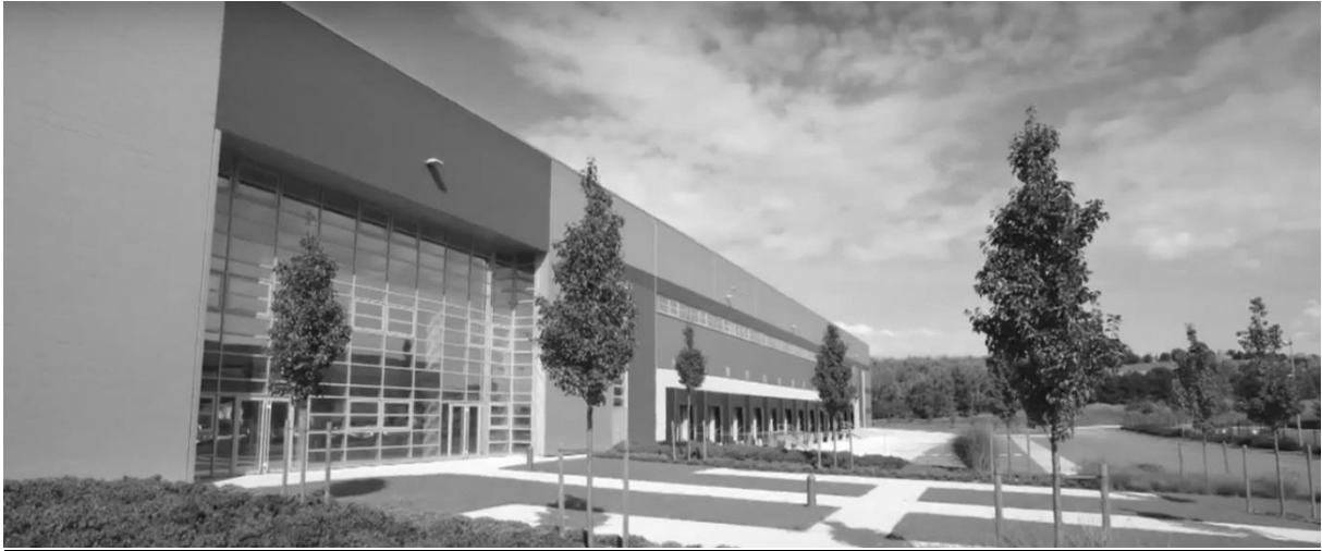
Parc logistique Prologis Chanteloup de Moissy-Cramayel (ville nouvelle de Sénart) : Prologis France, Prologis LONG ST ENG, 2014.

Même si ces parcs logistiques doivent être autorisés et soutenus par les communes et les intercommunalités concernées, leur principe même conduit à privatiser une partie des politiques locales d'aménagement – la conception, l'entretien de la zone logistique et même son accès relèvent exclusivement du développeur-investisseur immobilier – et de développement économique – le choix des entreprises locataires du parc dépend uniquement de l'opérateur immobilier.