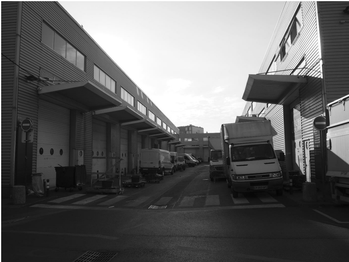
Nicolas Raimbault, entrepôts de grossistes du textile à Aubervilliers, 2018.

Au cours des années 1990, la géographie logistique francilienne connaît une rupture majeure. Les nouveaux entrepôts s'installent dans des périphéries de plus en plus éloignées, souvent sans histoire industrielle, en grande banlieue voire dans les couronnes périurbaines, où le foncier est moins onéreux et l'accessibilité aux autoroutes excellente. Une « périurbanisation logistique » (Dablanc et Frémont 2015) est à l'œuvre. Elle contribue directement à l'étalement urbain francilien. L'aménagement de ces nouvelles zones logistiques se traduit par une importante consommation foncière de terrains agricoles. Elle entraîne également un allongement des distances de livraison depuis ces entrepôts jusqu'au cœur de la métropole où se trouve la majorité des destinataires des commandes.