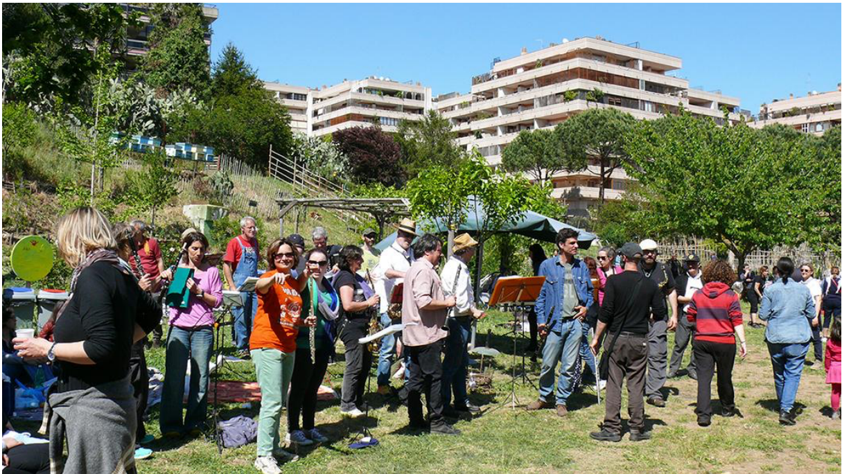
3. Événement organisé au jardin partagé Tre Fontane à l'occasion de la fête de la Libération, le 25 avril 2017. Cela représente un exemple parmi les nombreux moments festifs et collectifs organisés tels que le 1 er mai, les travaux communs ou l'anniversaire de l'association (Sachsé, 2017).

Le lien social entre les jardiniers est favorisé par des moments d'échange et de convivialité. Des événements sont organisés lors de diverses occasions, comme l'anniversaire des associations, mais aussi des événements historiques et politiques (figure 3). Ces moments sont ouverts au public, entendu ici comme les personnes non membres du jardin. En dehors de ces événements aussi, ces jardins sont ouverts : n'importe qui peut entrer et passer du temps dans les espaces communs sans demander la permission ni participer à la gestion comme cela nous a été rappelé en entretien par plusieurs membres du potager Garbatella et Tre Fontane .