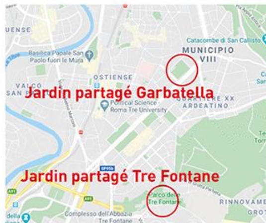
1. Plan de localisation des jardins partagés étudiés. La carte du haut présente l'ensemble des expériences d'agriculture urbaine sur le territoire de la Ville de Rome (Lupia et al. (2016), montage par nos soins à partir d'une carte google maps)

Le jardin partagé Tre Fontane voit le jour en 2012 à l'initiative des résidents du quartier qui ont nettoyé et réaménagé ce terrain en friche. Il est situé au sud de Rome, dans le parc des Tre Fontane , à la frontière entre trois quartiers ayant une composition sociale assez variée : l'EUR, Grotta Perfetta et Tor Marancia. Le quartier de Tor Marancia est une borgata 4 créée suite à des déplacements forcés de population du centre historique (Rossi, 1984 : 91). Le quartier de Grotta Perfetta s'est construit en