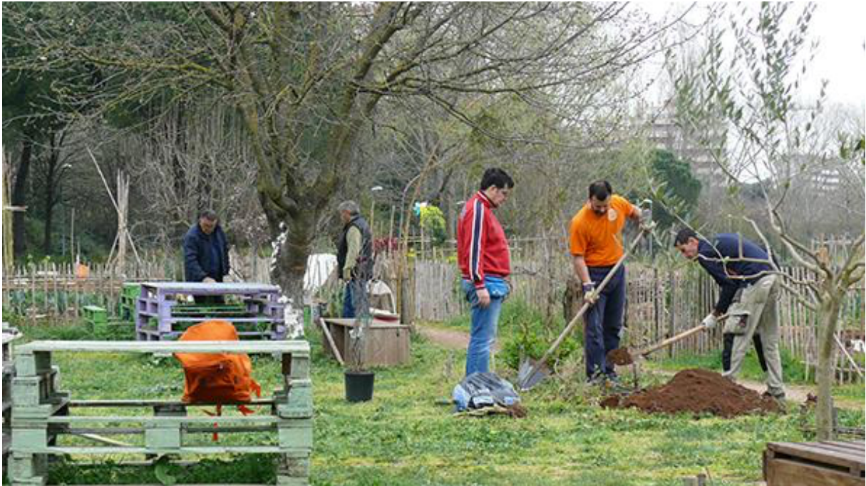
Journée de travaux communs au jardin partagé Tre Fontane, Rome (Sachsé, 2017)

Pour citer cet article : Sachsé V., 2020, « Planification informelle dans la ville de Rome : l'émergence des jardins partagés comme nouvelles formes de communs », Urbanités , Villes méditerranéennes : regards sur les espaces ouverts métropolitains, janvier 2020, en ligne .