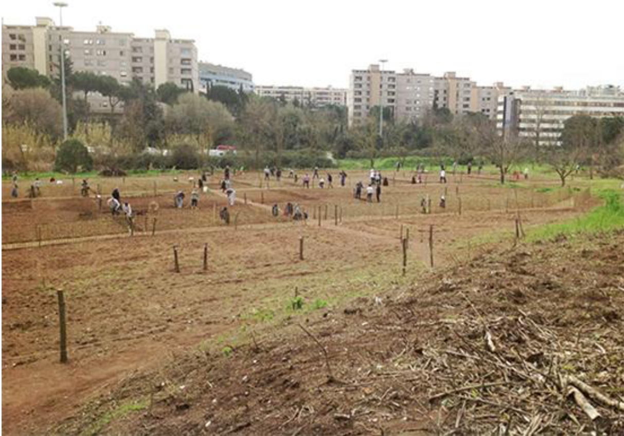
2. La préparation du terrain du jardin partagé Tre Fontane . Cette photo publiée sur la page Facebook de l'association illustre la volonté de publiciser les différentes étapes de la mise en place du jardin (Page Facebook de l'association, mars 2013).

revanche comme une zone de logement social, par la construction de lotissements conventionnés prévus par le plan d'urbanisme de 1962 ( ibid. , : 242). À l'origine, le potager urbain Tre Fontane s'étend sur près de 6 000 m 2 : aujourd'hui il s'étend sur environ 15 000 m 2 , dans un espace vert entouré de bureaux et d'immeubles résidentiels (figure 2).