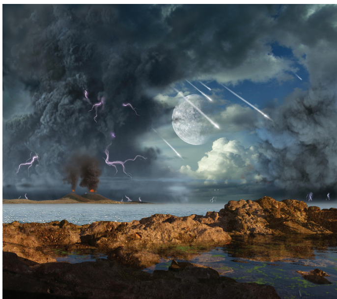
Figure 1 - Vue d'artiste de la Terre quelques centaines de millions d'années après sa formation : une atmosphère sans oxygène, des îles volcaniques au milieu d'une mer verte (à cause de Fe^{2+} , qui est soluble) et plus chaude, la Lune plus proche que maintenant, des chutes continues de micrométéorites et de météorites... « Tidal pool on primeval Earth », © Ron Miller, avec l'aimable autorisation de l'auteur.

La présence de matière organique a été essentielle pour l'émergence de la vie, mais d'où vient-elle ? Le carbone est un des éléments parmi les plus abondants dans l'Univers et de nombreuses molécules carbonées se forment dans le milieu interstellaire. Dans notre système solaire, ces molécules se sont ensuite retrouvées mélangées au sein des planètes, des astéroïdes et des comètes. Depuis sa formation il y a 4,54 milliards d'années (Ga), la Terre dégage le carbone sous forme de CO_2 depuis les volcans et sous forme de molécules organiques par les événements sous-marins. Cependant, cet apport est limité.