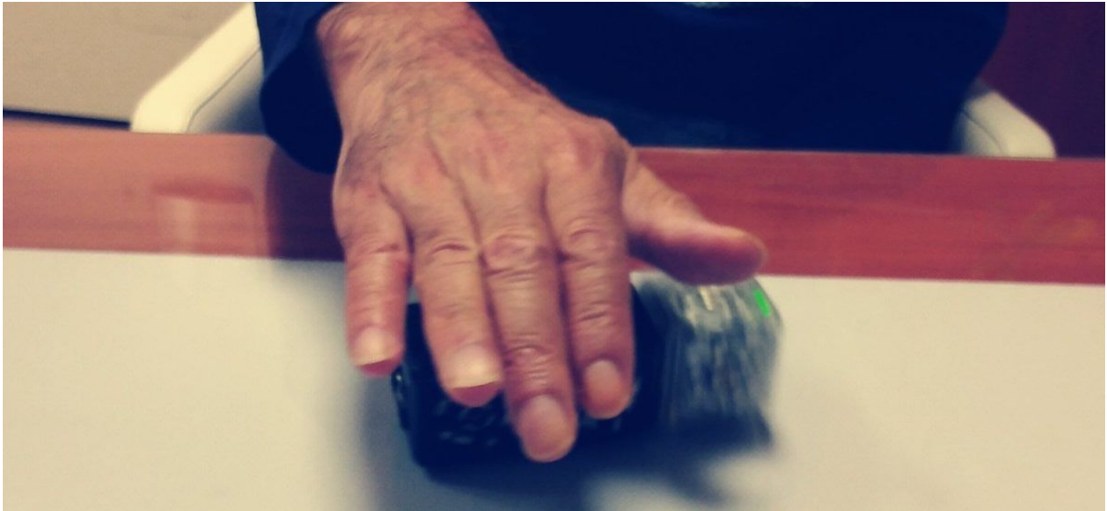
Figure 2. Résident d'un EHPAD participant à la tâche CreaCube.