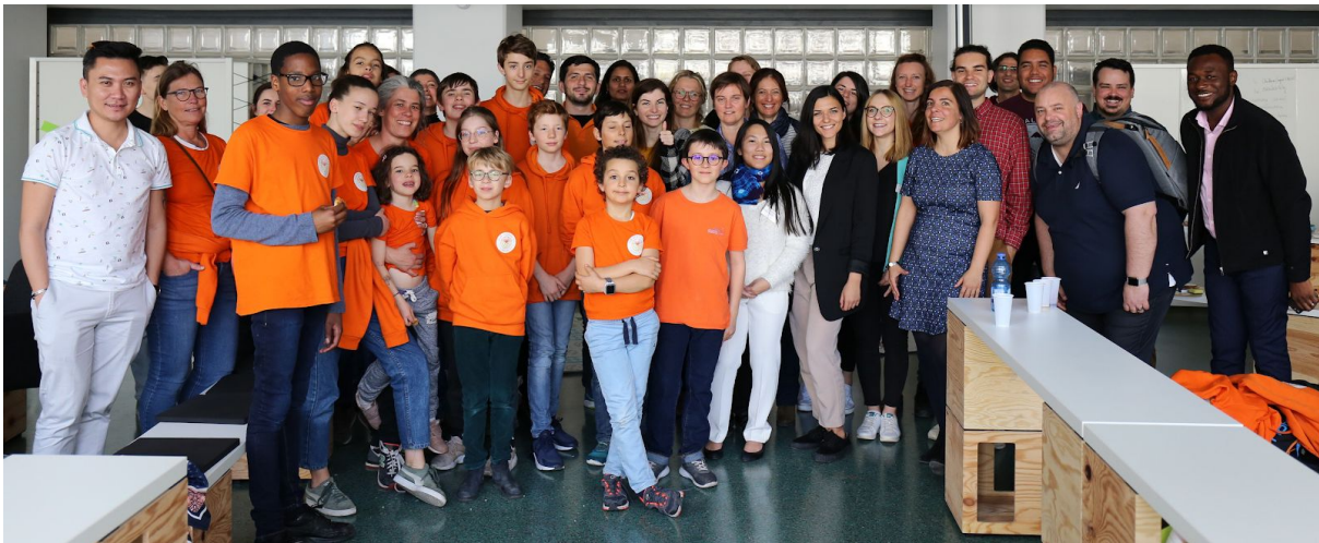
Figure 1. Workshop ANR CreaMaker 2019 avec des élèves participant à la tâche CreaCube..

Le but de ce document est de présenter le rapport intermédiaire du projet ANR CreaMaker. Le document débute par le rappel des objectifs du projet ANR CreaMaker, présente ensuite l'équipe engagée sur le projet, ses réalisations et les effets levier de ce projet. Nous aborderons également les adaptations liées à la situation COVID19.