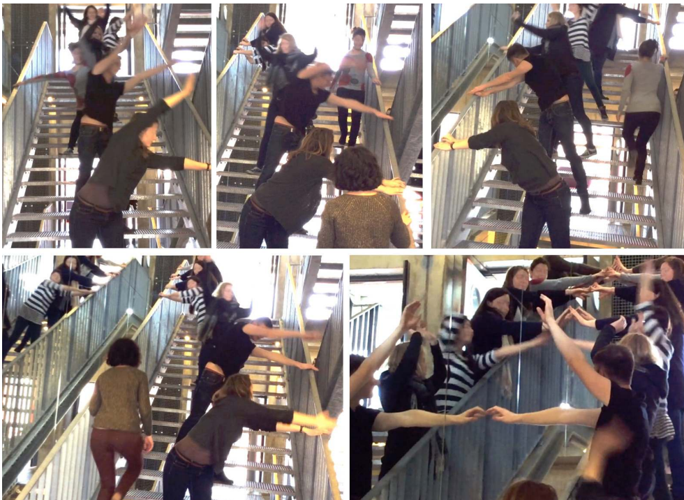
Illustration 4 : Identification à l'escalier