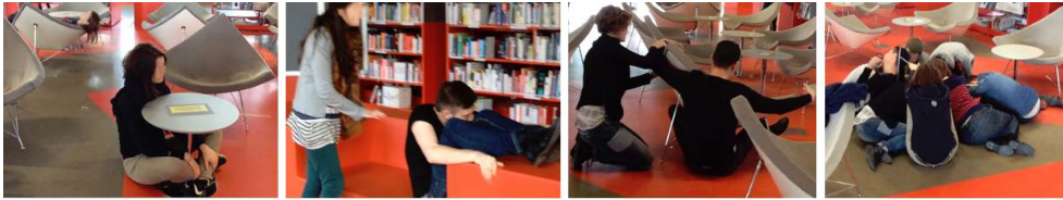
Illustration 5 : Fusionner avec le mobilier