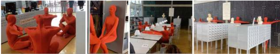
Illustration 7 : Vivre la couleur