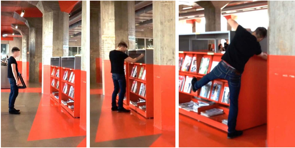
Illustration 2 : Étalonnage corporel