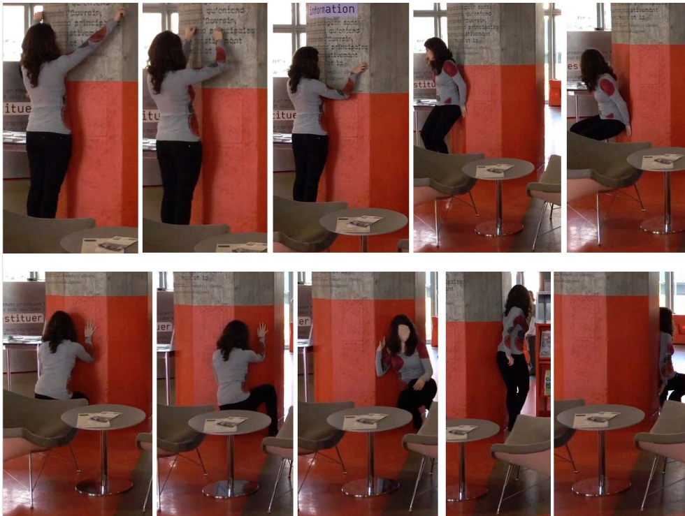
Illustration 1 : Étalonnage corporel