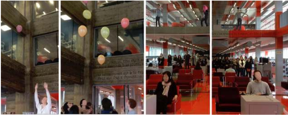
Illustration 8 : Une autre profondeur