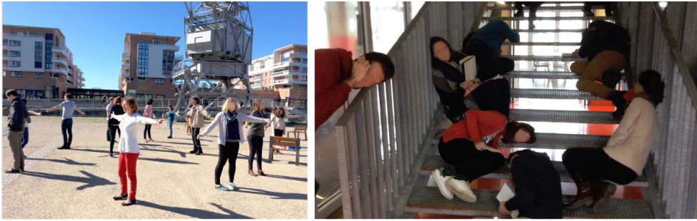
Illustration 6 : Écouter le paysage – Écouter l'escalier