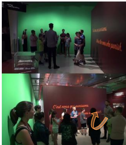
Fig. 4. Image 3 de l'extrait « C'est nous qui punissons » - Désignation incarnée du collectif

Cette actorialisation opérée par distribution et imputation d'une responsabilité aux personnes qui interagissent in situ , passe par la réélaboration d'un collectif faisant partie intégrante d'une scène sociale et politique, au-delà du musée. Participant du monitoring de l'interaction, la multimodalité favorise un jeu d'aller-retour entre le fait d'être ici et maintenant, dans le musée, où percevoir et interpréter le discours à destination des publics et être dans une société dont les caractéristiques anthropologiques sont en question, en problématisant des enjeux qui dépassent le cadre propre de la visite.