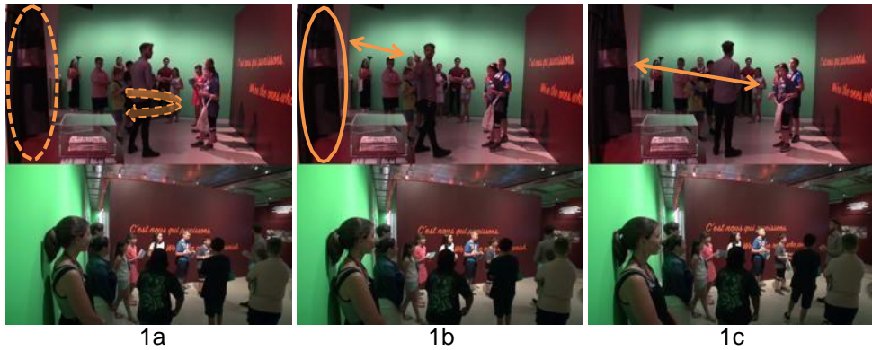
Fig. 2. Images 1a, 1b et 1c de l'extrait « C'est nous qui punissons » - Pointage de la robe de juge

Cet objet mobilisé dans un discours descriptif voit ainsi son statut évoluer au cours de l'échange. Cette occurrence spécifique, située sur le plan spatial, temporel et actoriel, vaut d'abord d'indice d'un type d'acteur particulier dans le milieu des pratiques carcérales (« le juge » au masculin et non « les juges » au masculin ou au féminin), puis elle est mobilisée dans la mise en discours d'une relation symbolique, ancrée socialement et historiquement (sur le plan pragmatique notamment, la robe de juge a une valeur illocutoire, en représentant les autorités juridiques dont les prérogatives sont définies à partir d'un encadrement légal lui-même en évolution). Le fait même que, dans cette visite, on ne s'attarde pas sur les spécificités de cette robe de magistrat du canton de Vaud, en Suisse, par rapport à d'autres corrobore cette appréciation abstraite de la scène du jugement au tribunal : ici, on est face à des actants dont on cherche à saturer le positionnement selon des scénarios prototypiques et non pas à acteurs impliqués dans des situations spécifiques.