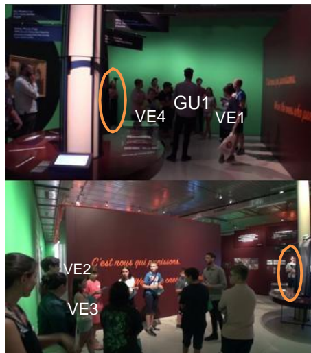
Fig. 1. Dispositif d'enregistrement – Ateliers webradio « Reporter au musée » MICR de Genève, le 02.07.19

Les enregistrements sont constitués (i) soit de deux plans larges sur la scène de l'interaction opérés par deux chercheurs et d'un plan réalisé à travers une caméra confiée aux visiteurs, (ii) soit de deux plans larges sur la scène de l'interaction opérés par les deux chercheurs seulement. C'est cette deuxième configuration que nous pouvons observer à travers la capture d'écran ci-dessous (fig. 1), où les personnes qui repèrent les caméras sont désignées par un ovale orange.