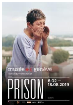
Fig. 5. Affiche exposition Prison au MICR de Genève 06.02-18.08.2019

Dans l'espace limité de cette contribution, nous pouvons souligner que la gestion de la signification a besoin de passer par au moins un cycle de conversions de valences entre expérience et discours et une transposition de valeurs d'un circuit situé vers un circuit généralisateur ou vice-versa. En ce sens, l'affiche de Genève montre un adolescent au sommet d'un bâtiment, sans des protections visibles, qui s'adresse à un interlocuteur hors cadre assez éloigné, ce qui semble justifier la posture d'un cri interpellatif.