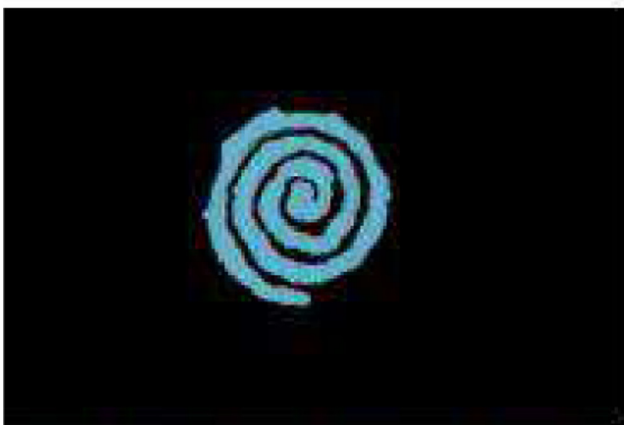
(c) Opération logique de soustraction pour obtenir le volume d'ablation