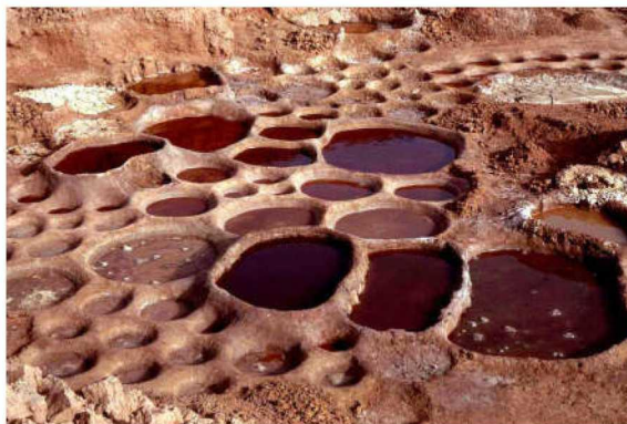
图三 尼日尔 Teguidda-n'Tessum 的晒盐池

入贮卤池内,在风和太阳的作用下池中水分逐渐蒸发。当卤水量和浓度都已足够时,再将卤水分别倒入一些小池子内蒸发。这样做有助于盐的结晶。待小池中水分蒸发将近,将池底湿盐刮出,储存在桶里。随后,湿盐将被塑形并晾干(图三)。