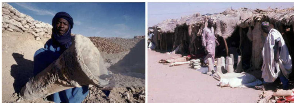
图五 尼日尔比尔马棕榈树皮卷成的盐模与阿加德兹市场的盐柱。可以观察到盐模由三块树皮组成,最宽的开口处成喇叭形,并带有接缝符号。(摄影:J.-L. Manaud 和 P. Gouletquer 顾磊 - 1974)

作的坚硬盐块。这种硬化过程似乎与容器的大小并没有关系。这正是尼日尔的比尔马(Bilma)和 Teguidda-n'Tessum 盐场所发生的情况。在比尔马,人们将膏状盐从盐池中取出,置入用厚厚的棕榈树皮缝合而成的筒状盐模(经常被误会为空树干)内,过程与自贡地区以胶皮圈盛盐非常相似(图五)。脱模,这一工序与孩童在海滩边玩耍沙子一样。脱模后的坚硬盐块则被骆驼或卡车穿越沙漠运输到 500 公里以外的阿加德兹(Agadez)市场。在那里,盐块被斧头碎成小块卖给顾客。