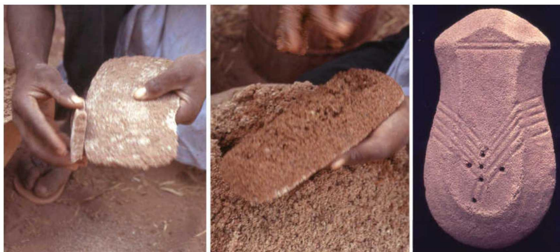
图六 尼日尔 Teguidda-n'Tessum 的盐饼造型

最后,在大西洋沿岸,从几内亚到布力塔尼的所有盐沼中,雨季时人们都会将盐堆暴露在外面。雨水把盐堆表面的杂质冲刷掉,后经日晒并硬化,这一过