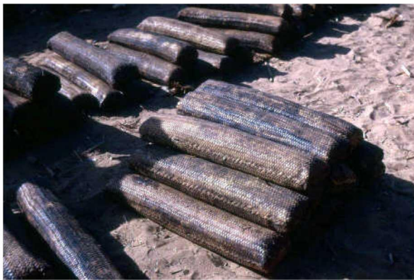
图七 尼日尔 Dallol Fogha 的小苏打饼包装