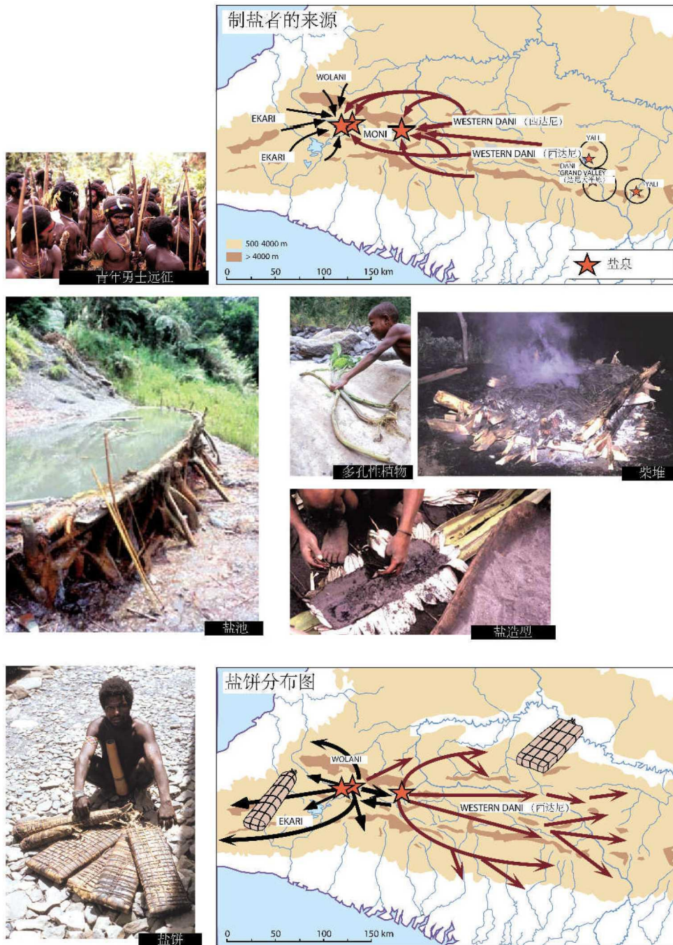
图二 巴布亚高原的盐业生产与流通(新几内亚岛,印度尼西亚):西达尼人的征途 (摄影:O. Weller 魏井仁,线图 P. Pétrequin 和 O. Weller 魏井仁)

最后,筛出的盐和草木灰要放在垫有叶子够长才能折叠的露兜树叶子的一个方形木盒内压制成形。盒子是由小木板和竖直的小木柱制成。在将盐块用