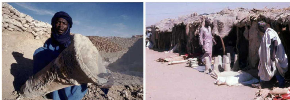
图五 尼日尔比尔马棕榈树皮卷成的盐模与阿加德兹市场的盐柱。可以观察到盐模由三块树皮组成,最宽的开口处成喇叭形,并带有接缝符号。

作的坚硬盐块。这种硬化过程似乎与容器的大小并没有关系。这正是尼日尔的比尔马(Bilma)和 Teguidda-n'Tessum 盐场所发生的情况。在比尔马,人们将膏状盐从盐池中取出,置入用厚厚的棕榈树皮缝合而成的筒状盐模(经常被误会为空树干)内,过程与自贡地区以胶皮圈盛盐非常相似(图五)。脱模,这一工序与孩童在海滩边玩耍沙子一样。脱模后的坚硬盐块则被骆驼或卡车穿越沙漠运输到 500 公里以外的阿加德兹(Agadez)市场。在那里,盐块被斧头碎成小块卖给顾客。