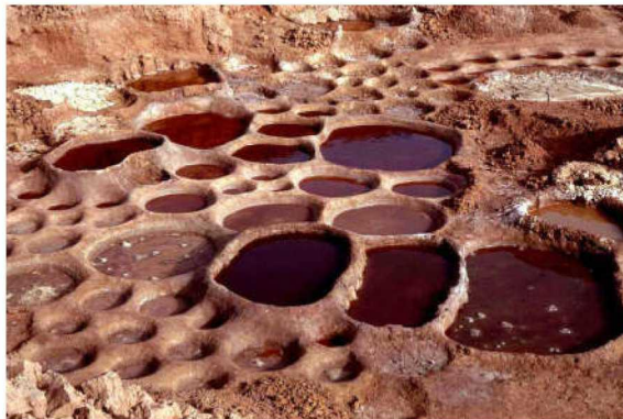
图三 尼日尔 Teguidda-n'Tessum 的晒盐池

入贮卤池内,在风和太阳的作用下池中水分逐渐蒸发。当卤水量和浓度都已足够时,再将卤水分别倒入一些小池子内蒸发。这样做有助于盐的结晶。待小池中水分蒸发将近,将池底湿盐刮出,储存在桶里。随后,湿盐将被塑形并晾干(图三)。