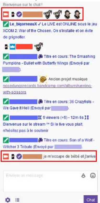
Fig. 2. Chat de session de jeu (détail agrandi de la fig. 1).