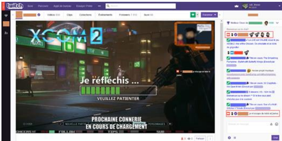
Fig. 1. Session de jeu sur Twitch - 29/09/2017.

Ce dernier possède plusieurs canaux de communication. En effet, il est présent à la fois dans l'espace audio-visuel de la diffusion mais également dans l'espace de clavardage. Cependant, l'observation met en évidence une tendance en vigueur sur la plateforme : les joueurs n'interviennent que ponctuellement dans l'espace de clavardage. Celui-ci leur permet par exemple de diffuser des liens, d'annoncer leur venue dans le cadre audio-visuel en début de session, etc. À titre d'illustration, on peut se reporter aux figures 1 et 2, ci-dessous.